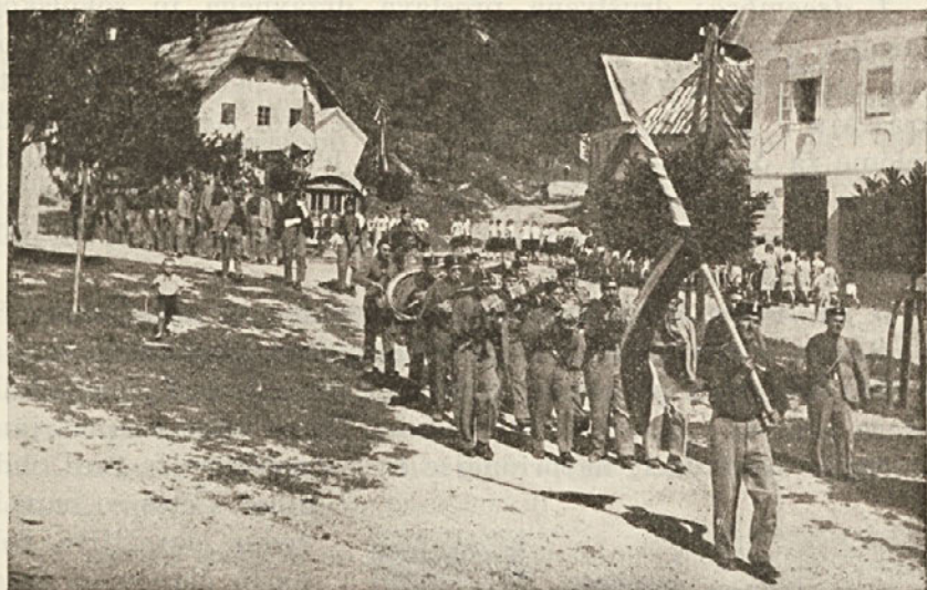
Propagandni izlet v Koprivnik: Izprevod z ribniško sokolsko godbo na čelu

Po telovadbi se je razvila prijetna zabava in izmenjavanje misli, zlasti z brati iz Koprivnika. V najboljšem razpoloženju, z močnimi vtisi, smo ob 17. uri zasedli avtomobile ter se vrnilo proti Ljubljani.