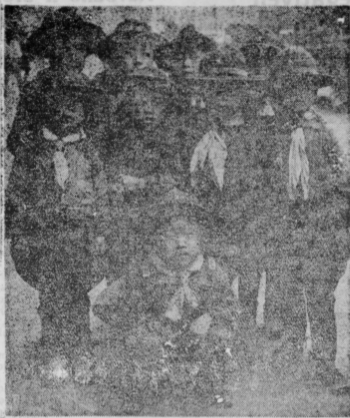
Mali južnokorejci so tudi skavtje