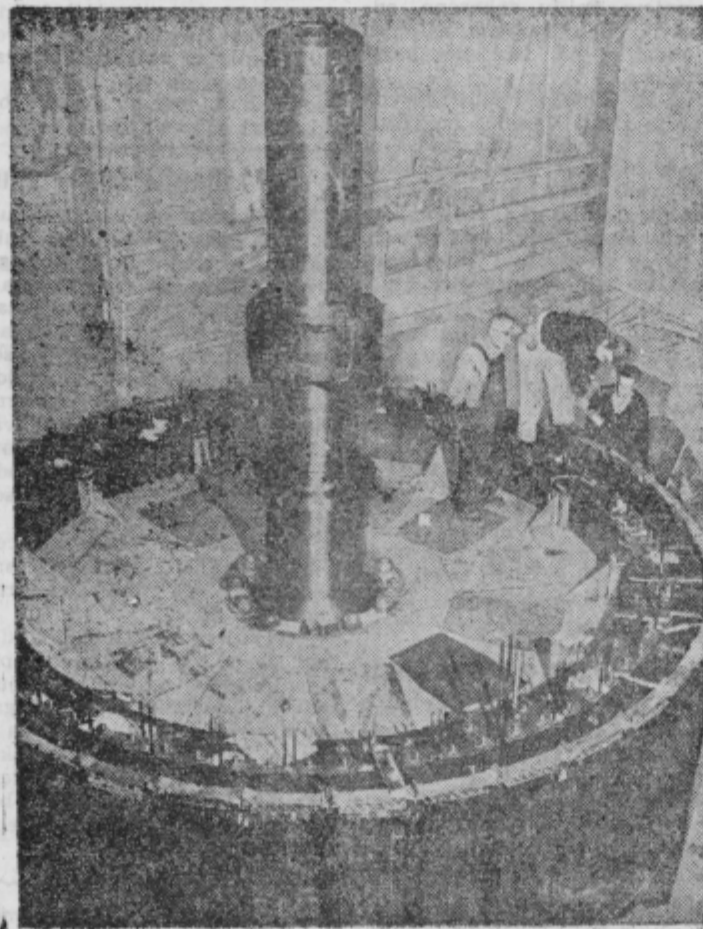
Orjaški 330 ton težki motor, katerega rotor predstavlja gornja slika — res predstavlja »čudo« moderne elektrotehnike.