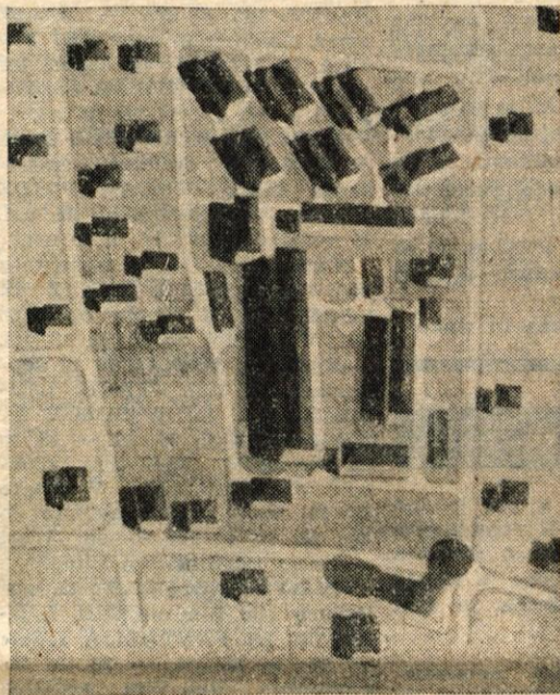
Maketa II. osnutka z velikim blokom sredi naselja. Gradnja bi veljala 25 milijonov več, kot gradnja naselja po I. osnutku.

Pretekli teden je bil v Kranjski gori roditeljski sestanek za starše, katerih otroci se šolajo v kranjskogorski osemletki. Sestanka so se udeležilo nad 160 staršev, ki so zvedeli za stanje v šoli, o pomenu šolske reforme pa je govoril ravnatelj gimnazije Jože Gazvoda. — J. S.