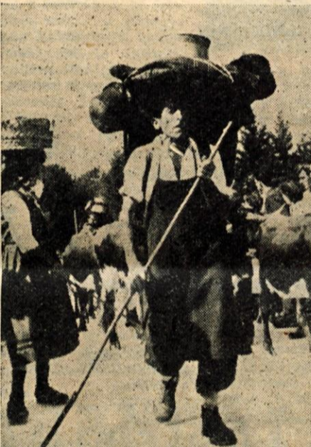
Planšar s planine baše, ker tam ni več za krave paše