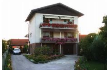
Stanovanje JURČIC Spodnji Gaj 16, Pragersko