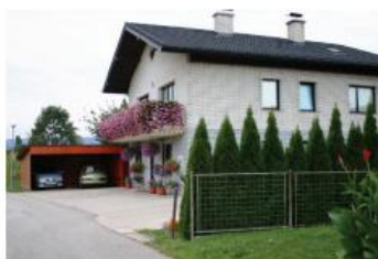
Vera REIHSS Pongrce 27a, Cirkovce