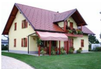
Rosmarie in Robi ŽITNIK Starošince 40a, Cirkovce