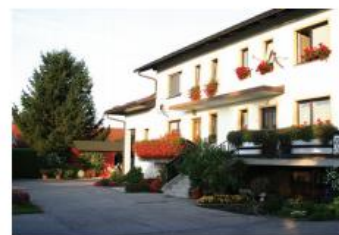
Zinka DOLENC Šikole25b, Pragersko