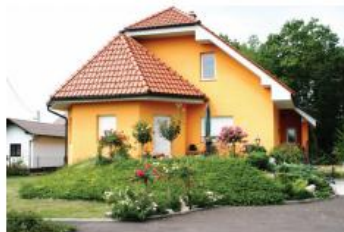
Darja OROŽIM Cesta na Hajdino 27, Njiverce