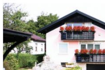
Družina PAVEO Kungota pri Ptujju 146, Kidričevo