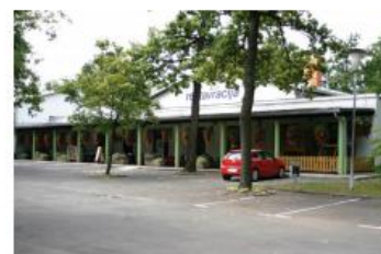
RESTAVRACIJA PAN Tovarniška cesta 7, Kidričevo