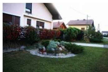
Družina BAUMAN Dragonja vas 27, Cirkovce