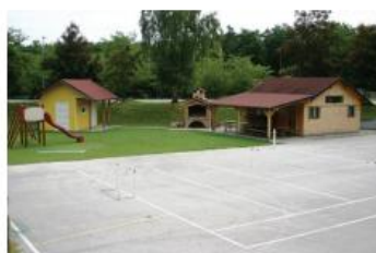
ŠPORTNO DRUŠTVO STRNIŠČE Strnišče 6b, Kidričevo