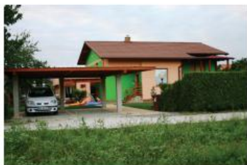
Simona in Branko RODOŠEK Sp.Jablane 42c, Cirkovce