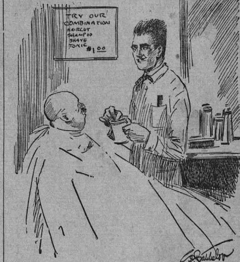
BARBER—SHOOTING THE MILLENNIUM Barber—"That pate of yours will never have a thatch. Why, I might as well try to raise a lily on a billiard ball."