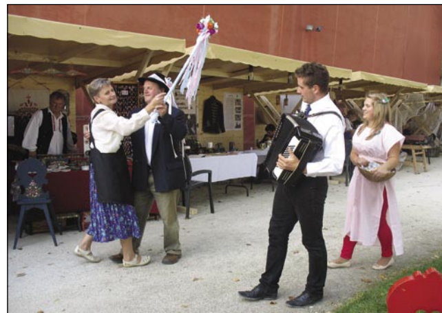
Zvač nej samo zvau, pleso je tö