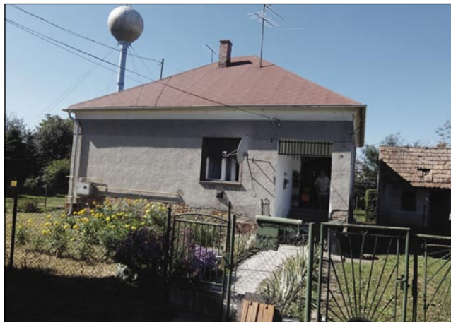
Na rami je dala vömeniti strejo

»Pa vejš, ka smo gazdūvali, meli smo edno kravo, tisto sem zvekšoga vsigdar dja dudjila prvin kak bi v šaulo išla.