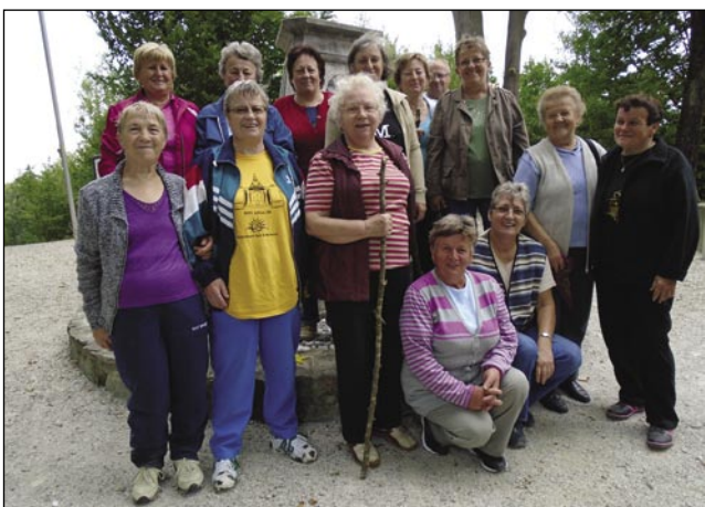
Penzionistke pred obeležjem na tromeji

brga prišle, je Hugi vpamet vzela en friški capaš od motora, pa je včasim pravla, ka je tau takši motor, kak ga njeni mauž Feri ma. Gnauk samo vidimo, ka pri ednom gabri vcujpostavljeni stoji motor. Hugi se je korila s svojim možaum, kak