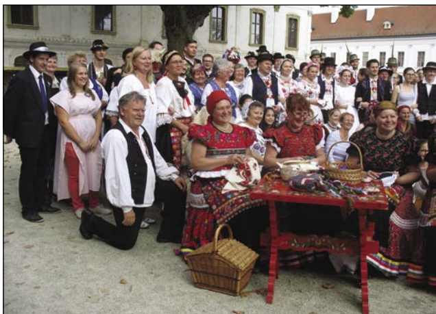
Porabci na skupinskem kejpji (z leve)

z dostafele mintami. Tretji dokument smo pa dobili mi, za porabsko borovo gostüvanje . Tak je nas na lišti že 25, če tiste majstre ljudske umetnosti za eno računamo, štere so najoprvm gorvzeli. Med njimi je prišo na lišto 1984. leta slejdnji