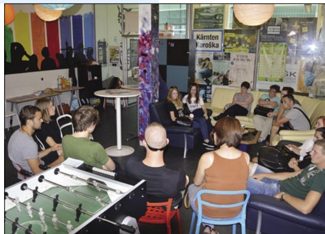
Druženje in pogovor Porabcev in Korošcev

Onadva sta najpej predstavila, kakšen namen ima Mladinski