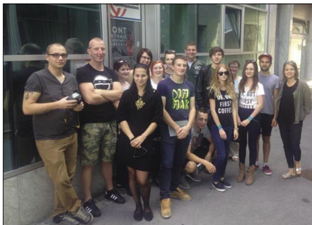
Skupinska slika pred sedežem tamkajšnje mladine

Društvo porabske mladine vse počneje Slovenci v Avstriji. Po kratkem obisku smo se