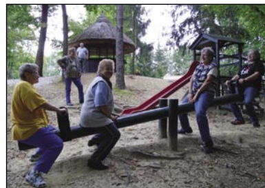
Hujckancka je tö redno vödavala

pravla, ka stari človek pa malo dejte sta vküp valon. Tau pa zatok, ka sem vidla, kak dobro so se naše ženske počütile na mlašeči igralaj, gda so se čüskale ali hujckale. Vse so zadovolne bile, ešče tista tö, stera je 78 lejt stara. Nika ne deje, če je prej mokra bila, dočas je do cilja prišla, tau ji prej nede škau-dilo, ka je prijetno trüdna. Čas nam je brž odleto, napautile smo se nazaj v ves. Zdaj so