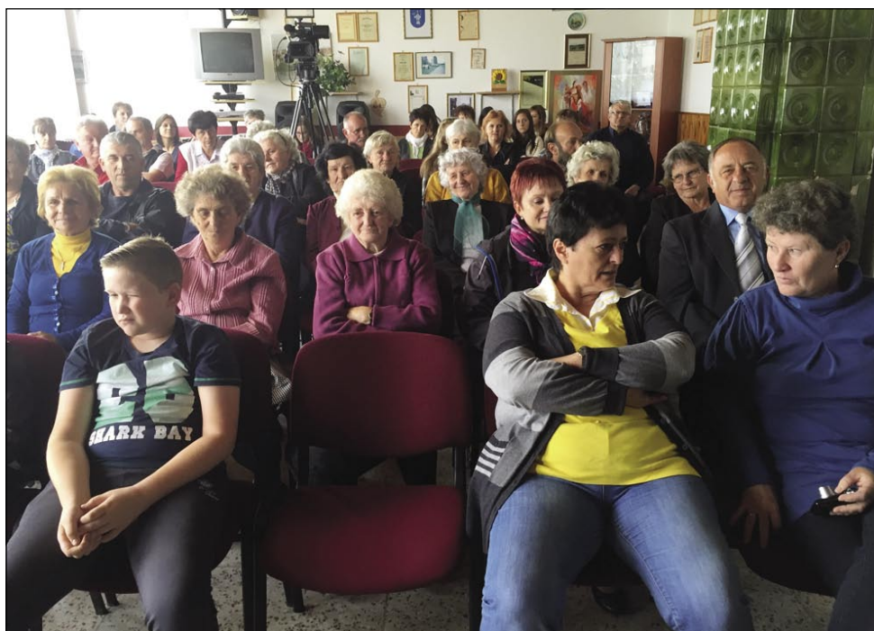
Če rejsan je bilau vrejmen sunčno, se je kulturni dom v Števanovci skoro napuno

dašnjom žitki. Pri enoj držini na nikoj pridejo aparat za kafej, hladilnik, sesalec, pralni mašin pa druga tehnika. Gazda na vse tau pravi, aj ženske delajo vse po indašnje. Gda pa televizor tō gorpovej, začne ovak brodit. Na konci se zglijata z ženauv: večer ta se stisnila kak v stari časaj.