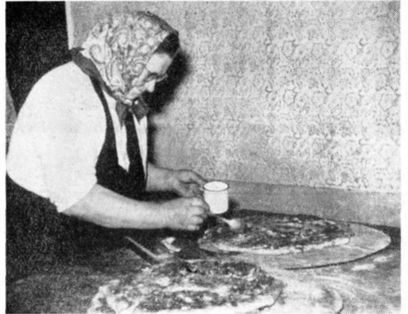
V naših gostiščih je mogoče dobiti vedno več domačih specialitet med temi so posebno iskane gibanice. Žal so včasih precej drage, pa tudi zmanjka jih prehitro. Na fotografiji: Tako naše mamiče pripravljajo gibanice.