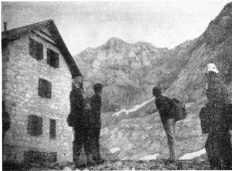
Zemljičevi bratje in sestre iz Zg. Ščavnice so se letos podali na Triglav. Na sliki jih vidimo pod triglavskim vrhom.