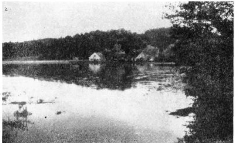
Na fotografiji: V dolini Pesnice je letos pogosto poplavljaljo. Uničena je bila trava, posevki in ogrožena, nekatera poslopja. Na posnetku vidite Matjašičev mlin v Gočovi ob zadnjih poplavih.

Po ugotovitvah občinske skupščine je bilo letos na območju naše občine na gospodarskih poslopih za 4 milijone 800 tisoč din škode, zaradi poplav. Na posevkih zasebnih kmetovalcev pa je bilo škode za milijon 500 tisoč din. Verjetno je bila škoda še znatno večja. Š d