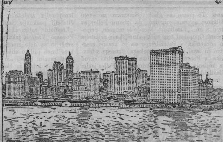
Die neuen Wolkenkratzer im New-Yorker Hafenviertel.

V glavnem trgovinskem okraju ameriške prestolice Novi York zgradilo se je v zadnjih letih celo vrsto velikanskih poslopj. Sploščo se imenuje ta izredno visoka poslopja, ki imajo 10—20 nadstropj, »Wolkenkratzer.« Ta poslopja spremenila so tudi pogled na pristan Novega Yorka. Naša današnja slika kaže v tem oziru najznačilnejši južni del mesta Novi York, ki stoji v okvirju nepretrgane vrste »dokov« in mostov za izkrčevanje. Razven mnogo poslopj borz in bank je tam tudi jako veliko trgovinskih hiš. Da se izrabi ozki in dragoceni prostor, zidana so poslopja izredno visoke, kakor stolpi. Poslepje »Park Row Building« n. p. ima 29 nadstropj in je 116 metrov visoko. Poslepje »Pulitzer Building« zopet ima 116 metrov visokosti ter šteje 22 nadstropj.