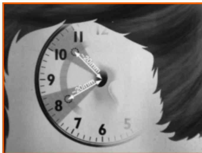
Slika 1: Priporočeni okvir pravega položaja kostnih vsadkov pri avrikularni epitezi.

Pri protezah za spodnje ude so silikon najprej pričeli uporabljati pri serijski izdelavi silikonskih vložkov, in sicer že leta