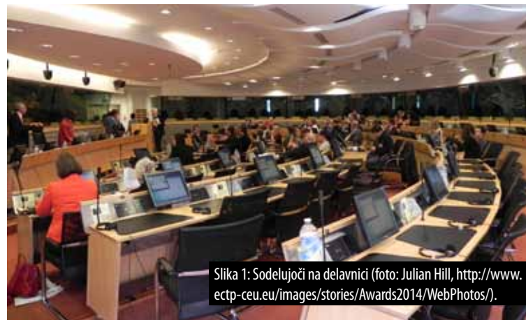
Slika 1: Sodelujoči na delavnici.

Prejeti odgovori so potrdili dve izmed štirih hipotez. Ovrženi sta bili hipotezi, ki sta predpostavljali, da so prebivalci prepozno vključeni v proces odločanja ter da niso informirani o energetskih načrtih občine. Preko 90 % vprašanih je odgovorilo, da so z načrti seznanjeni in da jih zanima nadaljnji razvoj. Kot pravilna se je izkazala hipoteza, da prebivalci ne želijo živeti v bližini kotlovnice (NIMBY efekt), vendar pa je 70% vprašanih sodobne objekte energetske infrastrukture (fotografije v vprašalniku) opredelilo kot estetsko sprejemljive. Večina vprašanih (več kot dve tretjini) meni, da je biomasa eden izmed ekološko prijaznejših načinov ogrevanja, prehod na daljinsko ogrevanje pa se jim zdi pravilna izbira. Potrjena je bila tudi hipoteza, ki predpostavlja, da so mnoga gospodinjstva zaradi dostopnosti pred kratkim prenovila svoje sisteme ogrevanja (70 % sodelujočih je svoje sisteme prenovilo pred manj kot šestimi leti) in jih sistem daljinskega ogrevanja ne zanima.