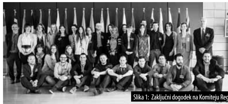
Slika 1: Zaključni dogodek na Komiteju Regij

V izdelavi je e-publikacija, ki bo vsebovala povzetek delavnice in vse prispevke sodelujočih ekip. Dostopna bo na www.ectp-ceu.eu .