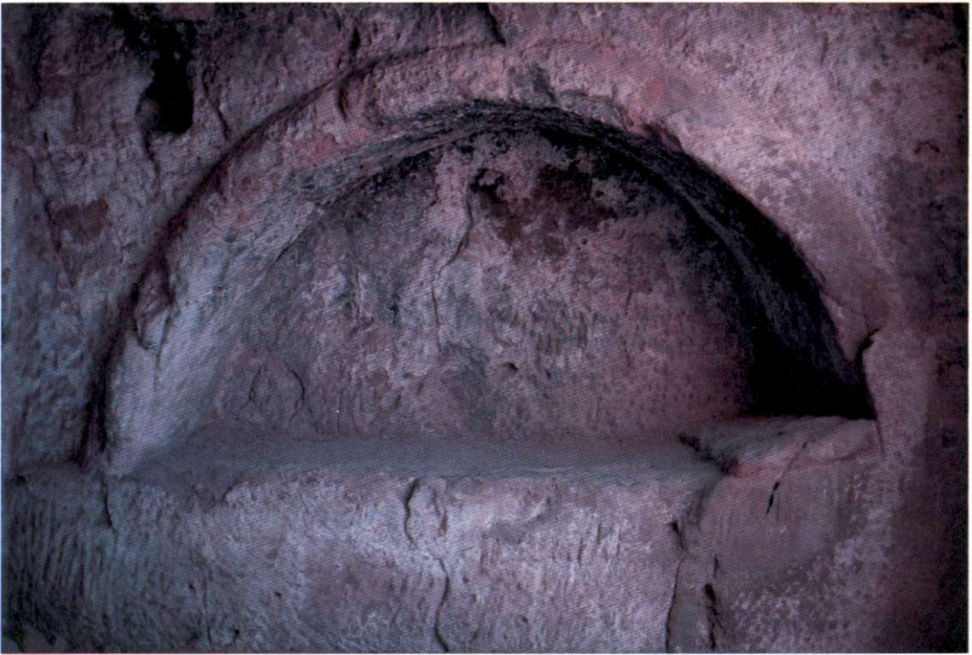
Slika 6: Edikula v eni od votlin v Matali je precej natančno obdelana. Polkrožni lok ima fino izdelan rob, rdečost je izklesana blazina. V takšne stenske niše so polagali trupla pokojnikov. Podoben način pokopavanja v času predkrščanskega antičnega Rima zasledimo v rimskih katakombah.