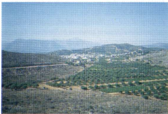
Slika 1: Ravnin je na Kreti malo, zato je planotast svet večinoma skrbno obdelan. Na fotografiji je nasad oliv, ki se uvrščajo med glavne kmetijske pridelke. V ozadju je Mohos, pretežno agrarno usmerjeno naselje. Podobno je z večino naselij v notranjosti Krete, saj je turizem vezan predvsem na ozek obalni pas.

V mladonagubanem gorstvu Krete prevladujejo apnenci mezozojske starosti. Marmorji na zahodnem delu otoka so posledica tektonske metamorfoze. Presenetljiva je najdba debelega sloja bazaltnih kamnin, ki opozarjajo na spremenjeno tektoniko ob koncu mezozoika. Ravnine in nižine so prekrile s kvar-