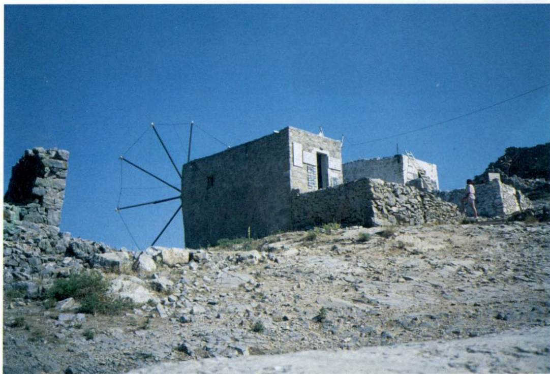
Slika 2: Takšni mlini so vse od 12. stoletja dalje služili za mletje moke. Krečani so jih gradili na gorskih slemenih, kjer pihajo stalni vetrovi. Praktična rešitev mlinove vetrnice nas opozarja na tesno povezanost otočanov z morjem. Vsaka prečka v vetrnici je namreč jambor zase in "jadra" na njih so razpenjali glede na jakost vetra.

Številne planote na Kreti ležijo na višinah med 700 in 1400 m nad morjem. Ker je prst na njih večinoma rodovitna in ker imajo urejeno umetno namakanje, so primerne za kmetijstvo. Najrodovitnejša je slikovita planota Lasithi na višini 900 m. Ravnega sveta je malo, največ ga je na severni obali. Na južnem delu otoka je prostrana ravnina Mesara, ki je