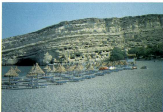
Slika 5: Matala, nekoč majhna ribiška vasica ob zalivu Mesara, je danes priljubljeno turistično mesto. Njen zaščitni znak so votline v rahlo poševno padajoči apnenčasti steni. Prve so izkopal že v prazgodovini za bivališča, preostala večina je iz 1. in 2. stoletja, ko so služile za grobnice. Kretske plaže so lepo urejene, ponudba na njih je pestra, poleg tega jih vsako jutro sproti očiščijo.

Na Kreti ni megalomanskih hotelskih kompleksov po španskem vzoru, vendar je kljub temu