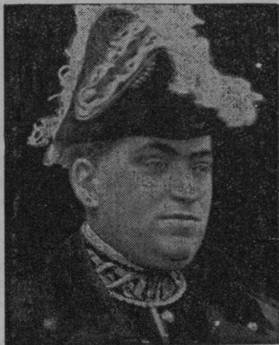
Calvo Sotelo, vodja španskih monarhistov, je bil umorjen od policije pod levičarsko vlado.

Hoče pri Mariboru. Opozarjamo cenjeno občinstvo na veliki koncert, ki se vrši v nedeljo dne 26. julija, ob treh popoldan, na dekanijskem dvorcu v Hočah. Trije zbori: št. Janž, Cirkovce