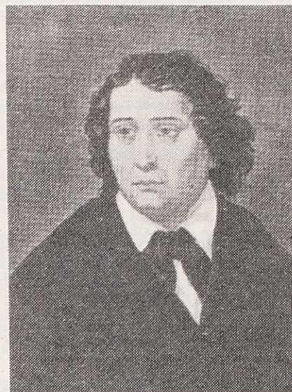
FRANCE PREŠEREN – Utrl je pot slovenski poeziji