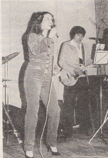
Na prireditvi je za športnike in športnice zapela tudi znančka s TV ekranov Zorica Fingušt.