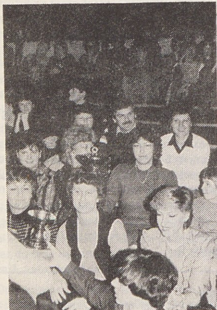
Najaktivnejše v letu 1982 so bile sodelavke skupnih služb GPS. Pokal Gorenja so si resnično zaslužile.