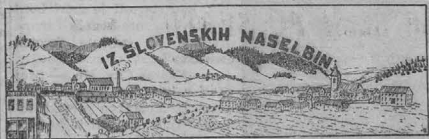
IZPOD ZVONA SV. ŠTEFANA.

Po teh volitvah je mogoče napovedati sledečo smer nortranje politike v češki republici: Pod pritiskom socialističnih strank bodo spet stopila v ospredje vprašanja, ki zadevajo socialne težnje malih ljudi, kmetov in delavcev. Manjšinsko vprašanje bo prišlo do večje veljave, ker se bo bržda spet ustanovila vlada na podlagi sporazuma med nekaterimi češkimi in nemškimi strankami, ali vsaj s prijazno podporo kake nemške stranke. Zunanja politika pa bo tekla kot dosedaj po poteh miru, sporazuma med narodi in bo težila za tesnejšim sodelovanjem novih držav v Podonavju.