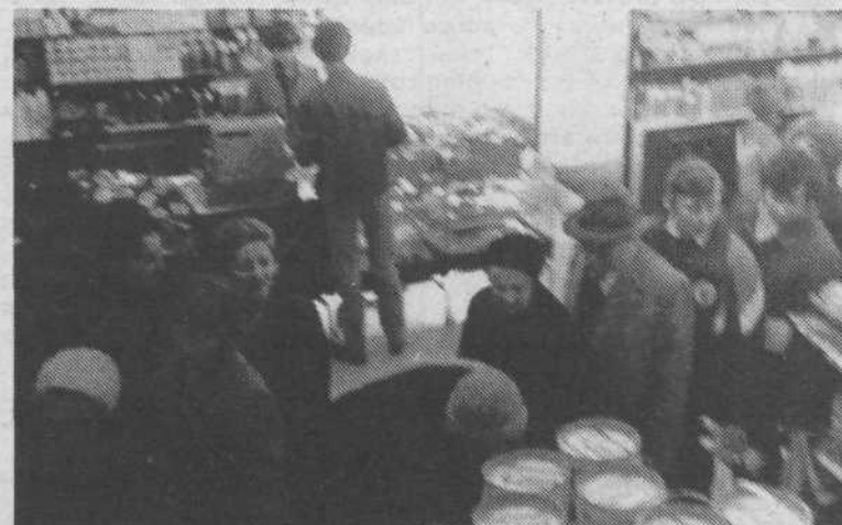
4. Pralni praški so še vedno najbolj iskano blago v Ljubljani. In kjer jih dobijo, se takoj naredi vrsta. Da bi te dragocene praške dobilo čim več gospodinj, ga vsaka dobi le en zavitek. Zato so takele vrste, kot smo jo pred nedavnim videli v Nami, dragocen vir zaslужka za marsikaterega dijaka. Za desetaka se postavi v vrsto in kupi pralni prašek za zalogo iznajdljivi gospodinj. Tako se časi spreminjajo, včasih smo preprodajali vstopnice za kino, danes pa vrstni red za pralne praške.

Pa saj nimamo nič proti takemu načinu prodaje in nakupa. Vendar pa menimo, da ti »štanti« le ne sodijo pod Plečnikove arkade. Kaj ko bi živilski trgi poiskali primernejšo lokacijo za te prodajalce, kje ob bregu Ljubljance?