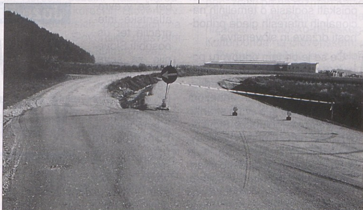
Obvoz Filterwerka še ni dokončno zgrajen, verjetno pa ga bodo za promet odprli še letu 1996.

Filterwerk v Šmihelu nad Pliberkom, ki je največja tovarna v Podjuni, je pred kratkim dobil obvoz. Cesto med Metlovo in Šmihelom je prevzela v svojo oskrbo dežela Koroška in je cesto razširila in na novo asfaltirala. V sklopu s tem so zgradili tudi obvoz tovarne. Občina Bistrica je prispevala 30% (2,1 mio. šil.). Obvoz bodo predvidoma odprli še v letu 1996.