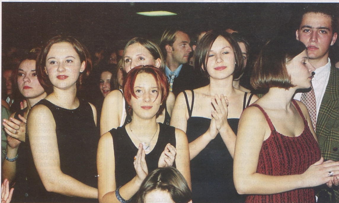
Dom sindikatov je bil poln lepotic.

Dom sindikatov je bil tudi tokrat primeren kraj za ples maturantov Trgovske akademije; ples so letos priredili že tretjič. Kakor običajno se je maturantski ples pričel s polonezo maturantov, končal pa dan navrh ob približno 9. uri zjutraj v kavarni Kosta v Celovcu. Medtem so se gostje plesa zabavali in plesali ob zvokih „John Otti-Band“ in tria Storžič. Pripravljen je bil tudi srečolov z nekaterimi zelo dragocenimi dobitki. Seveda tudi ni manjkal polnočni vložek maturantov.