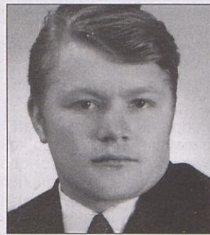
DRVEŠA VAS - LIBUČE