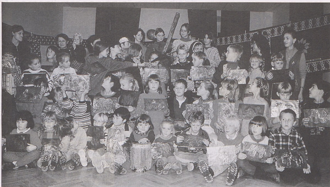
V Žvabeku so društveniki zelo aktivni. Danes, v petek, 22. novembra, vabijo na Koroški večer v gostilno Hafner. Pretekli teden pa je bil čisto v znamenju otrok, za katere je bil pripravljen raznolik program, od martinovanja do obiska misijonarke iz Afrike. Na sliki vidite žvabeško mladino z njihovimi pedagogi v ljudski šoli, kjer se tudi izven šolskega pouka mnogo ustvarja.