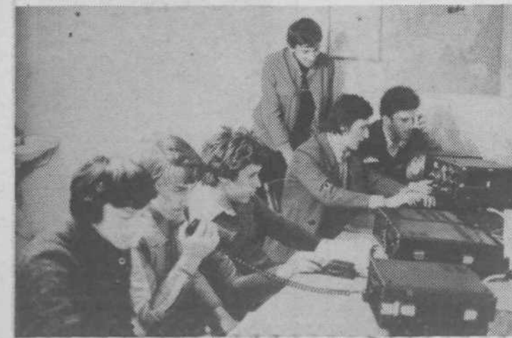
Radioamaterji ob novih radijskih oddajnikih

velik problem. Na začetku je večkrat kazalo, da društvo ne bo moglo začeti, saj ni bilo niti ustreznih prostov-