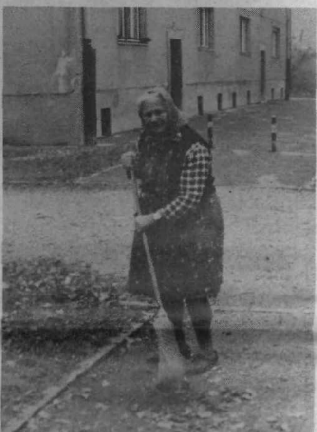
METLA ZA LEPO OKOLJE – Jesen je tu, listje odpada in prekriva cestnišča in pešpoti. Tja, kamor ne seže »komunala«, pa priskočijo pridna roka krajanov. Tudi ta mamca je prišla za metlo, da bi počistila vse tisto, kar naj ne »prizimi« pod snegom. Da bo lepša pomlad!

Glede na velikost krajevne skupnosti in zaradi velikega števila otrok bo v bodoče potrebno aktivnost društva razvijati po posameznih lamelah (2 ali 3 skupaj), vendar za to potrebujemo več aktivnih članov ter organizirane pionirsko-mladinske aktivne v posameznih lamelah. V lameli 22 in 24 na Bratovževi ploščadi je tak aktiv že formiran.