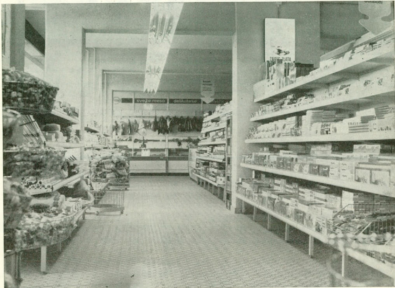
Privlačna in okusna notranja razporeditev blaga

gorje ni elastična, ker speče le toliko kruha, kolikor ima planiranega, čeprav dam večja naročila, zlasti za sobote, ko mi kruha zmanjka. Precej prodamo zelenjave, za kar gledam, da imam vedno svežo in dovolj na zalogi.«