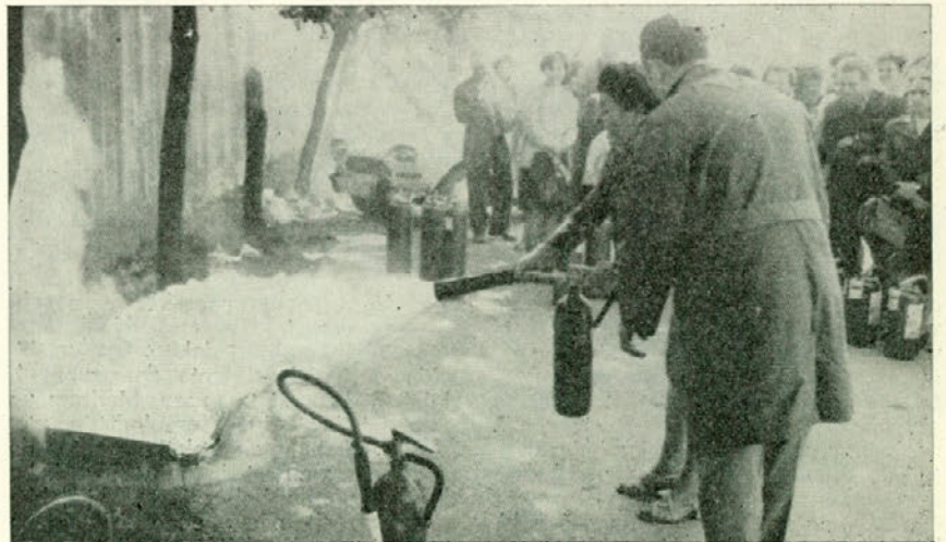
Udeleženci tečaja pri praktičnih vajah

Ni naključje, da so slabši uspehi bili specifični za posamezne enote. Mirno lahko trdim, da gre za tiste enote, katerih vodilni delavci ne pripisujejo potrebnega pomena področju varstva pri delu in ga celo tretirajo kot nujno zlo. Taka miselnost pa more izvirati le iz preozke ali pa enostranske strokovne razgledanosti. Načela sodobne pedagogike narekujejo, da se prvenstveno vodje vede tako, kot pričakuje in zahteva, da se bodo vedli in ravnali delavci v postopku usposabljanja. To pomeni, da mora biti vodja vzor za vse tisto, kar se od ljudi pričakuje, ker jim daje s tem pobudo, da povzamejo njegovo vede-