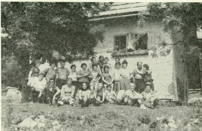
Skupina izletnikov na Vograju

li na obronku in strmeli v veliko Triglavsko jezero, ki se je prelivalo iz bele v modro, do temno zelene barve, poleg pa prijazno kočico, ki naj bi nam nudila zatočišče. Nekje na skali je bilo zapisano: »Molče uživaj lepoto planin«. Slišal si samo tiho, kot vzdih: »Izplačalo se je« — to so bili tisti, ki so bili prvič v gorah in so imeli največje žulje na nogah.