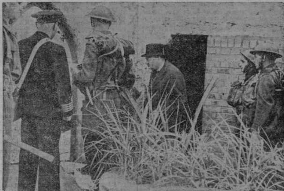
Angleški ministrski predsednik Churchill na ogledu utrdb, ki bi naj onemogočile Nemcem izkrcanje v Angliji

sumijo, da je siaba voda kriva temu. Radi tega bi bilo potrebno začeti misliti na to, da se za št. Ilj napravi vodovod, iz katerega bi dobivali ljudje v nižavi razčiščeno in zdravo vodo. — Nova cesta od Mure mimo tovarne v Ceršaku skozi vas Ceršak do banovinske ceste št. Ilj—Marija Snežna bo kmalu gotova. Vsi pametni in dobro misleči ljudje so veseli te nove ceste. Neki kričaji, ki imajo svoje srce čisto nekam drugam obrnjeno, so sicer hudo rogovillili proti tej cesti, pa jim vse skupaj nič ni pomagalo. Naša tovarna lepenke, ki že nad 40 let daje kruha našim delavcem, bi morala ustaviti obrat, ako se cesta ne bi zgradila, ker je nemogoče, da bi stalno morala prevažati les in tovarniške izdelke z brodom preko Mure ter po ozemlju Nemčije preko Špilfelda isto voziti na kolodvor v št. Ilj. Občina bi zgubila lepe tisočake na dokladih, ki jih tovarna plačuje, nad 100 delavskih družin pa bi bilo brez zaslužka, ko sedaj vendarle nekaj dinarjev zaslužijo. Take kaprice, kakršne so nekateri imeli proti novi cesti, so bile naravnost smešne. Ko naše občine in naših posestnikov ce-