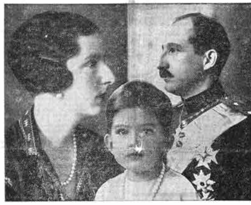
Nj. Vel. kraljica Joana, Princesa Marija Luiza, Nj. Vel. kralj Boris III.

Danes, po tolikih nesrečah, more in mora dati politično smer Bolgarije samo mirujočih in želja po dobrih odnosih a vsemi svetovi.