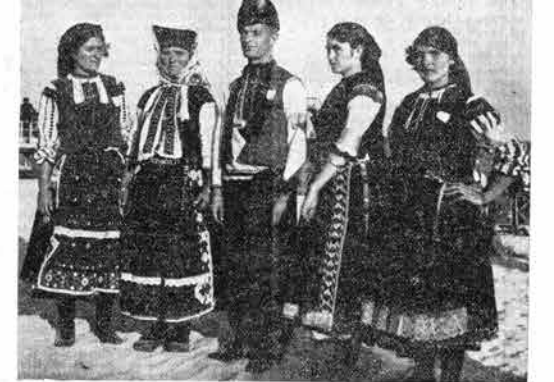
Nardna noša iz okolice Varne