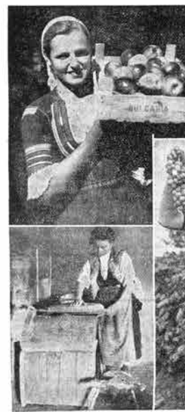
Iz okolice Kjustendila izražajo veliko izbornega sudja