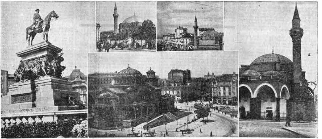
Solija: Spomenik carja Osvoboditelja, trg Sv. Nedelije in mošče, zadnje znamenje stoletne turške oblasti

V Soliji je zbrana vsa kulturna in materialna med bolgarskega naroda; ona je sin svaro stree