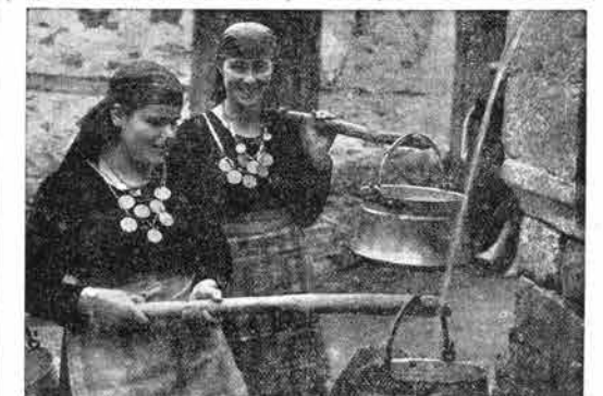
Ob vodnjaku v vasi Ustovo pod Rodopi