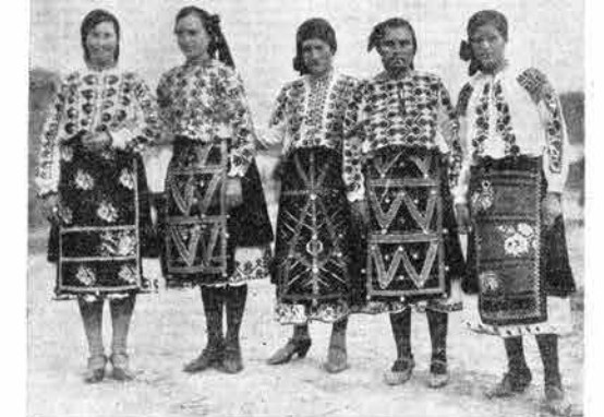
Dečliška narodna noša iz okolice Plevac

mного bolj, kot literatura. Kot umetnost ali življenje, ki so se jim vsajali mudi rodovi v prepričljivi razdobjih. Takrat, da, so se mladina navduševala za ideale liberalne Rusije in demokratske Francije. Današnja mladina ne več tako. Danes se navdušuje za rečco Meskvo, za fašistični Rim, za hitlerjevski Berlin a svojo pokovno vero, a ključkastim krilem, a uniformami, disciplino itd. Za tako imenovano nacionalistično bolgarsko mladino je bila vojna strahotna preokupacija, ki jo je povsem demoralizirala zato, ker je bila izgubljena vojna, izgubljena pa zaradi tega, ker je bila krivca zablota. Toda ta mladina je danes prepričana, da bo bodoča vojna rešiti lepšega in vselej, da bo prinesla zmagoštavo, ker jo bodo vodilo mlade generacije in jo bodo tudi dobile. — Le tako, si domišljajo sestajanja mladina, bo izbrisan trpljenjje prošila det. Da, tako mladi in tako delo nacionalistična mladina. Kajti mladine vedno manjka roži sad i klučnik, ki so zaklani starostni. Tudi tega mladini ne smejo zameriti. Kaj pa so stariji rodovi in vselej storili, da bi mladim olajšali vstop v življenje in dosegli upravičenih šelja po življenju in veselju!