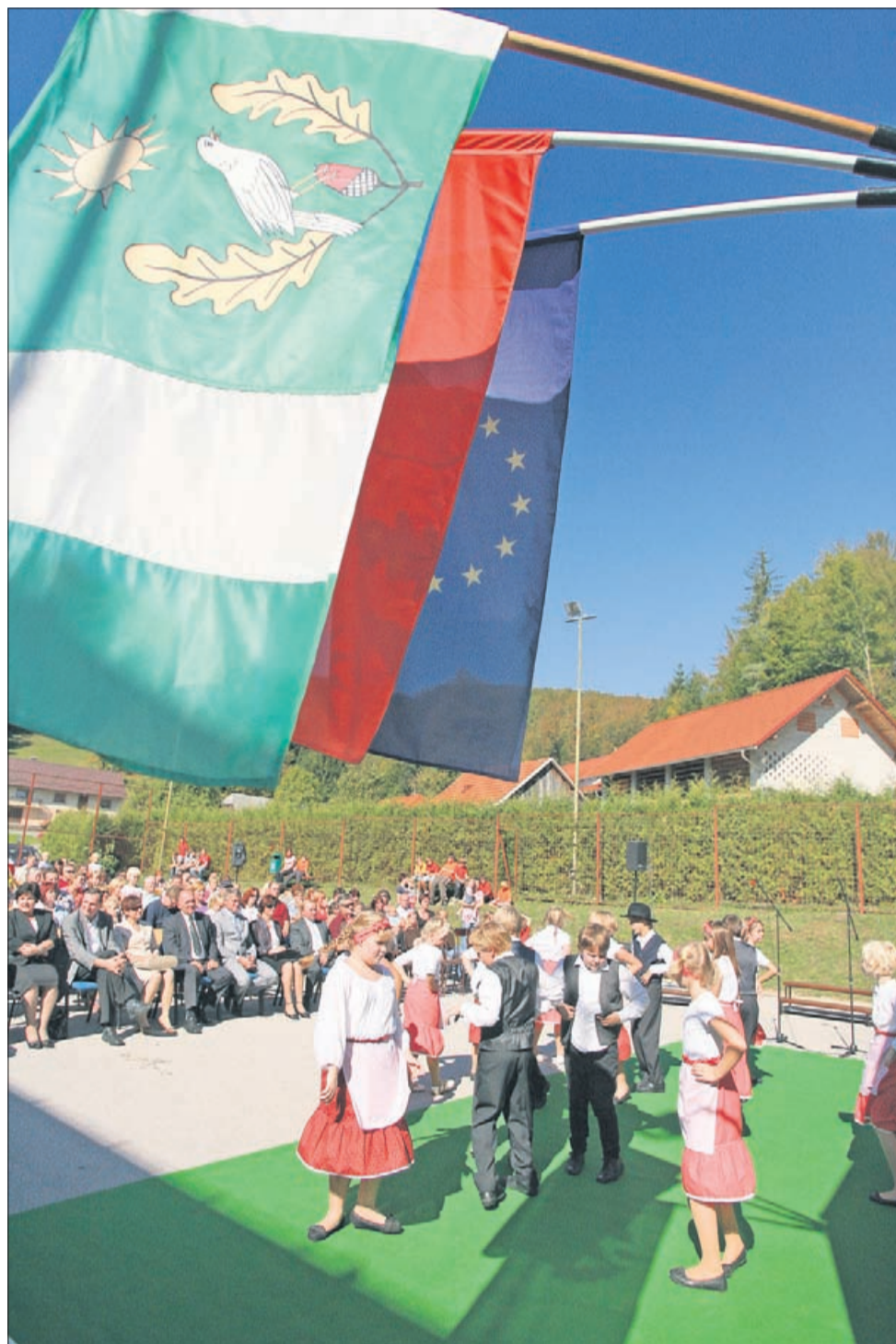
Ob spremljavi Big benda Šentjur so peli in plesali domači šolarji. Z ubranimi petjem v vokalni skupini so se izkazale še učiteljice in priložnostni zbor nekdanjih pevcev v šolskem zboru.

V prazničnem koncu tedna obeležili 20 let nove šole in 150 let šolstva v kraju