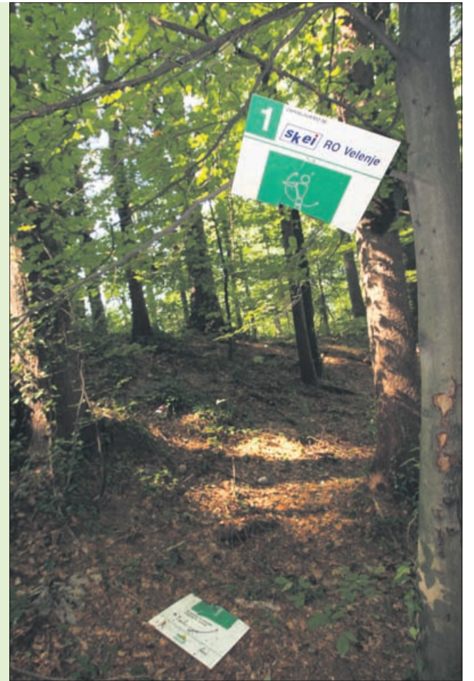
Včasih je bila trim steza za Vilo Herberstein edina in zelo obiskana trim steza. Leta 2004 so jo obnovili, zdaj pa so, kot kaže, na delu spet nepridipravi.

zanimivo ne le za domačine, ampak tudi za ostale obiskovalce Velenja. Večja obiskanost teh poti je se-