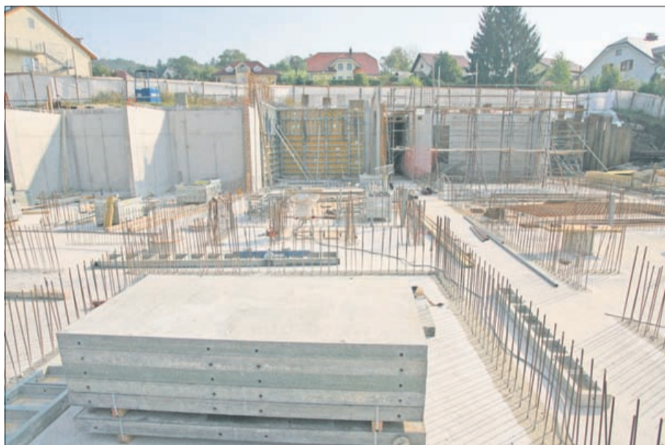
Močna železobetonska stena v ozadju je hkrati tudi škarpa za brežino v ozadju nastajajočega vrtca.