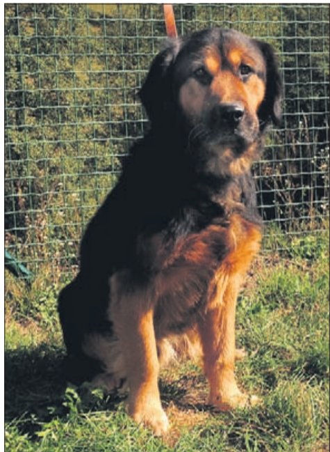
Lex je star 5 let, večje rasti in so ga našli v Laškem.