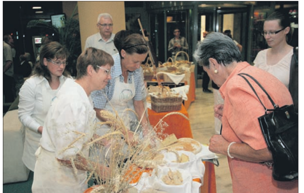
Mize so se šibile pod težo kruha in različnih pekovskih izdelkov. Izkazale so se tudi članice Društva kmečkih žena Rosa.