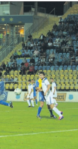
jo je pripravil Ivan Firer.