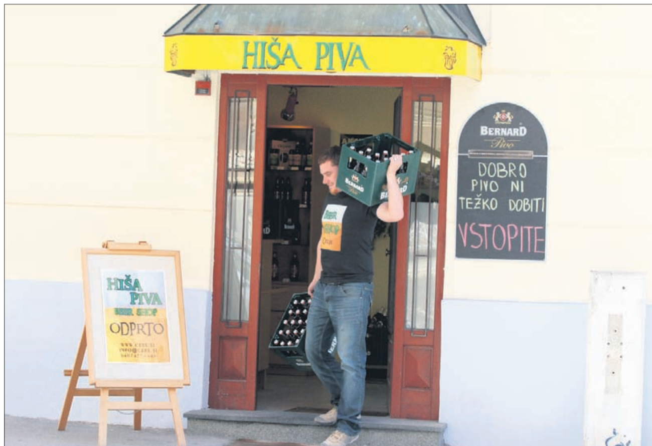
Le od kje jemlje svojo moč?