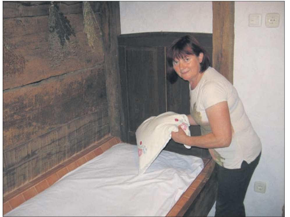
V »podeželskem wellnessu« imajo poleg savn celo seneno kopel.