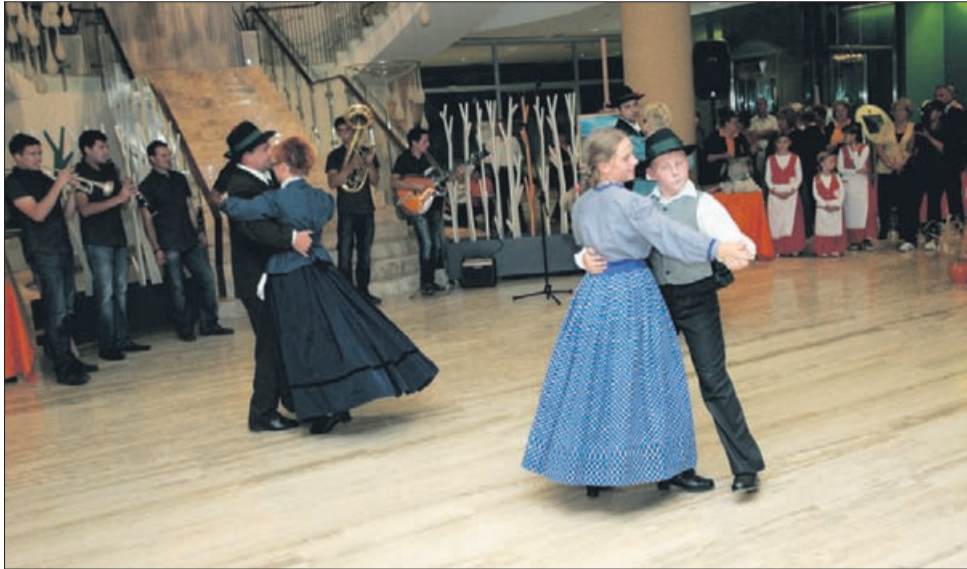
Kulturni program so popestrili člani Folklorne skupine Lipa Rečica, temperaturo pa so ves čas dvigovali člani zasedbe Razigrani muzikanti.

Nanjo so se v Likovnem društvu Laško pripravljali celo leto. Šlo je za projekt, s katerim so želeli prikazati spoštljiv odnos do blaginje, rodovitnosti, opozoriti na pomen lakote ter preživetja.