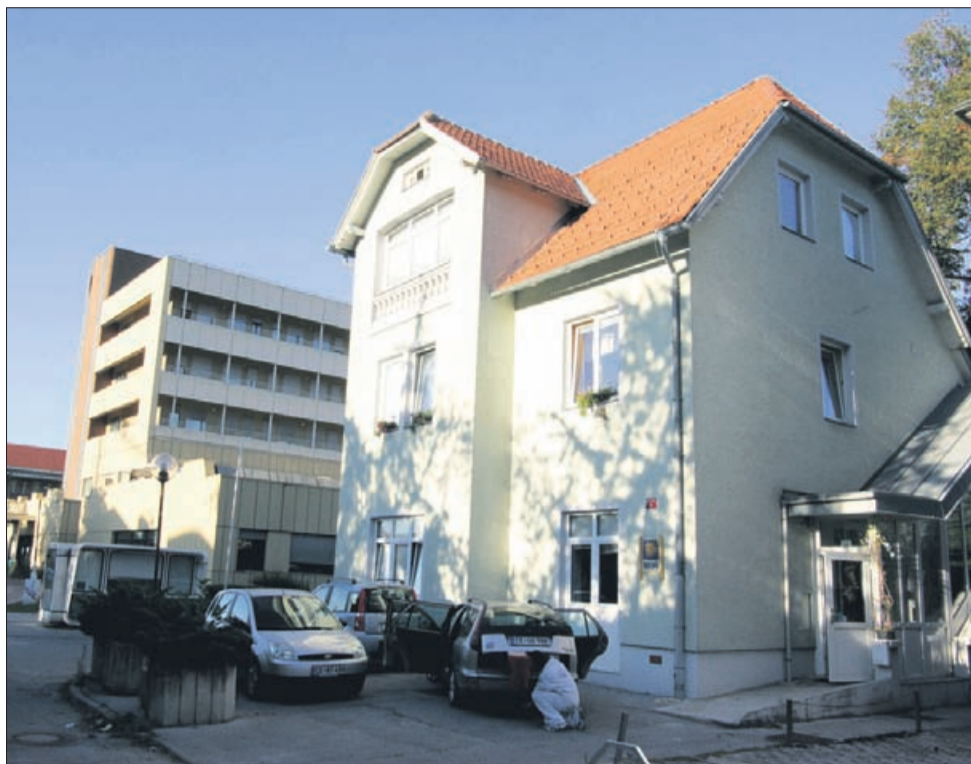
Krizni center za mlade je v neposredni bližini celjske bolnišnice. Je regijsko organiziran center, ki pokriva osem upravnih enot: Celje, Zalec, Velenje, Mozirje, Laško, Slovenske Konjice, Smarje pri Jelšah in Sentjur.