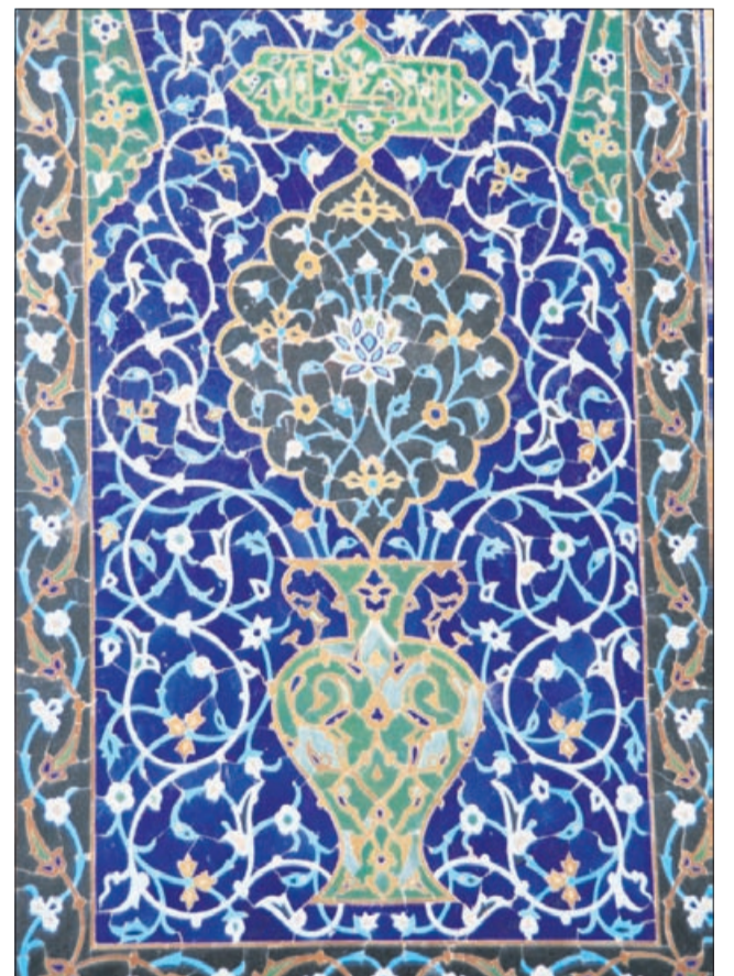
Podrobnosti, ki jih skriva perzijska umetnost.

Z zadnjim delom feljtona o Iranu smo zaokrožili polletna popotovanja po svetu. Zabeležili so jih različni popotniki s Celjskega. V torkovih številkah Novega tednika bomo s feljtoni oziroma podlistki nadaljevali tudi z drugimi, za širšo javnost zanimivimi temami. Vabljeni, da se nam oglasite s predlogi za sodelovanje.