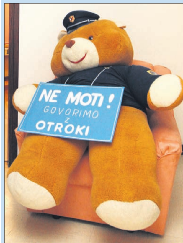
Takšen medvedek pričaka otroke, ki so žrtve nasilja, pred sobo, v kateri preiskovalci opravijo enega najtežjih pogovorov v otrokovem življenju ...

080 28 80 - Združenje proti spolnemu zlorabljanju