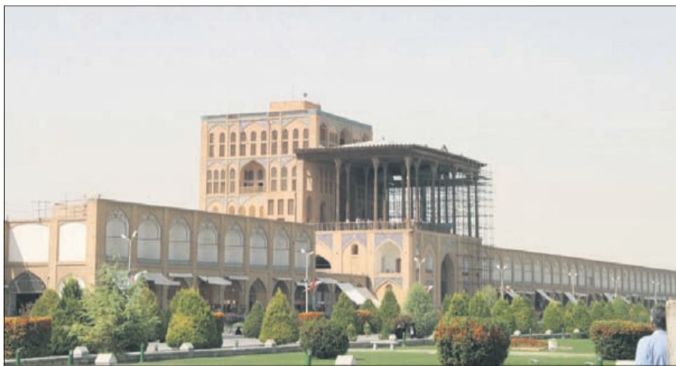
Palača, ki si jo je dal zgraditi šah Abbas.

Šah si je resnično zadal ogromen gradbeni projekt, saj je njegov trg še dandanes drugi največji trg na svetu in meri v dolžino 512 metrov, v širino pa 163 metrov. Presegel ga je le kitajski trg Tiananmen, ki ga je dal zgraditi Mao Zedong. Trg danes krasijo cvetlične gredice in ogromni vodometi, v preteklosti pa je bila to ogromna travnata površina, na kateri so igrali polo. Šah