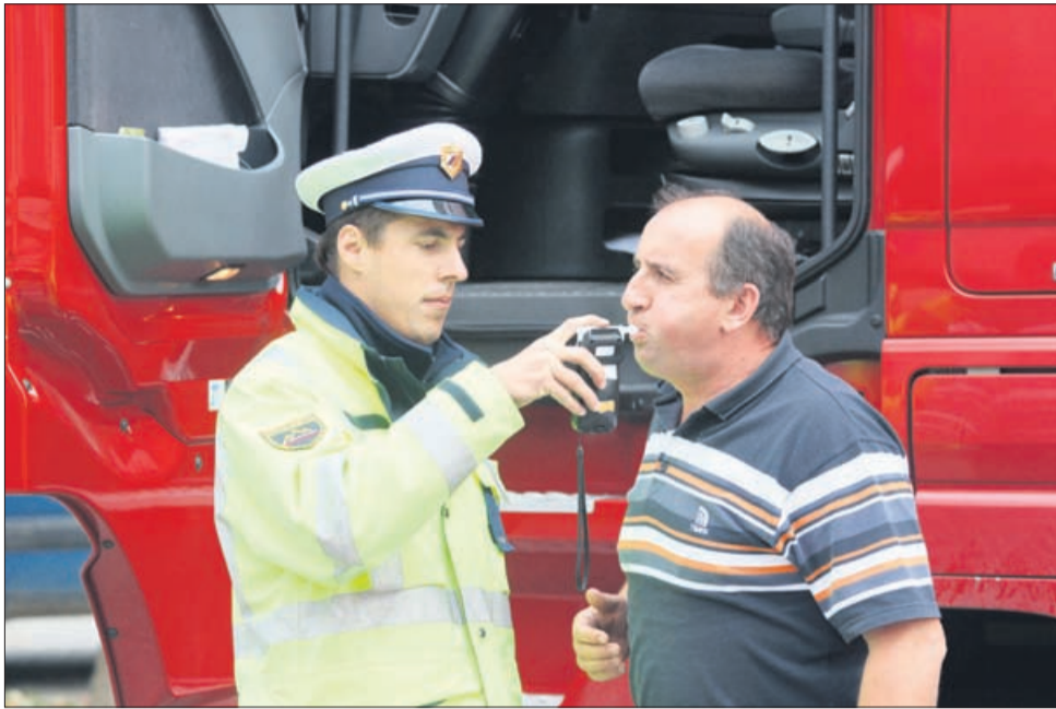
Marsikdo bo po »pihanju« ostal takoj in za dlje časa brez vozniškega dovoljenja. Fotografija je nastala pri opravljanju nadzora voznikov tovornih vozil. Vozniku alkokotest ni pokazal alkoholiziranosti.