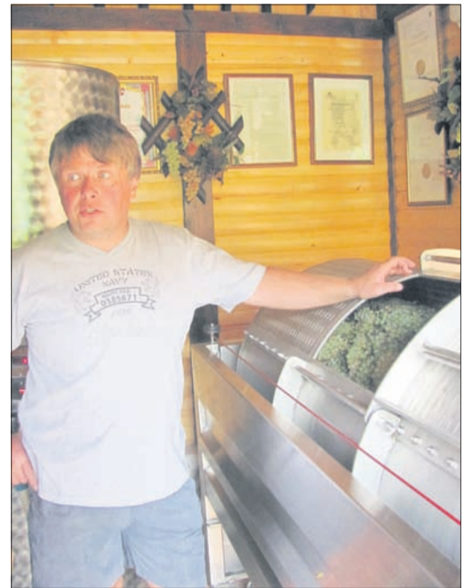
Grozdje gre v pnevmatsko stiskalnico brez predhodnega mletja, iz nje pa po cevi neposredno v cisterno.