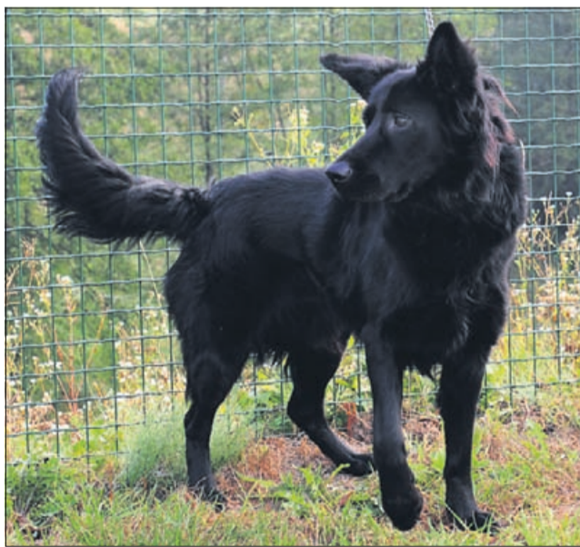
Zax je srednje rasti, star 10 mesecev.

Uradne ure zavetišča Zonzani: od ponedeljka do petka od 8. do 16. ure; ogledi psov: od ponedeljka do petka od 12. do 16. ure. Telefon: 03/749-06-00; internetni naslov www.zonzani.si