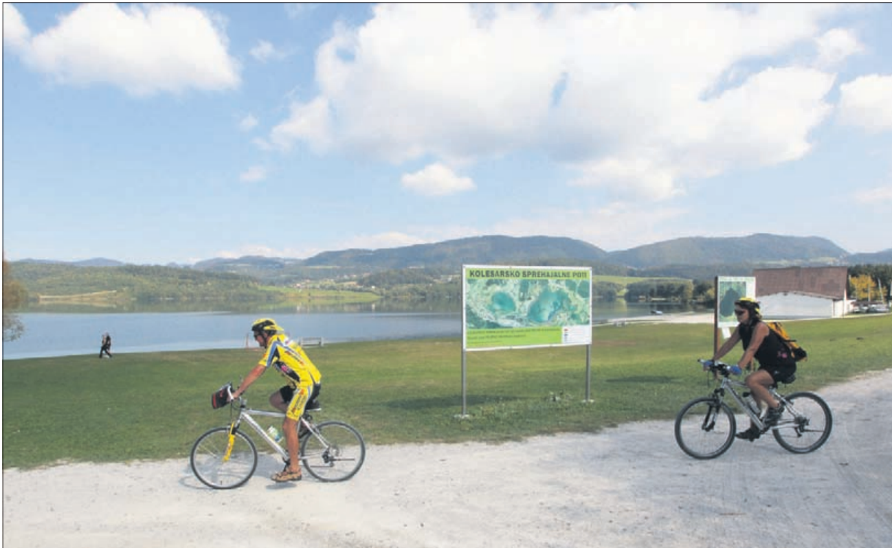
V okolici Velenjskega jezera je premogovnik uredil skoraj 20 kilometrov sprehajalnih in kolesarskih poti.