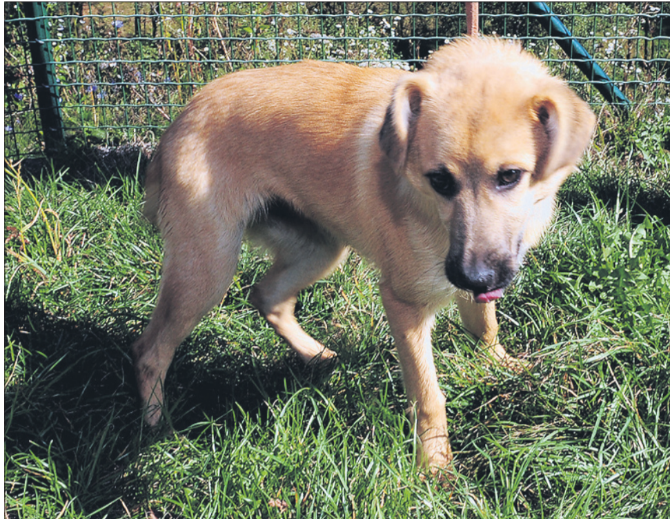
Kora je mešanka, stara 4,5 meseca. Je srednje rasti in prijazna.

Kosmatinci na fotografijah čakajo na skrbne gospodarje v zavetišču Zonzani.