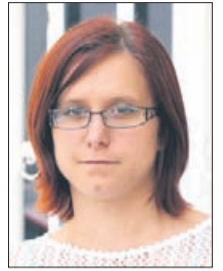
Piše: ALENKA GABROVEC, zakonska in družinska terapevtka

Dostikrat naletim na besede, da je otrokom treba dati samo ljubezen. In ponavadi sledi razprava o tem, da če otroka obdajaš samo z ljubeznijo, to ni dovolj, ker je treba biti z njimi strog in neizpros. Seveda je kriv ne vem kdo, da so zdajšnji otroci popolnoma nevezgajeni in nimajo spoštovanja in smo mi bili pod taktirko strogosti lepo vezgajeni. Torej kaj je prav?