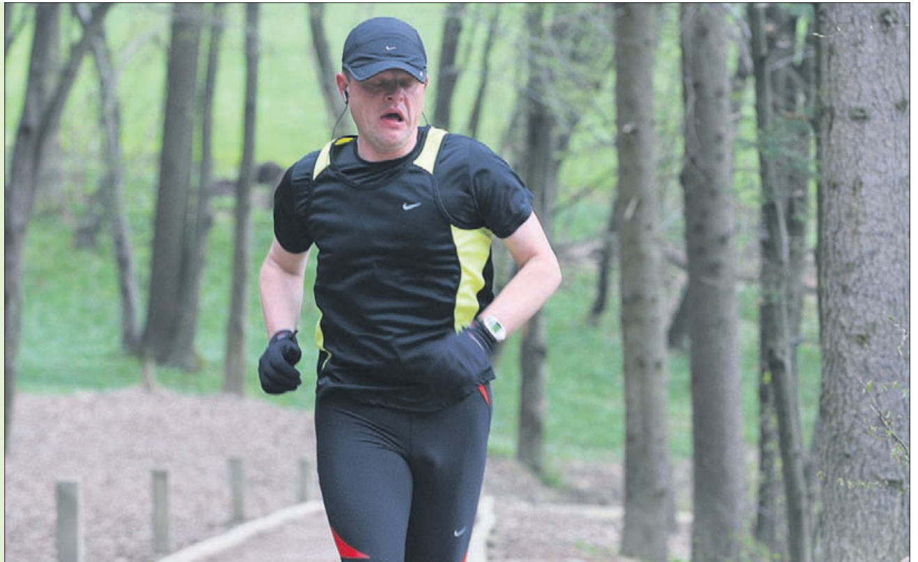
Sprehajalna pot do in ob Šmartinskem jezeru je že zdaj dobro obiskana. Zlasti množično v času rekreativnih prireditev.

Osrednje rekreacijsko območje mesta je sčasoma postal mestni gozd, z mrežo urejenih gozdnih poti. »Je najbolj dostopen, blizu je parkirišče za Spodnjim gradom,« pravi Gobec in dodaja, da bi bila ena od možnosti za ureditev trim steze – če bi se seveda v mestu odločili zanjo – prav tu ali pa ob sprehajalni stezi pri visečem mostu čez Savinjo. »Lahko bi se nave-