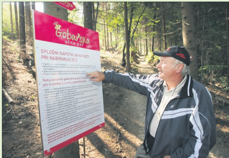
Zakaj ne bi združili prijetnega s koristnim? Med sprehodom po Gobarski učni poti na Celjski koči se razmigamo in hkrati spoznamo še kakšno gobo ...

Kostanjev piknik na Okrešlju, info: pdcelje@siol.net