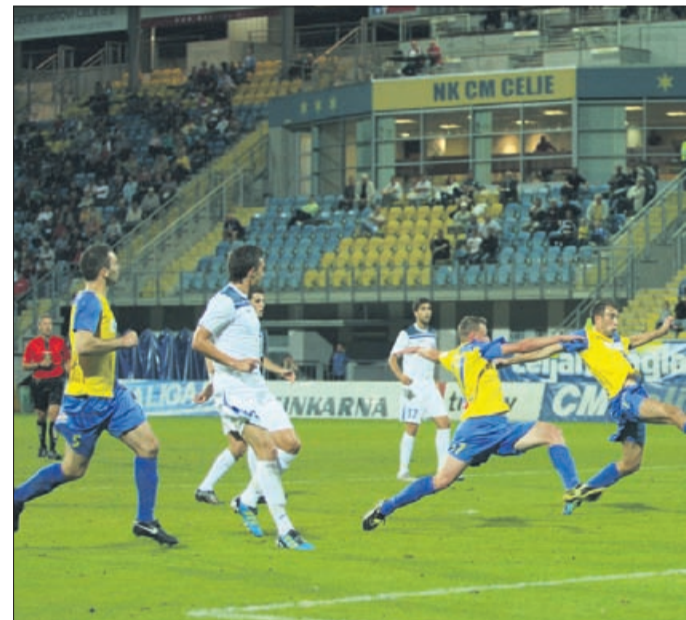
Priložnost za 2:0 je splavala po vodi, po neuspeli obrambni zanki gostov.

Velenjski Rudar ostaja neporažen od 14. avgusta. Takrat je v 5. krogu izgubil na gostovanju