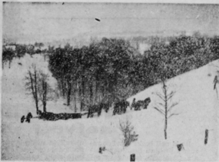
Snežni plug na cesti pod Ptujsko goro

»Splošni pogoji gospodarjenja,« poudarja Brkić, »zlasti pa plačni sistem in delovna storilnost, so postali gospodarski problem, kajti od načina njihovega obravnavanja je odvisen tempo zboljševanja življenjskega standarda in naraščanja re-