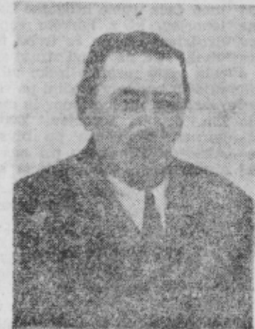
... in njegov najstarejši dopisnik

Janezek čita vse knjige in časnike kakor vsak odrasel, ki je že končal osnovno šolo. Tudi piše že in pozna decimalni sistem.