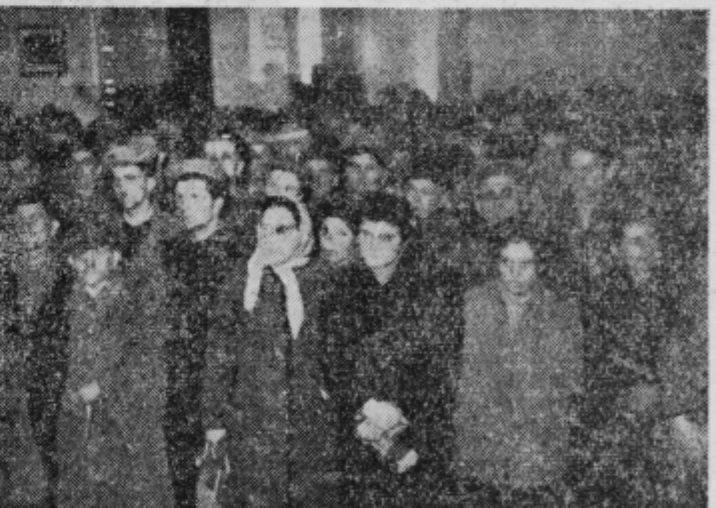
Udeleženci zborovanja so napojili dvorano

Rogatec in Majsperk imata tudi svojo zgodovino. Prvič se omenja v zgodovini Rogatec kot trg 1283. leta. Kakih 154 let poprej je bil zgrajen grad, na katerem so gospodovali kot fevdniki krške škofije Rogoški go-