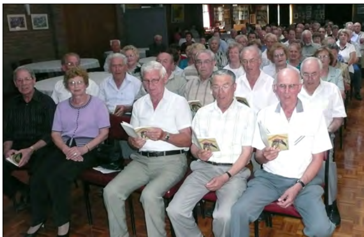
Lepo sodelovanje pri sveti maši na Jadranu, 22.marca 2009.