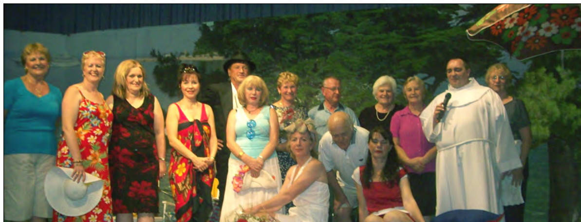
Igralci dramske skupine iz Kew s sydneyjskimi kolegi po končani predstavi, 15.03.2009..

Hvala lepa za obisk in upamo, da bo naslednjič obisk gledalcev še boljši!