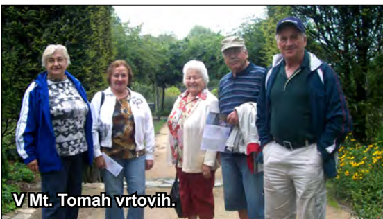
V Mt. Tomah vrtovih.