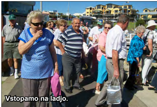
Vstopamo na ladjo.