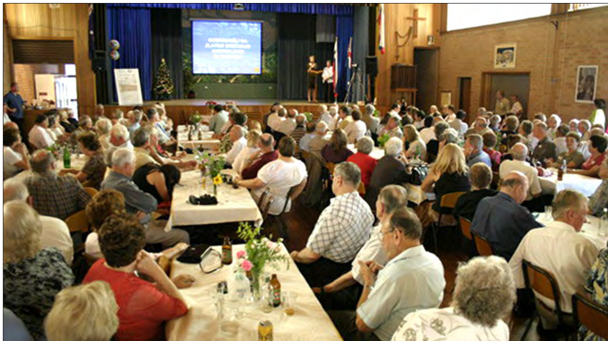
Praznovanje leta 2007 v Merrylandsu: 50 let v Avstraliji.

Vabimo na srečanje vse, ki so sodelovali v igralskih družinah od prvega trenutka, ko je prva skupina navdušenih Slovencev stopila na odrske deske z dramskim delom, sebi v navdušenje