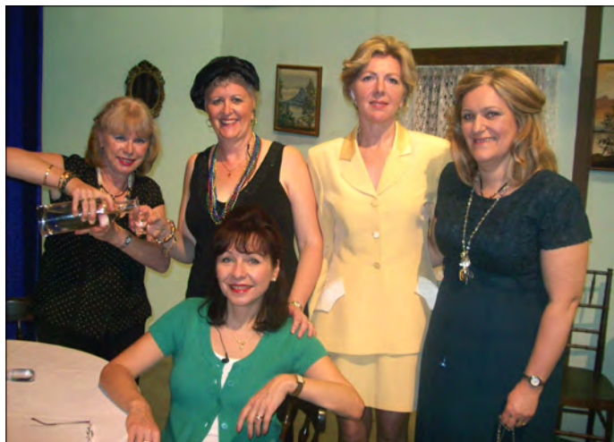
Igralska družina Kew iz Melbournu je v Sydneyu uprizorila igro KONČNO NA DOPUST .

SLOVENSKI KULTURNI PRAZNIK smo praznovali na Slovenskem društvu Sydney v Wetherill Parku v nedeljo, 8.2. V Merrylandsu pa smo ga obeležili v soboto, 14.3., in v nedeljo, 15.3., ko nas je obiskala Igralska družina Kew. Slovenski rojaki iz Melbournu so uprizorili igro KONČNO NA DOPUST , ob kateri smo se nasmejali kot že dolgo ne. Veseli smo nove mladike, ki je že dobro vzcvetela, obenem pa ne pozabimo na našo Igralsko družino Merrylands, ki bo tudi kmalu začela študirati novo igro. Vendar potrebujemo nekaj več igralcev, zlasti moških. Tudi mladi fantje in dekleta, ki ste prerasli klopi naše Slomškove šole, se lahko pridružite, saj je lepa priložnost za vas, da se utrdite v slovenščini. Potem so seveda dobrodošle pridne roke za postavitve scen na odru, opreme, oblikovanje, za postrežbo in še kaj bomo našli. – Mali – veliki oglas torej velja!