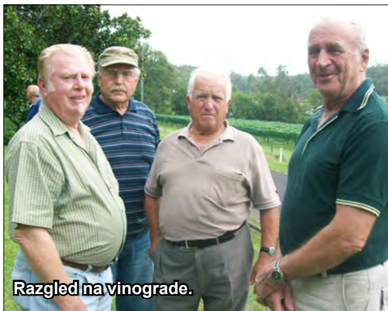
Razgled na vinograde.