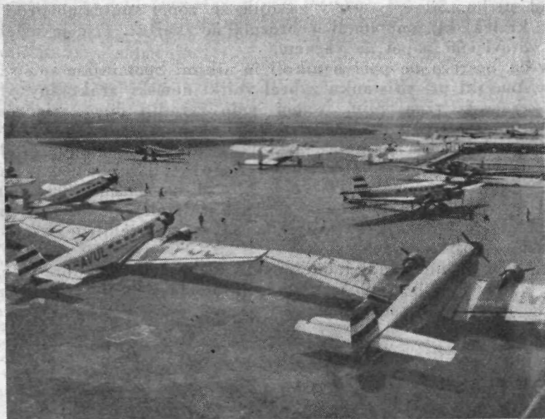
Živahen promet na modernem letališču.