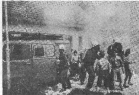
Ob 80-letnici prostovoljnega gasilskega društva Dravlje so člani pripravili vajo in mimohod.

V počastitev spomina na množične aretacije aktivistov OF slovenskega naroda 28. maja leta 1942, obletnico vstaje jugoslovanskih narodov in narodnosti ter 40-letnico svobode so krajanje krajevnih skupnosti Bratov Babnik, Dravlje in Dolomitski odred obudili spomin na