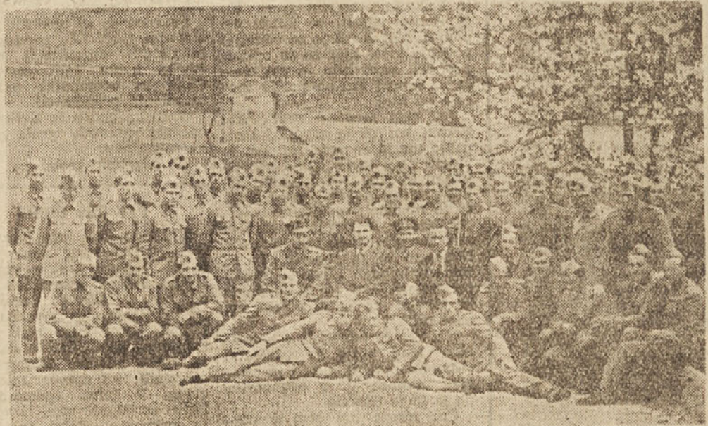
Komandirji centrov predvojaške vzgoje v krškem okraju so dobro opravili svoje delo

Bežen pregled gospodarskega plana zadruge, ki je v tem članku zaradi pomanjkanja prostora nepopolno prikazan, nam pove, da Kmetijska zadruga na Vidmu skuša odigrati tisto vlogo, ki ji je namenjena. -nc