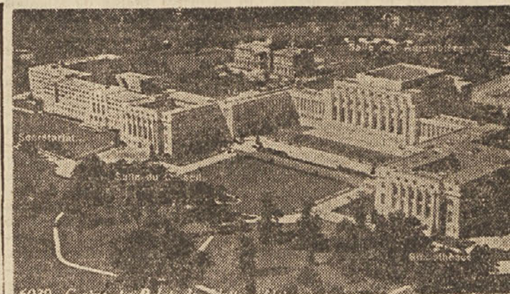
Palaca OZN v Zenevi, v kateri zaseda Azijska konferenca

Na dan so prišle skoraj vse večje potrebe in želje, ni bilo pa predlogov, od kod vzeti in kje dobiti kritje za te izdatke in podobno. Vse pa kaže, da se bo v prihodnosti tudi v tem oziru pokazal napredek, da bodo člani obeh zborov OLO začeli razmišljati tudi o tem, kako ustvariti čimveč sredstev, povečati in pocieniti proizvodnjo, ker bo od tega odvisen tudi ves naš napredek.