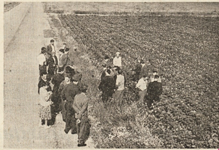
Člani dosedanjšega DS ogledujejo krompirišča na obratu Kidričevo.

Vinograde na terasah v Vareji na Dravinjskem vrhu so videli po ogledu farme. Posebej jih je zanimal način obnove na terasah in rentabilnost takih nasadov. Ugotovili so, da se menja s terasami oblika Haloz. Navdušile so jih velike obnov-