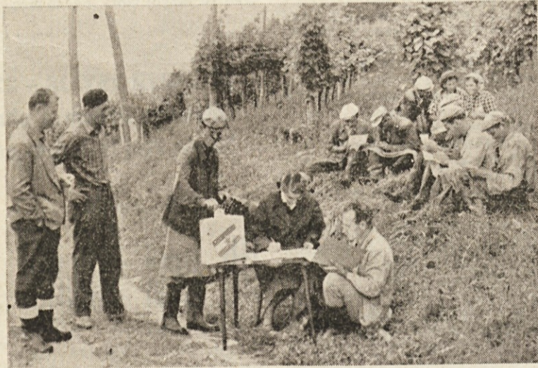
Na oddaljenih deloviščih so delavci volili na delovnih mestih. Volitve na delovišču Vurberg, obrat Osojnik