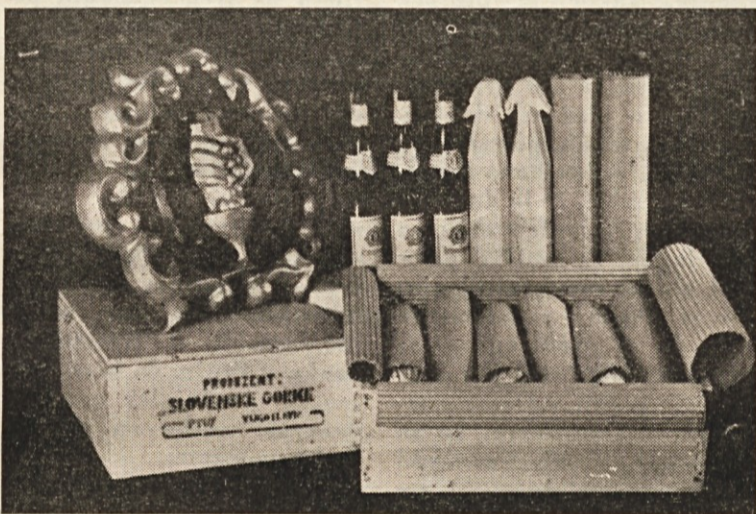
Izvozna embalaža za vino obrata »Slovenske gorice«

le ožji krog trgovskih in izvoznih podjetij, ki niso hotela priznati, da je Ptuj osrčje Haloz, ki bi bil upravičen širiti sloves teh vin.