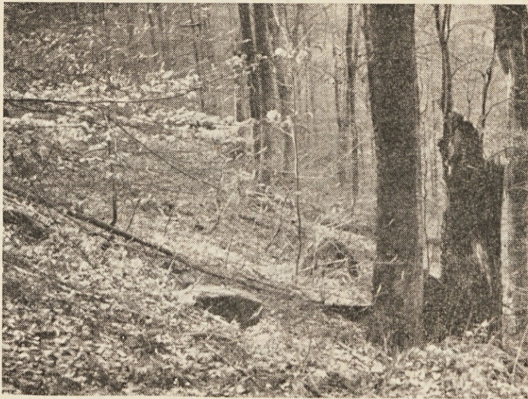
Zaščiteno pragozdno območje na Donaci gori

V letu 1963 smo organizirali v podjetju 28 raznih tečajev, seminarjev ter prak-