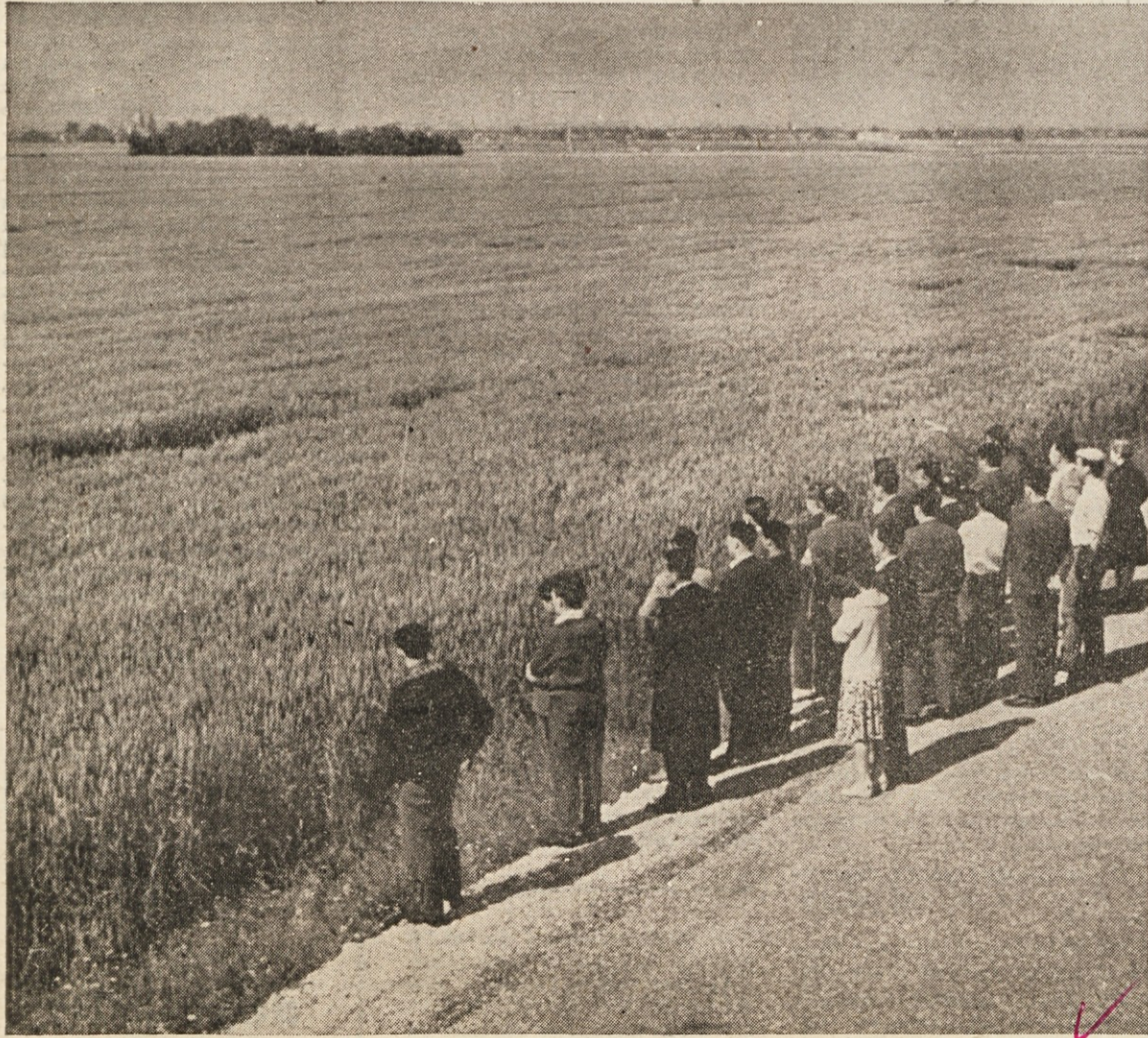
Dosedanji DS ogleduje kompleks pšenice sorte »étoile de chosy« na Dravskem polju

Zavedamo se, da je naša naloga zelo odgovorna, saj vas bomo morali seznanjati s vsemi važnejšimi dogajanja v kombinatu. Posebno vas želimo seznanjati z gradivom, ki mora biti predmet razprave po delovnih enotah in ki bodo napotilo članom samoupravnih organov za mnogo lažje in zavestno sprejemanje odločujočih sklepov. V veliko pomoč nam bodo vsi prispevki iz dela in problemov vašega delovnega mesta in delovne enote. Zato vas vabimo, aktivno sodelujte v dopisovanju za naš časopis. Tako bomo s skupnimi močmi uspeli uresničiti načelo statuta Kmetijskega kombinata Ptuj, ki pravi: »... članom kolektiva kombinata je zajamčena pravica, da se seznanijo z materialnim in finančnim stanjem, z izvrševanjem planov ter poslovanjem kombinata kot celote in njegovih organizacijskih enot.« (15. člen statuta)