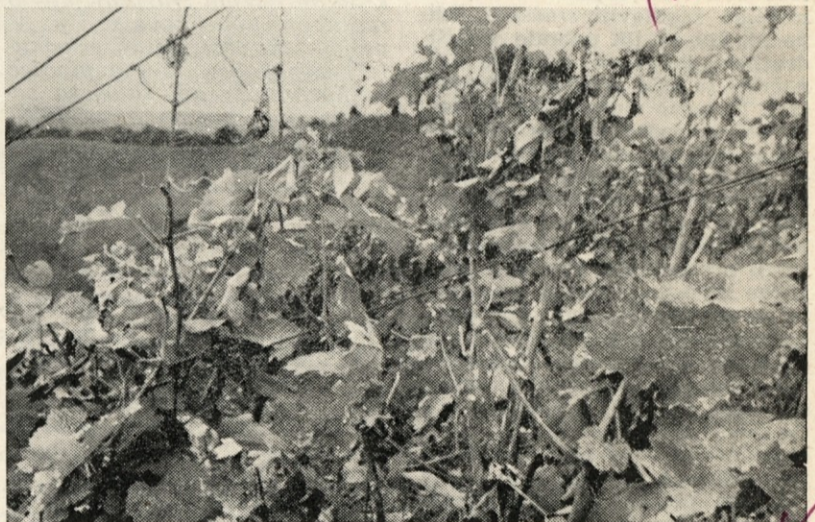
Po toči dne 27. 6. 1964 poškodovani vinograd na Turškem vrhu — Zavrč

pregledati in usposobiti hmeljsko sušilnico (kurišče, ogrevalac, mreže, termometre, dvigalo, predale).