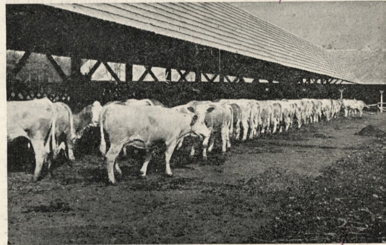
Na krmišču odprtega hleva v Kidričevem