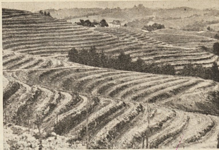
Na terasah je ob uporabi sodobne mehanizacije omogočena pocenitev pridelovanja. Na sliki terase na Turškem vrhu

DE klavnica z mesnicami: Sagadin Branko (13) in Babusek Srečko (12).