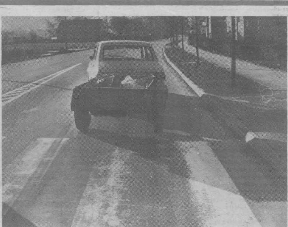
Fotoarhiv postaje milice v Mostah