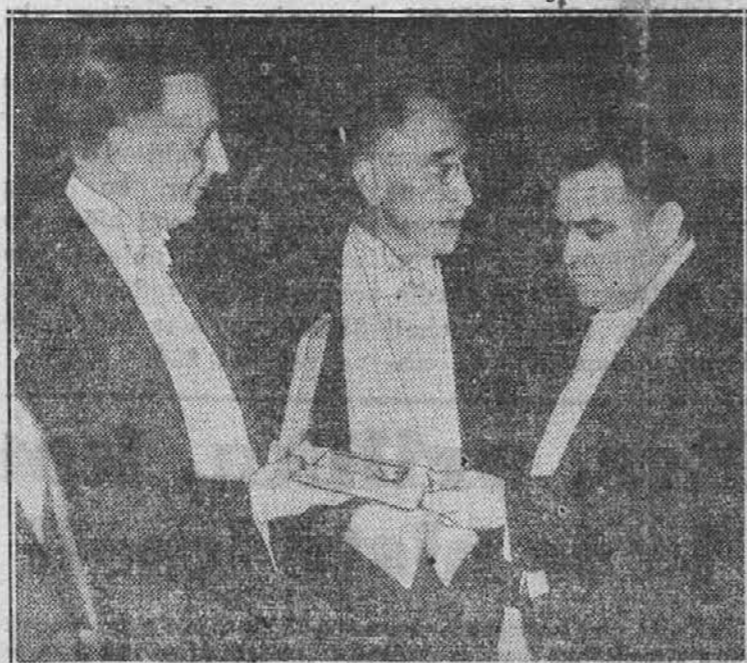
Slika kaže prizor, ko je bil newyorški župan La Guardia (na desni) od predstavnikov ameriških Judov odlikovan z medaljo. Judje poveljujejo župana, da ima zasluge za zbliznanje med Judi in kristjani.