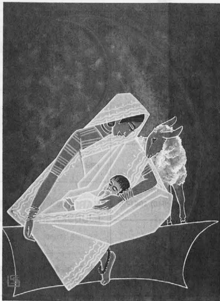
Indijski božični motiv