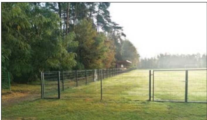
V Športnem parku Gerečja vas je postavljena panelna ograja.