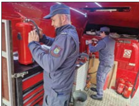
Letos je hajdoškimi gasilcem uspelo izpeljati le nekaj načrtovanih aktivnosti na dan odprtih vrat.