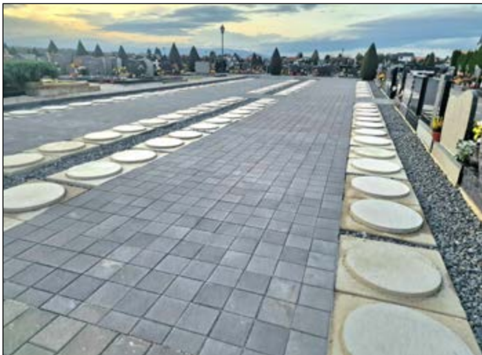
Na hajdinskem pokopališču je urejeno že četrto polje.

Na območju žarnega polja IV so tlakovane tudi potke. Vrednost opravljenih del znaša 55.167,40 EUR.