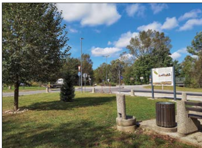
Vaška skupnost Hajdoše prejme priznanje za najbolj urejeno vaško skupnost v občini.