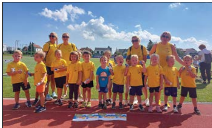
Mini olimpijci na Mini olimpijadi

Mini olimpijade se udeležijo okoliški vrtci in med njimi je vsako leto tudi naš vrtec. Različna društva in klubi so otrokom pripravili veliko aktivnosti in nalog po postajah. Telovaditi, plesati, se preizkusiti v gimnastiki, nogometu, košarki, badmintonu, atletiki in tenisu, je bilo prav zabavno. Vsak otrok se je našel v omenjenih nalogah ter aktivno in uspešno sodeloval. Otroci so se ob vsem tem zelo zabavali in na koncu so si za svoje opravljene aktivnosti prislužili mini darilca in diplome. Deležni pa so bili velikih aplavzov, pozitiv-