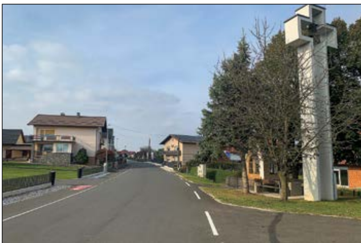
V Gerečji vasi je moderniziran še en odsek ceste, v sklopu tega pa je dograjen kolesarski pas, urejena je tudi cestna infrastruktura.

V Gerečji vasi je bila izvedena ureditev lokalne ceste LC 165 162 – 1. faza. V sklopu projekta se je izvedla sanacija 300-metrskega odseka lokalne ceste z dograditvijo kolesarskega pasu, urejeno je meteorno odvodnjavanje, izgrajena je nova cestna razsvetljava in postavljeno novo avtobusno postajališče. Dela je izvajalo Cestno podjetje Ptuj na podlagi sklenjene gradbene pogodbe v vrednosti 242.334,22 EUR.