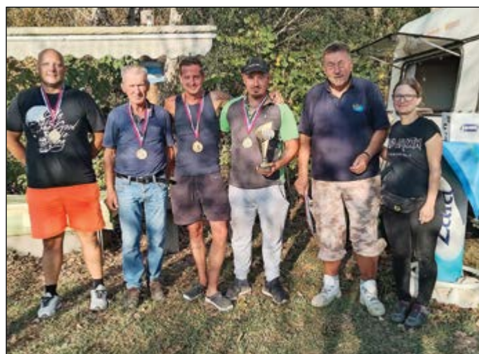
Ribolov četvorke – zmagovalna ekipa Krivolovci II