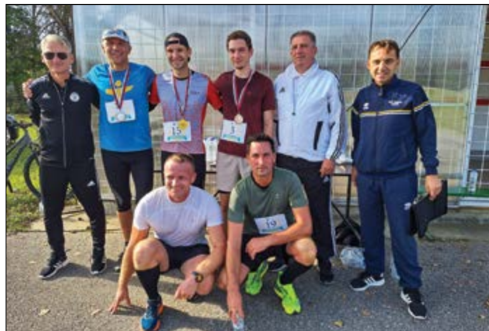
Tekači na letošnjem hajdinskem teku