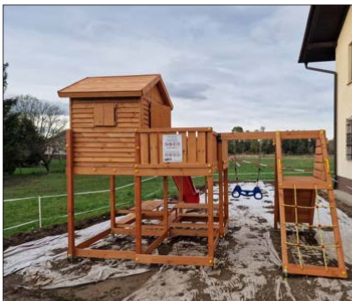
Pri Domu krajanov Skorba nastaja nov park za otroke.

Občina Hajdina je letos prvič pristopila k izvedbi participativnega proračuna, za katerega smo v proračunu Občine Hajdina za leto 2023 namenili 30.000,00 EUR. Na razpis je v roku prispelo devet predlogov, Komisija za participativni proračun pa je izbrala šest predlogov, ki so izpolnjevali merila. Glede na rezultate glasovanja so bili v občinski proračun uvrščeni prvi trije projekti, ki so prejeli največ glasov: Park za otroke v Skorbi, Postavitev zunanjih motoričnih igral pri OŠ Hajdina in Postavitev košarkarskega igrišča pri Domu vaščanov Draženci.