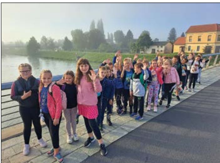
Prebudili smo Ptuj in se odpravili v kino.