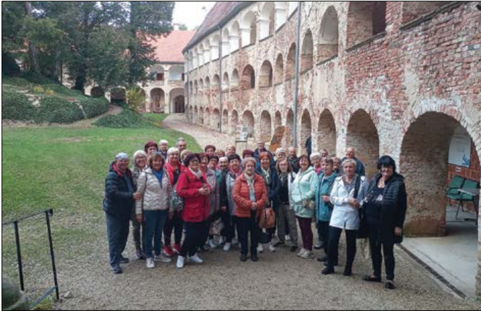
Na ekskurziji v Občini Grad na Goričkem