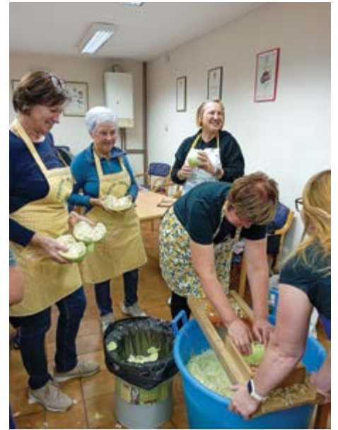
V Dražerčah letos kisajo zelje, ki ga bodo gospodinje ponudile na tradicionalnem Gospodinjskem večeru.