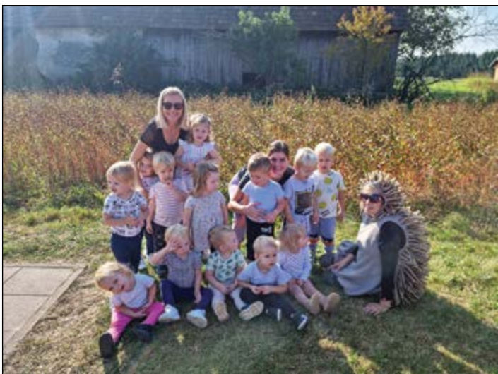
V Tednu otroka smo z našim ježkom tekli kros, na katerem smo bili zmagovalci vsi iz vijolične igralnice.