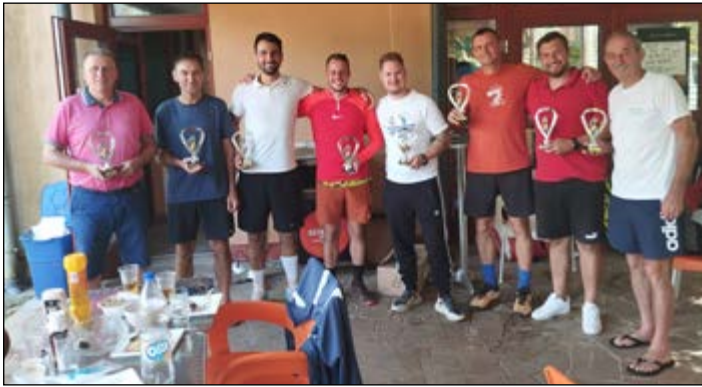
Zmagovalci na turnirju v namiznem tenisu