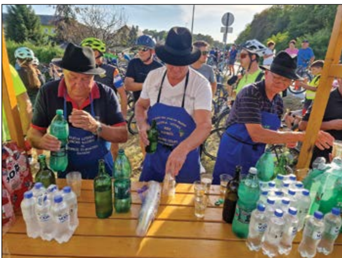
Hajdinski kletarji so poskrbeli, da kolesarji niso bili žejni.