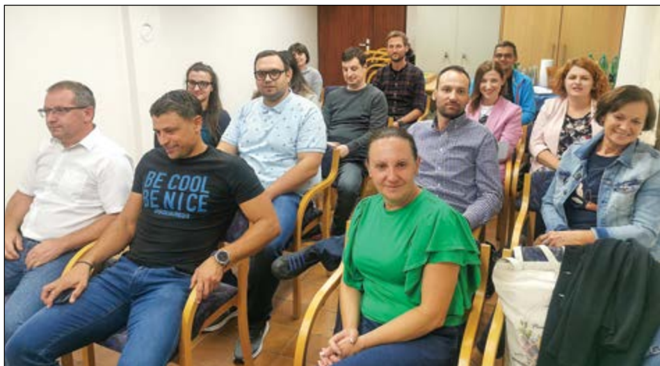
Izredni občni zbor članov KD Draženci je bil v oktobru.