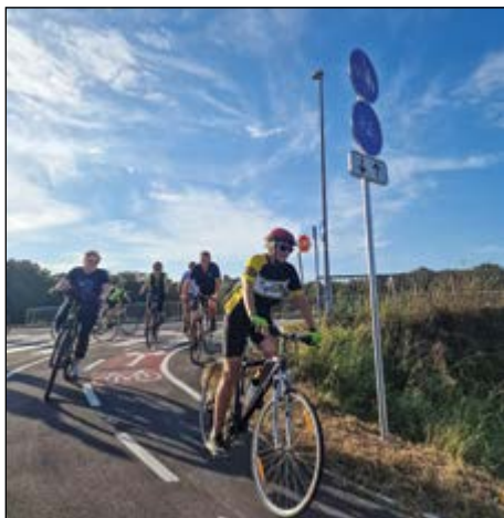
Po novi regionalni kolesarski povezavi skozi Zg. Hajdino