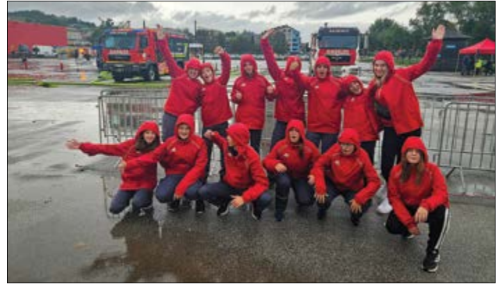
Tekmovalna enota hajdoških mladincev z mentoricami po tekmovanju v Gornji Radgoni

Starejši gasilci PGD Gerečja vas so na državnem tekmovanju stali na tretji stopnički. Čestitamo!