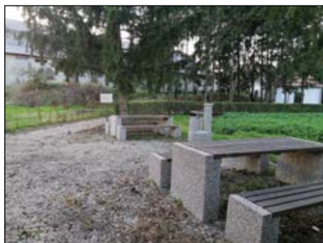
Urejanje I. Mitreja