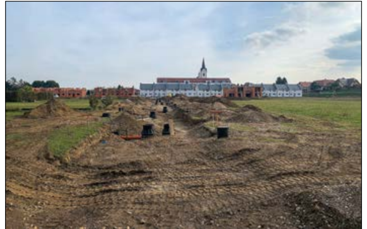
Občina Hajdina gradi v novem stanovanjskem naselju v centru občine novo komunalno opremo.

Občina Hajdina v skladu z odlokom o občinskem lokacijskem načrtu in odlokom o programu opremljanja stavbnih zemljišč gradi novo komunalno opremo za območje urejanja P10-S8/2 Hajdina, območje ob PSC Hajdina. V letu 2023 je bila končana gradnja ceste B s pripadajočo komunalno opremo, nadaljuje pa se gradnja komunalne opreme ceste C. Sočasno z gradnjo komunalne opremljenosti pa investitorji že nadaljujejo izgradnjo novih stanovanjskih enot na tem območju.