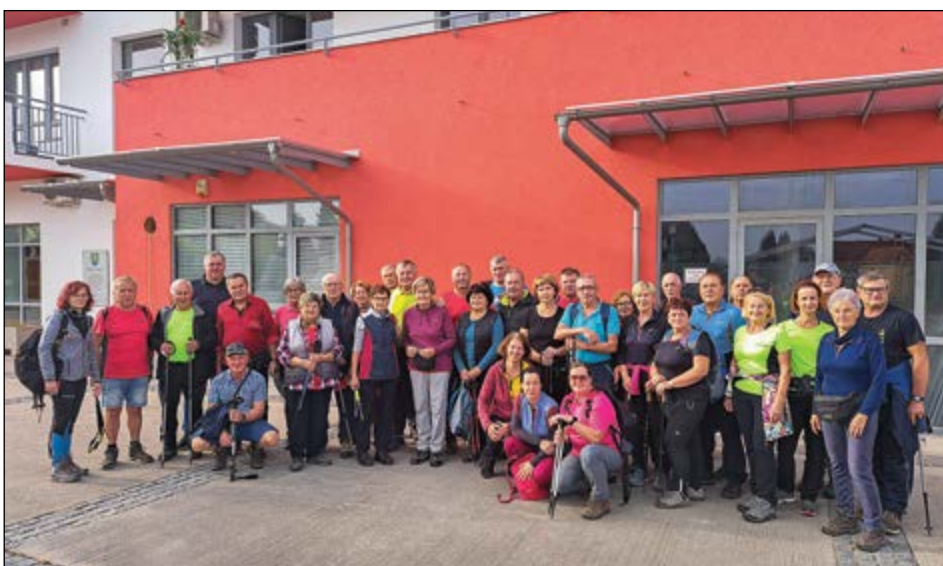
Utrinek z letošnjega pohoda na Donačko goro.