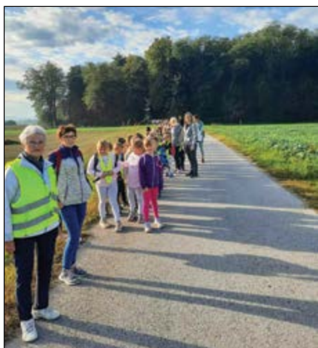
Planinci dobro sodelujemo tudi z OŠ Hajdina.