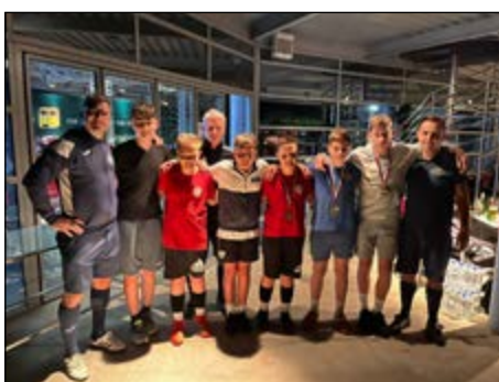
Footgolf – mladinci do 18 let