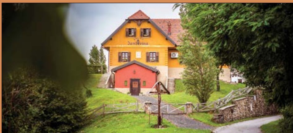
Krčma Janževina je tematska restavracija v srcu Haloz.

Zgodbo Jesen v Halozah soustvarja sedemnajst haloških ponudnikov, ki vabijo ob sobotah (do 11. novembra) med 13. in 20. uro. Ob čudovitih razgledih vas bodo razvajali ob moštu, mlademu vinu, pečenih kostanjih, ocvirkovki, haloški gibanici, kisli juhi, gobovi juhi, haloškem sendviču s tunko in drugimi kulinaricnimi dobrotami. V zahodnih Halozah pa bodo izjemno