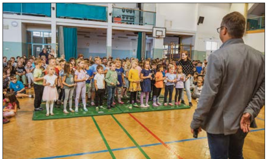
V šolsko skupnost učencev smo slovesno sprejeli prvošolce.