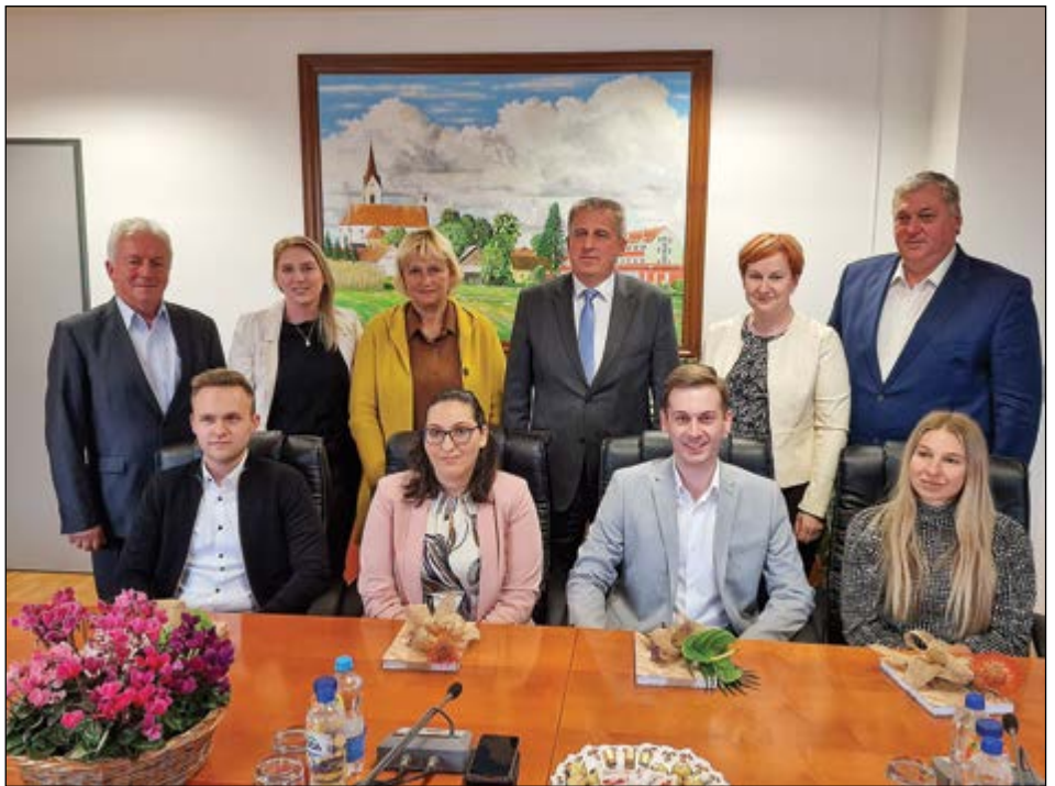
Čestitka novim magistrinam in doktorici znanosti v Občini Hajdina