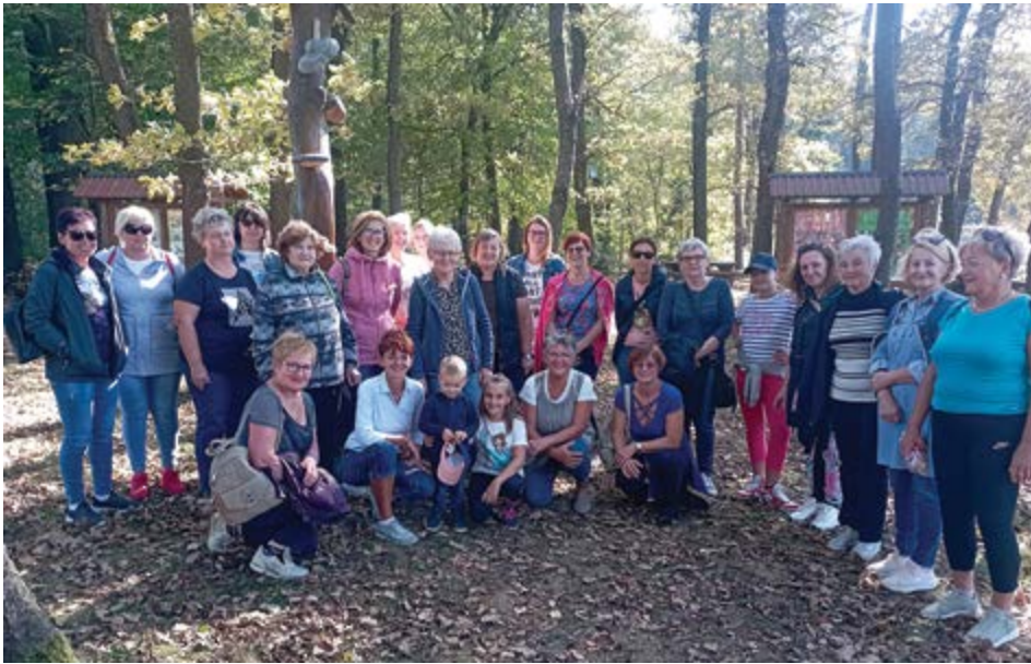
Dražerčanke na ogledu učnega gobarskega parka v Dobrovcah