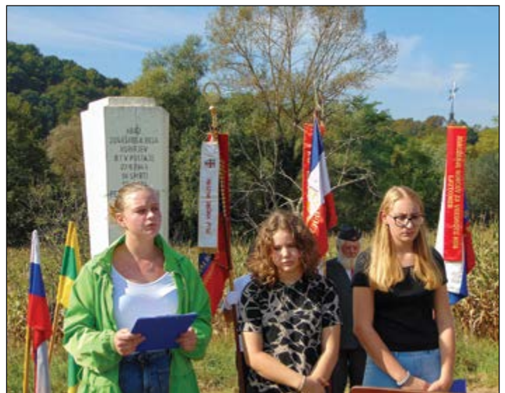
Utrinki z letošnje proslave pri spomeniku padlim v Zg. Pristavi