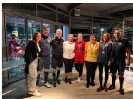
Footgolf – ženske