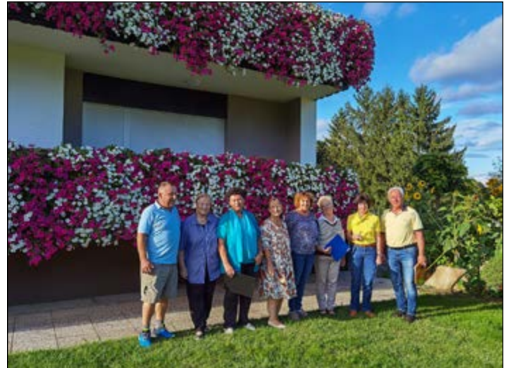
Ocenjevalna komisija v letu 2023