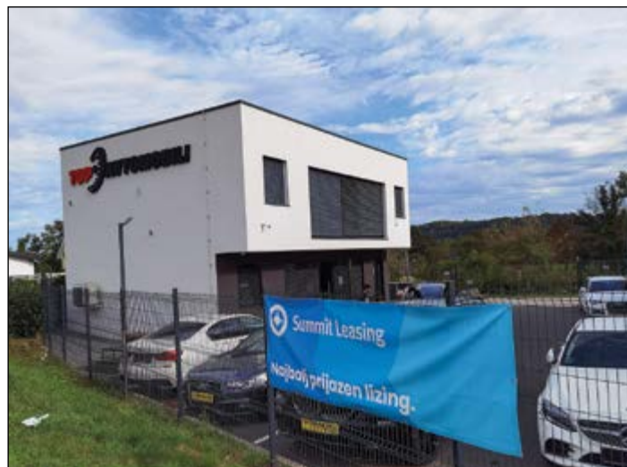
Priznanje za urejenost poslovnega objekta letos prejme poslovni objekt Top avtomobili v Hajdošah.