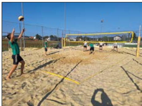
Odbojka na mivki – utrinek s turnirja