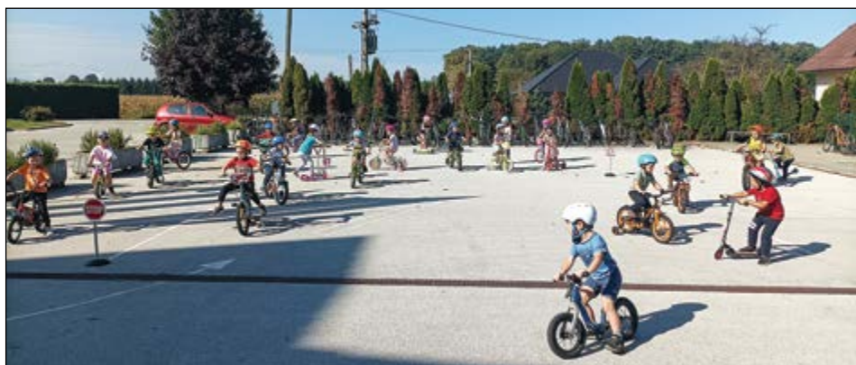
V tednu mobilnosti smo se v rdeči igralnici varno podali na kolesa, skiroje in poganjalce.