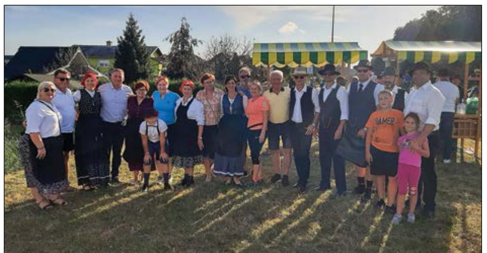
Kolesarji iz Skorbe in občinsko vodstvo na slavnostnem dogodku