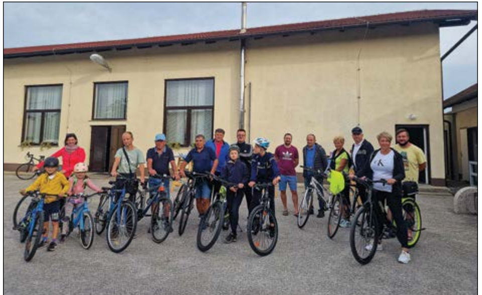
Letošnji kolesarski utrinki iz Skorbe