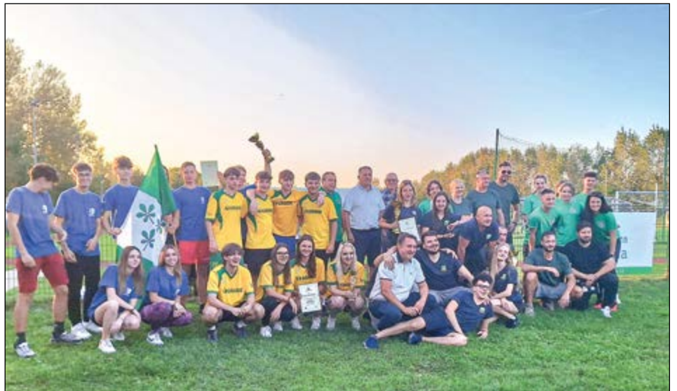
Letošnja številna ekipa na Igrah dobre volje v Hajdošah