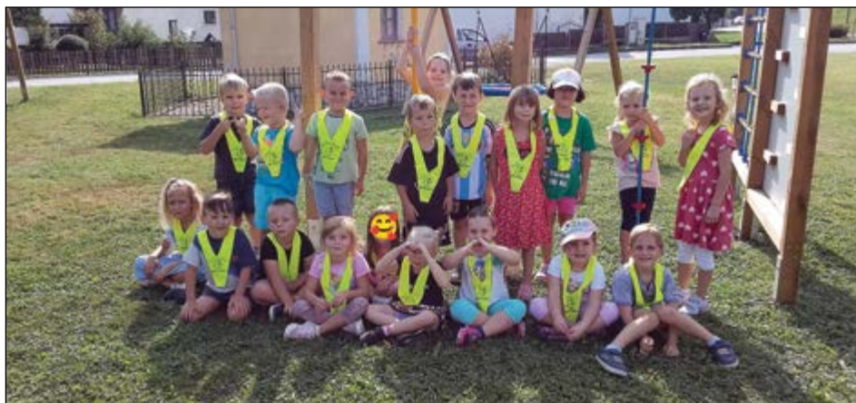
Otroci iz bele igralnice na daljšem pohodu in ob igri na novih igralih pri občini.