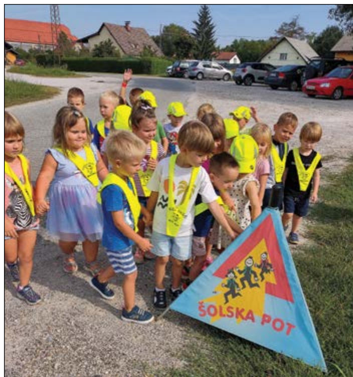
Otroci rumene igralnice so spoznavali prometne znake v okolici vrtca.