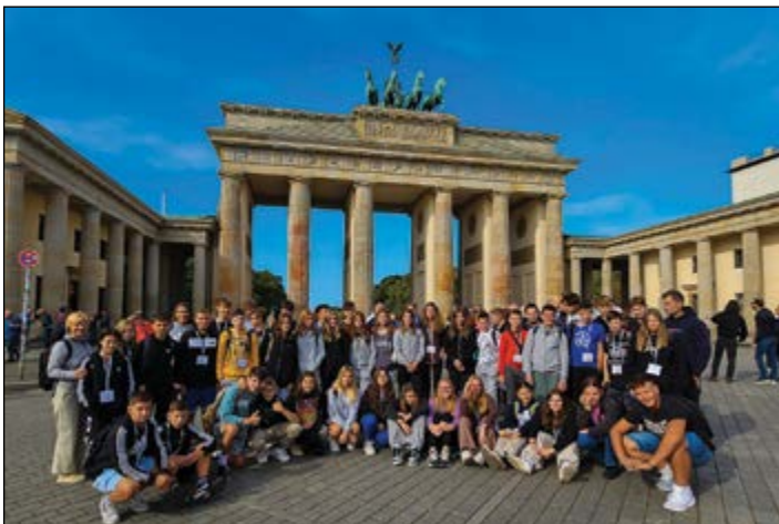
Učenci 8. in 9. razredov so na jezikovni ekskurziji raziskovali Berlin.