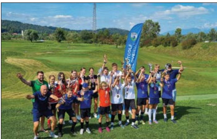
Udeleženci in prejemniki medalj na Državnem prvenstvu v footgolfov v Ljubljani.