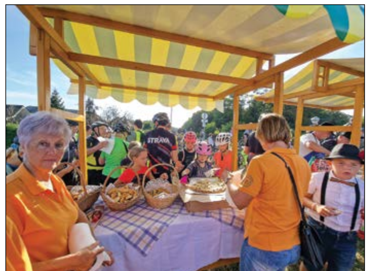
Draženske gospodinje so kolesarjem postregle z domačimi dobrotami.