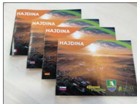
Novi turistični katalog Info Hajdina 2023