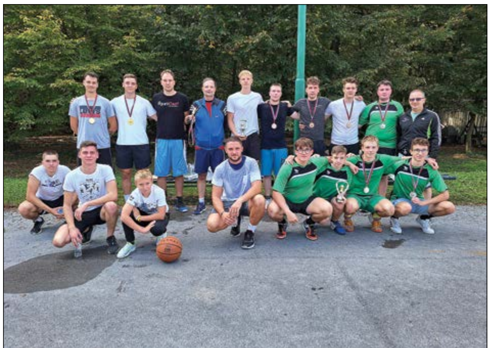
Košarka 3:3 – skupinska fotografija