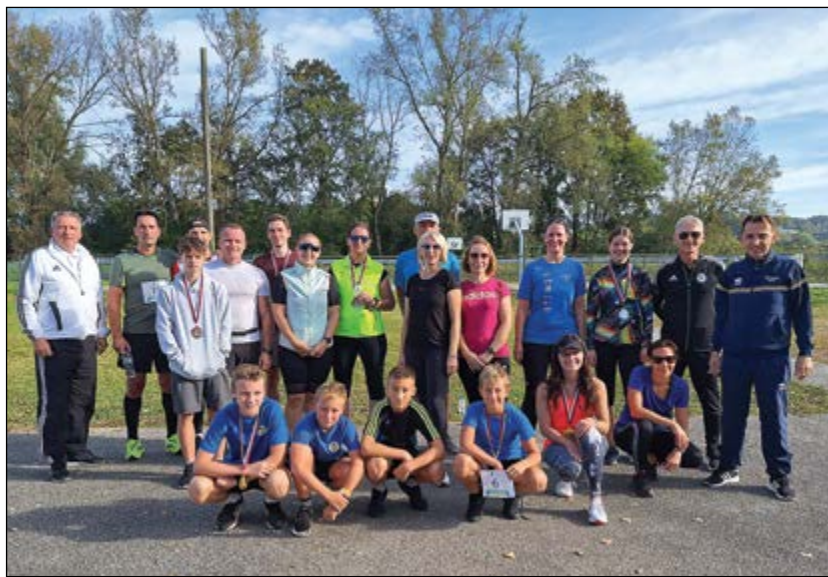
Skupinska fotografija Hajdinske desetke