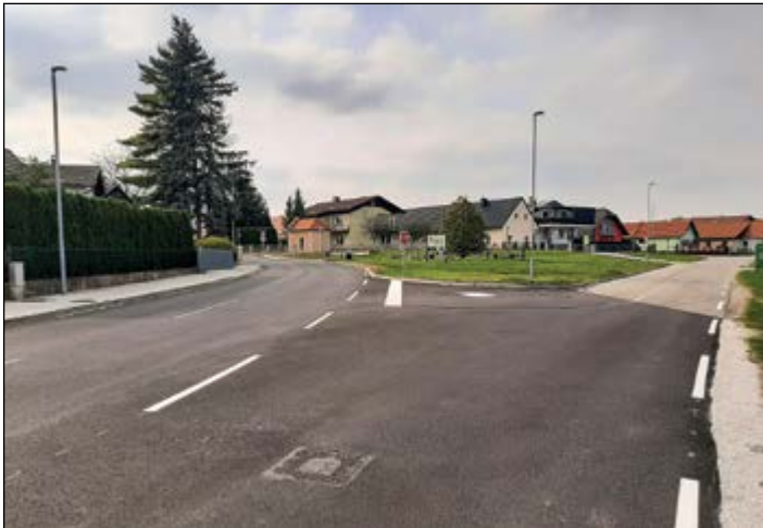
Končana so vsa gradbena dela na lokalni cesti od Sp. do Zg. Hajdine.