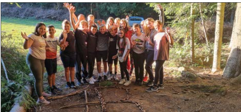
Učenci 7. b na taboru