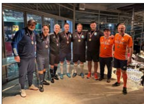
Footgolf – najboljše ekipe (z leve): Hajdina, Skorba in Gerečja vas.