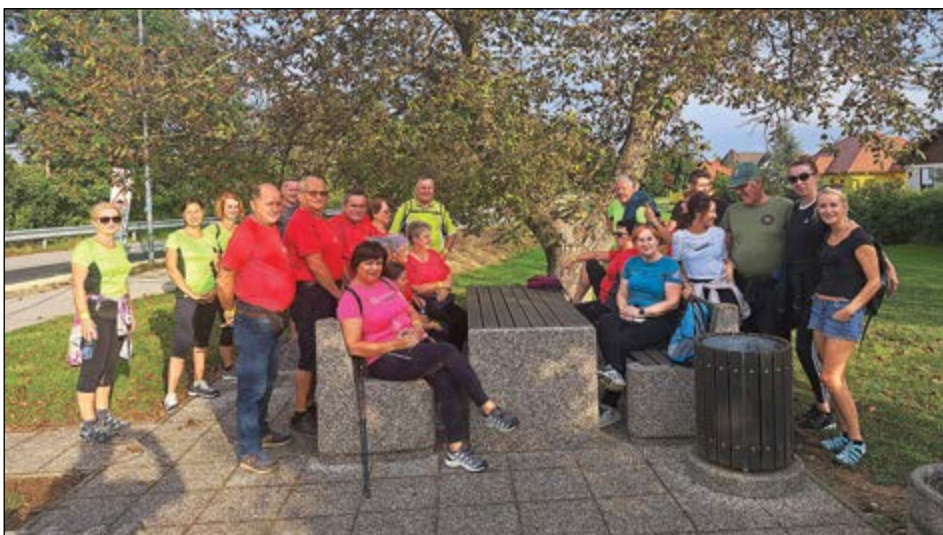
Izvedli smo tudi skupen pohod s Komisijo za mlade Občine Hajdina. Prehodili smo pot iz Skorbe do Hajdoš.