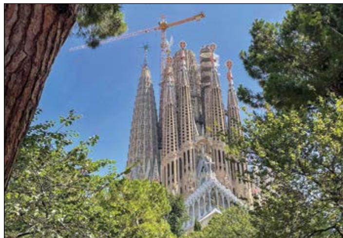
S svojo arhitekturo je posebej očarala Sagrada Família v Barceloni.