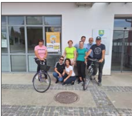
Utrinek s Tedna mobilnosti v Občini Hajdina.

V tednu mobilnosti so se k projektu pridružili tudi zaposleni na občini. Tudi sami so se odločili za trajnostne oblike prevoza in tako dali zgled celotni skupnosti. V teden mobilnosti so se z različnimi dogodki vključili tudi člani Društva upokojencev Hajdina. V sodelovanju s Svetom za preventivo v