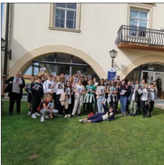
Učenci 6. in 7. razredov so kulturni dan izpeljali na Ptuj. Med drugim so obiskali tudi Knjižnico Ivana Potrča.