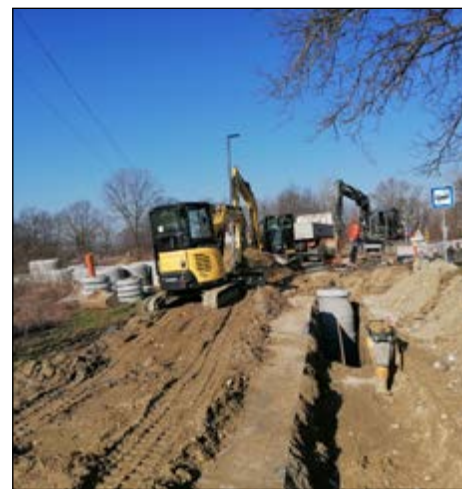
Letos jeseni se končuje pomemben projekt »Odvo-dnjavanje in čiščenje odpadne vode in porečju Drave – Občina Hajdina«.