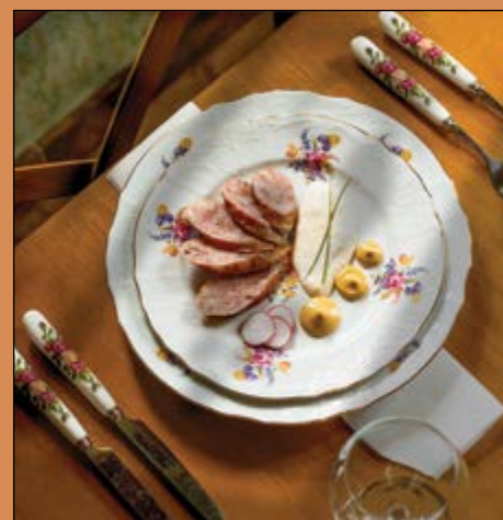
Ponudba na Janževini je pristna, lokalna.