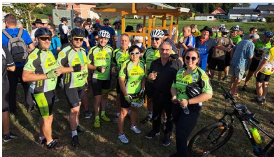
Petalni iz Gerečje vasi na otvoritvi kolesarke