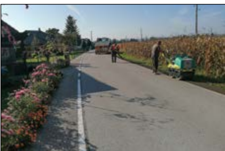
Redna vzdrževalna dela po naseljih ...