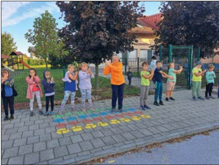
Ob pomoči članic Šole zdravja s Hajdine preko proge smo se zjutraj dobro razmigli in potelovadili.