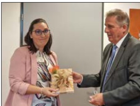
Utrinek s sprejema v prostorih hajdinske občine