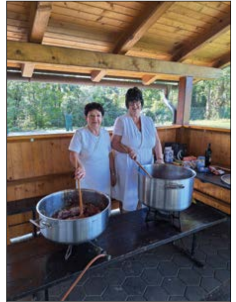
Hajdoška kuharska ekipa je skrbela za hrano na Igrah dobre volje.