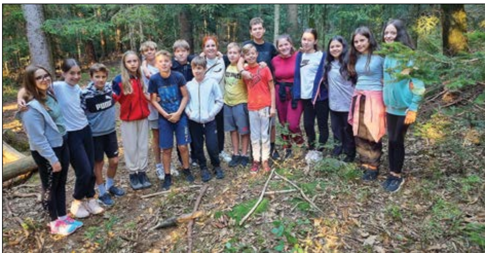
Učenci 7. a v Škorpijonu