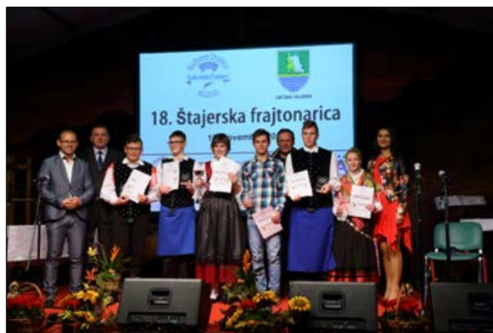
Štajerska frajtonarca se vrača na osrednji občinski oder.