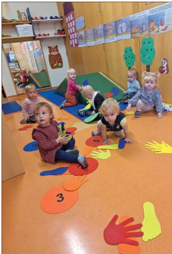
Najmlajši otroci roza igralnice uživajo v fit gibalnici, nadstandardni dejavnosti za otroke prvega starostnega obdobja.