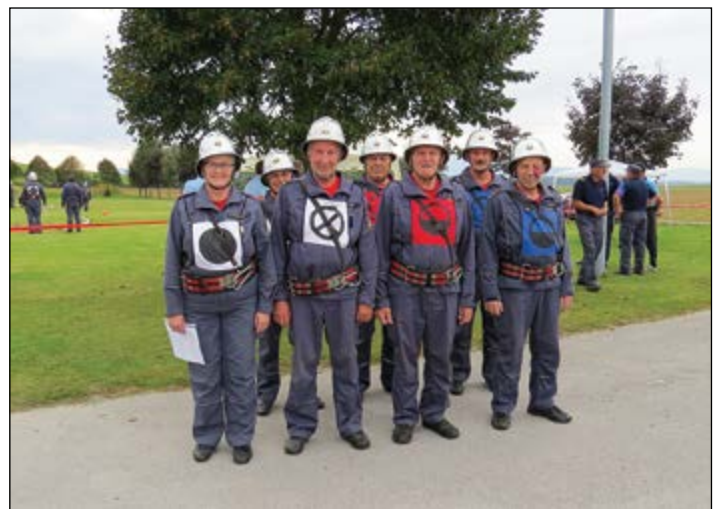
Tekmovalna enota PGD Slovenja vas na enem od zadnjih letošnjih tekmovanj