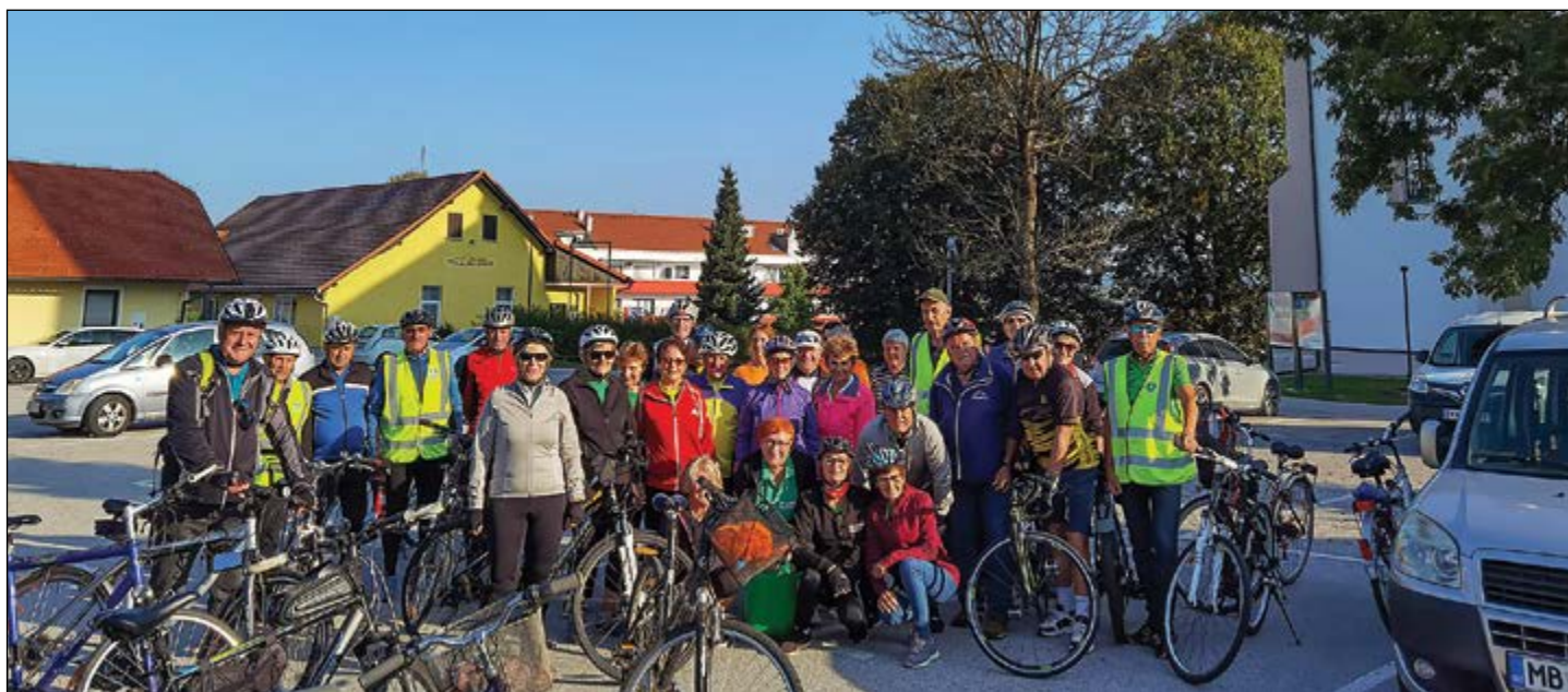
Za zdrav življenjski slog je bilo namenjeno tudi kolesarjenje upokojevcev po vseh vaseh Občine Hajdina, tudi v počastitev bližajočega se občinskega praznika.