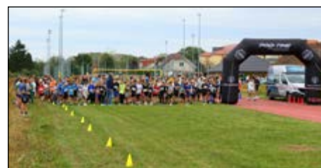
Medobčinski kros 2023 in tekači na startu