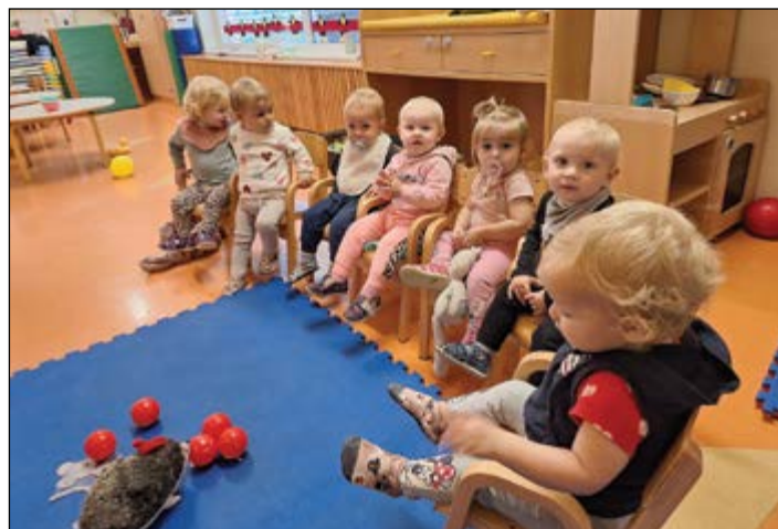
Kaj počne ježek z jabolki? Otroci roza igralnice so odgovor že spoznali.