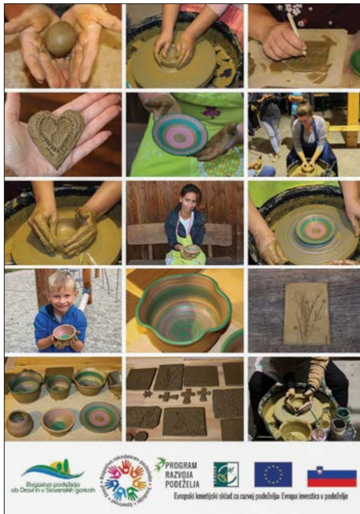
LAS Bogastvo podeželja – lončarska delavnica letos oktobra.