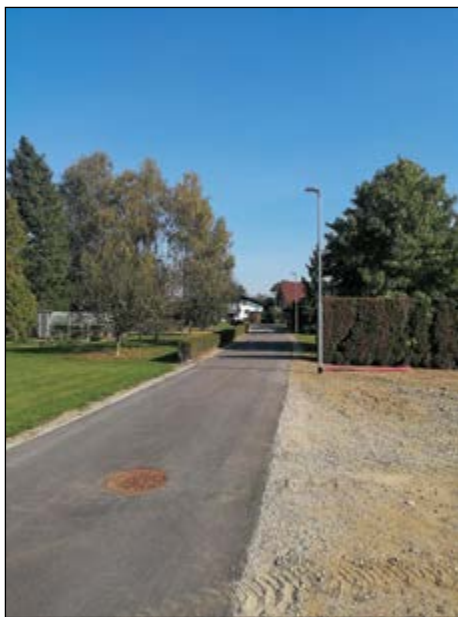
Na novo je izgrajenih nekaj novih odceпов javne razsvetljave.