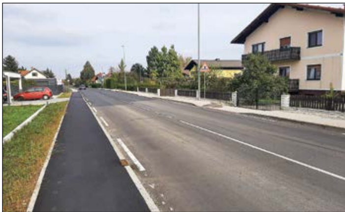
Na Zg. Hajdini je izgrajen tudi nov hodnik za pešce v dolžini 80 m.