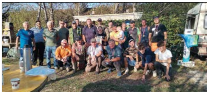
Ribolov četvorke in udeleženci na skupinski fotografiji