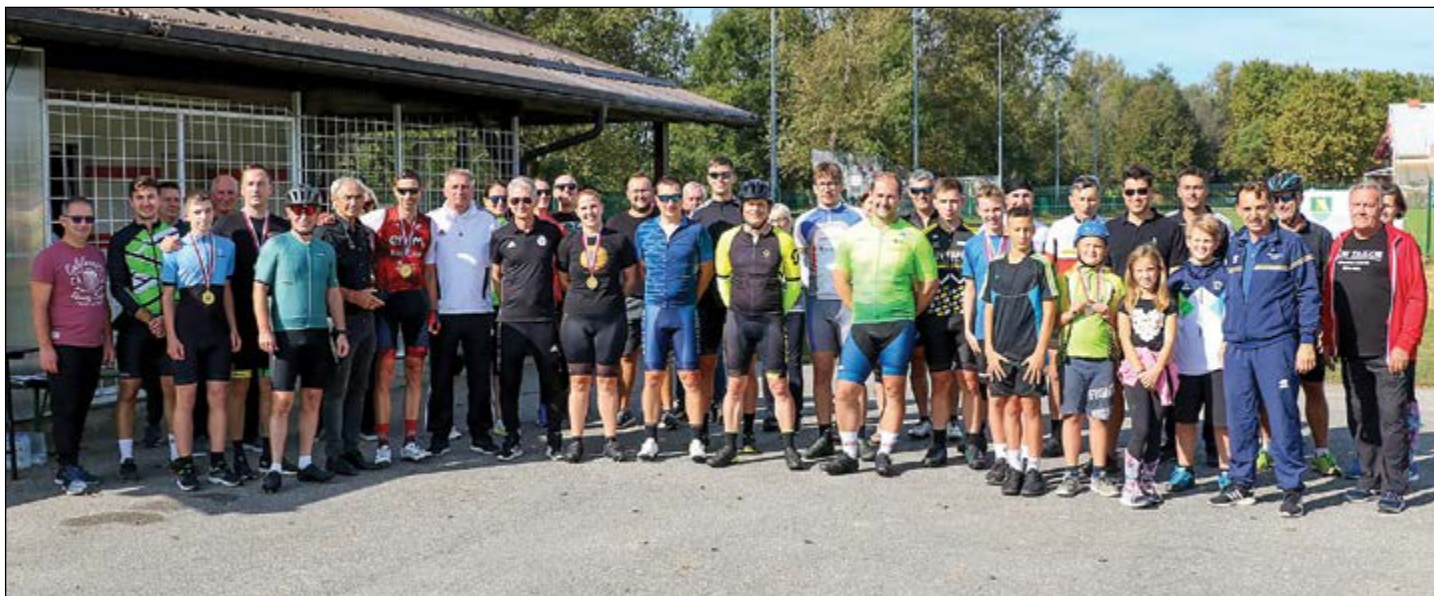
Skupinska fotografija kolesarskega kronometra