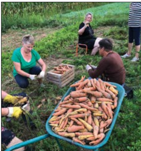
Na gerečki ženski njivi je bilo delovno.