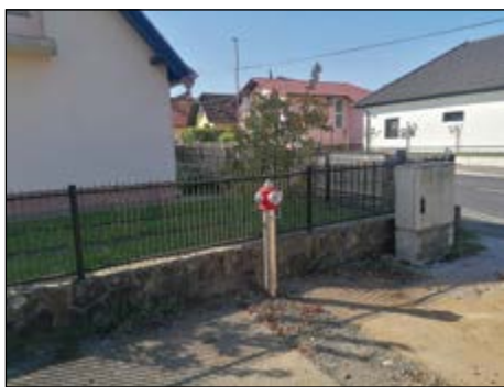
Urejena so tudi nekatera območja, kjer so postavljene hidranti.