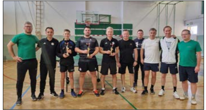
Tekmovanje v tenisu (pari) in letošnji zmagovalci