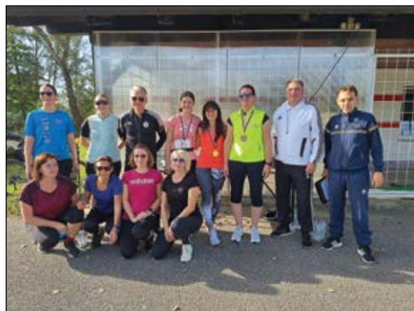
Hajdinska desetka in letošnje tekačice