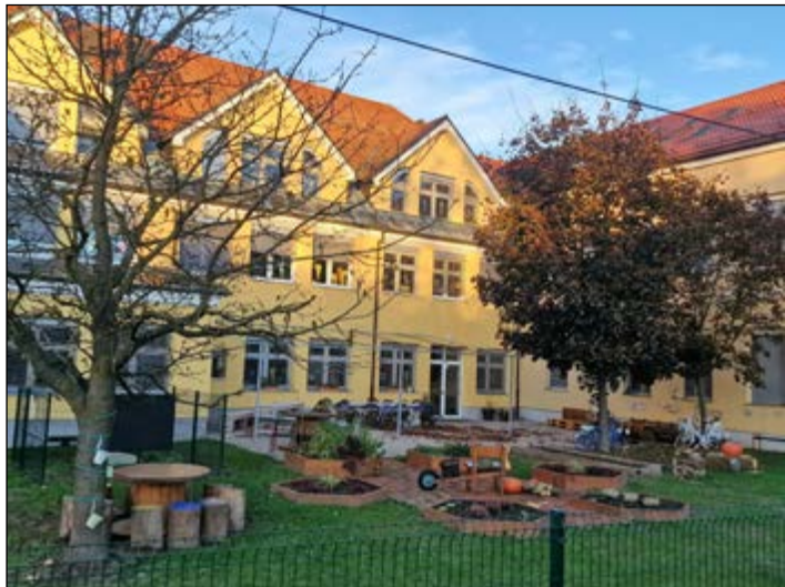
Hajdinska šola ima od letos povsem novo učilnico na prostem.

Na zemljišču Osnovne šole Hajdina, med stavbo in državno cesto, smo odstranili zagrajeno območje zastarelega plinohrama ter ga zamenjali z novim in manjšim. S posegom je osnovna šola pridobila lep prostor, kjer so učenci skupaj z učitelji že uredili novo učilnico na prostem.