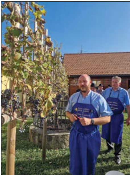
Bila je vesela trgatvev pri Hramu hajdinskih kletarjev.