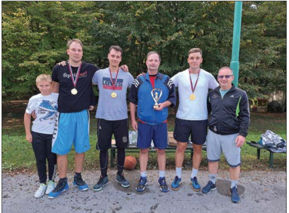
Košarka 3:3 – zmagovalna ekipa iz Slovenje vasi