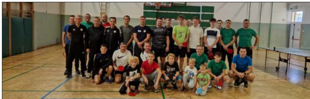
Skupinska fotografija vseh letošnjih udeležencev turnirja v namiznem tenisu