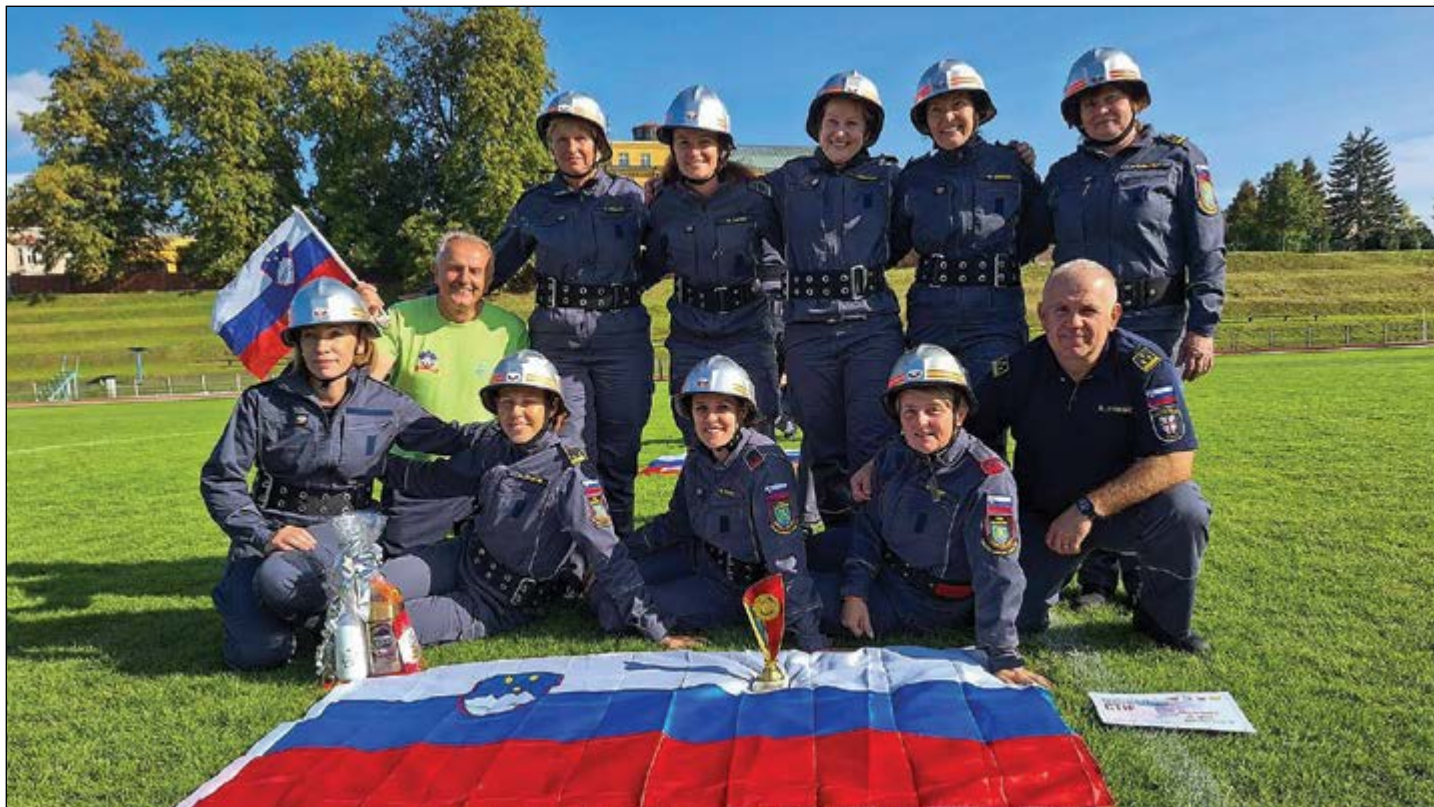
Hajdoške gasilke z mentorjema na gostovanju na Češkem.

V Škofji vasi se je 16. septembra tradicionalno končalo tekmovanje za pokal Gasilske zveze Slovenije za članice in člane. Letošnjega pokalnega tekmovanja se je udeležilo 18 ekip, tekmovanja so potekala v treh kategorijah – člani A in B ter članice B. V kategoriji članic B so gasilke iz Hajdoš v skupnem seštevku znova osvojile prestižni pokal za prvo mesto.