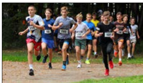
Utrinek s tekaške proge