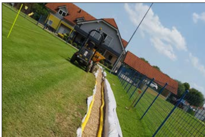
Na igrišču na Hajdini je urejeno odvodnjavanje.