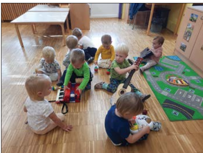
Otroci v oranžni igralnici so uživali ob zvokih, ki so jih izvabljali iz glasbil in zvočnih igrač.