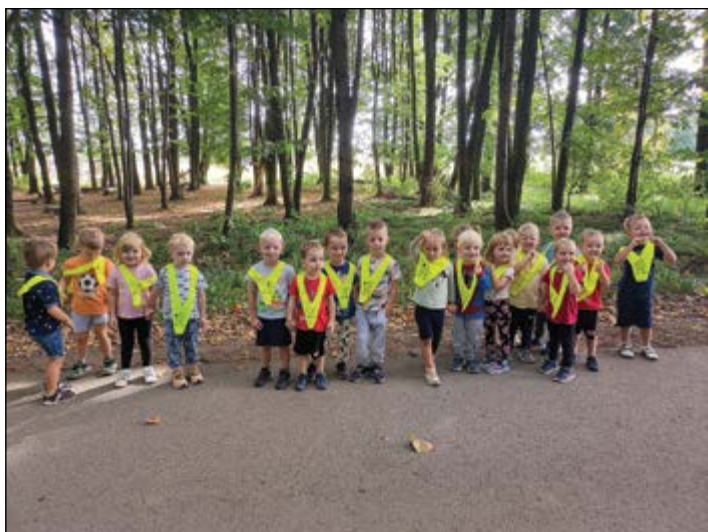
Otroci iz zelene igralnice so na sprehodu raziskovali gozd v lepih jesenskih barvah.