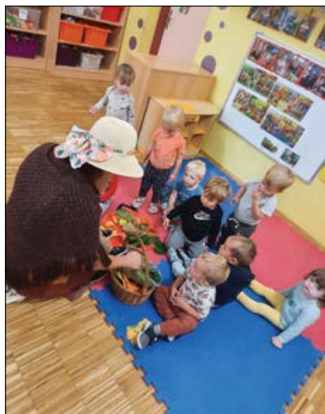
Jesen je prišla v naše kraje, tetka Jesen pa nas je obiskala tudi v naši oranžni igralnici in nam prinesla košaro jesenskih dobrot.