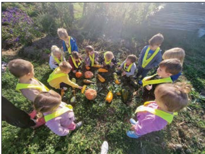
Otroci iz modre igralnice so se odpravili na njivo iskat buče. Spoznavali so, kaj vse lahko pripravijo iz buč in bučnic.