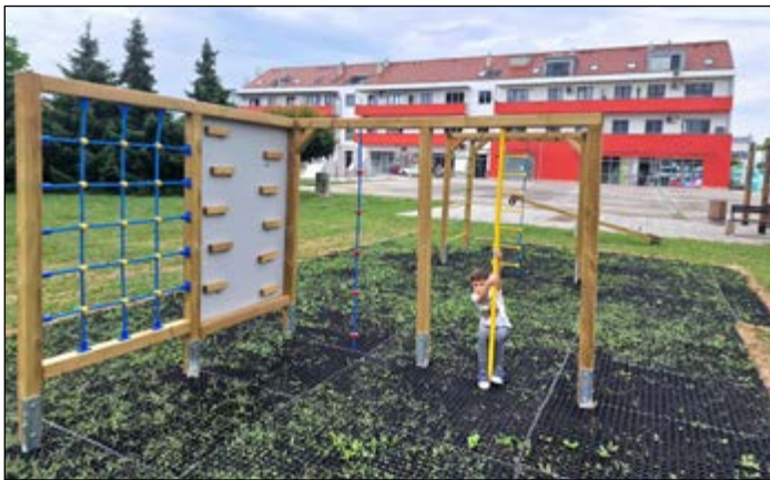
Na osrednjem občinskem trgu so najmlajšim na voljo nova sodobna igrala.