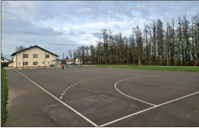
Naselje Draženci bo v sklopu participativnega proračuna pridobilo košarkarsko igrišče pri domu vaščanov.