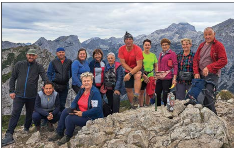
Člani PD Hajdina na Debeli peči, na višini 2014 metrov.