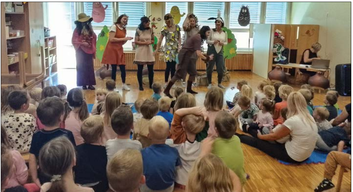
»Kako diši jesen« je bila predstava vzgojiteljic za najmlajše.