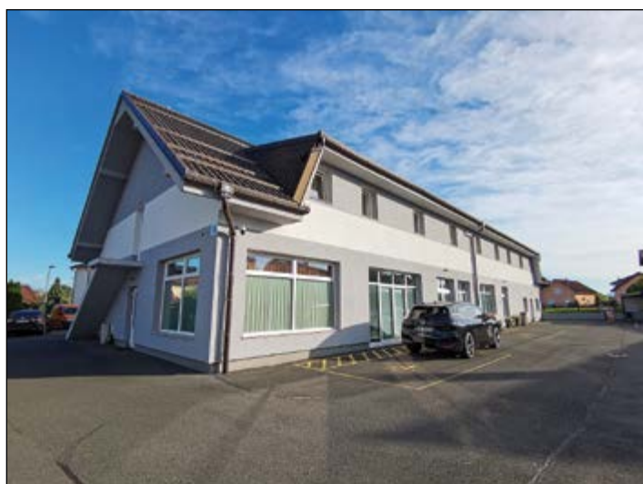
Hotel Murat Zg. Hajdina