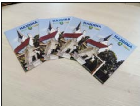
Novi letaki Info Hajdina 2023