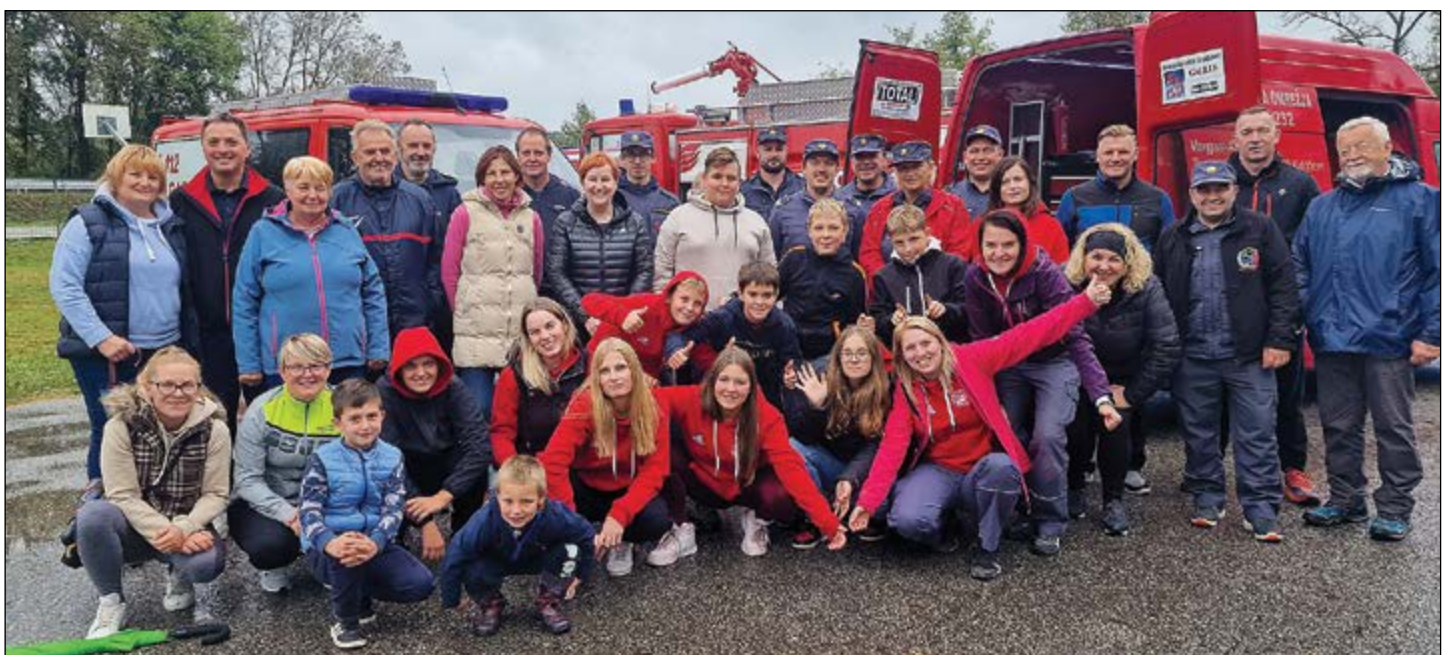
Gasilci in obiskovalci dogodka, posvečenega ozaveščanju v mesecu požarnega varstva.