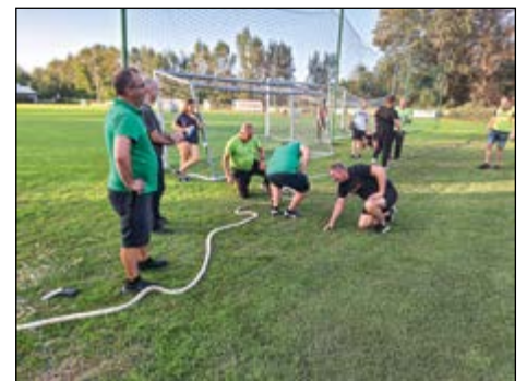
Po koncu tekmovanja med ekipami sodelujočih občin so se v vleki vrvi pomerili tudi domačini.