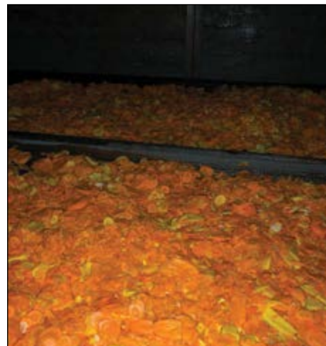
Pridelki so pospravljeni in pripravljeni na sušenje.