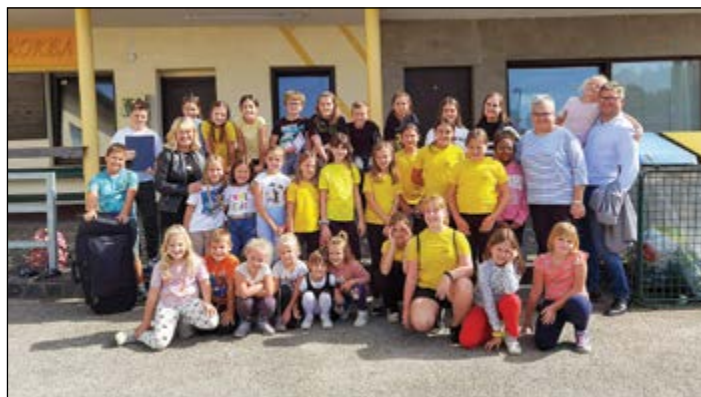
Nastopajoči učenci iz Osnovne šole Hajdina s svojimi mentoricama in ravnateljem