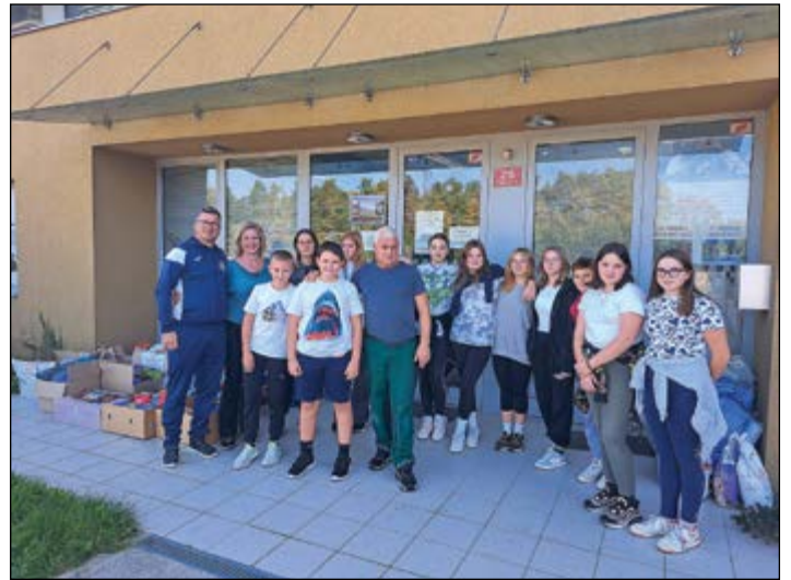
Ob svetovnem dnevu živali smo zbirali hrano in pripomočke za zapuščene živali ter zbrano predali ob obisku Zavetišča za živali Maribor.