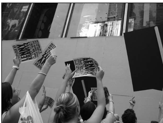
Sl. 2, 3, in 4: Simulirano oboževanje. 7 Fig. 2, 3 and 4: Simulated admiration.

nejasen. Pristop je učinkovit, saj prav z nakazovanjem, nedokončano zgodbo oz. zgodbo brez jasnega sporočila vzpodbudi potrebo po ustvarjanju smisla, razumevanju sporočila. Psihološki preskok smiselne interpretacije in razumevanja naj bi bil vzrok za to, da bo posameznik kupil sporočilo (Rushkoff, 2000). Tržne komunikacijske, predvsem oglaševalske kampanje, kot odgovor na izzive trenutnega komunikacijskega okolja uporabljajo tehnike ironije in samoironije, s katerimi (samo)ironizirajo pretekle medijske reprezentacije lastne blagovne znamke, določene trende ali problem medijske manipulacije in potrošništva oz. natančneje samega akta prodaje . Kot že rečeno, pa le do določene mere, skratka (razumljivo), nikoli res direktno in dokončno ne dekonstruirajo lastne blagovne znamke oz. sporočila oglasa, s tem pa se sicer na neki način "priklopijo" na relativno "medijsko osveščeno" ciljne skupine (Rushkoff, 2000). Povečanje televizijskih (programskih) vsebin, ki se ironično odzivajo na probleme potrošništva, globalizacije, kapitalizma, medijev in oglaševanja, imajo funkcijo "varovanja" oglasnih sporočil, od katerih televizijske postaje živijo. Marc Crispin Miller govori o cirkularni kulturni operaciji in ugotavlja, da televizija "brani" oglase pred zasmehovanjem (dekonstrukcijo) s tem, da že sama (s svojimi vsebinami) opravi vse zasmehovanje (Miller v Frank, 1997, 231).