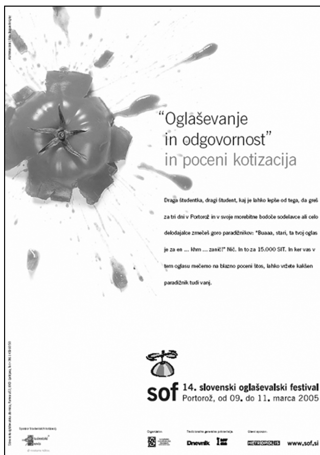
Sl. 5. Kvaziodgovornost oglaševalske industrije. 8 Fig. 5: Quasi-responsibility of advertising business.