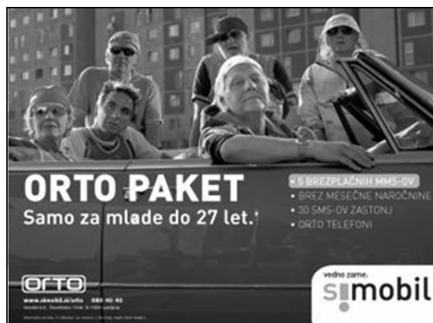
Sl. 8. Kul oglaševanje kot metoda tržne diferenciacije. 13 Fig. 8: Cool advertising as a method of market differentiation.

Metoda prevzema kulturne kritike z namenom prodajanja je še danes v svojem bistvu enaka. Še več, kritika odtujitve in razumevanje življenja, v katero posameznika interpelira današnja potrošniška družba, sta postala atributa, na katerih se gradi lojalnost potrošnikov