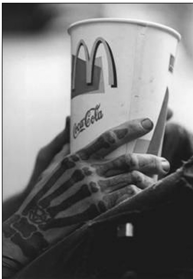
Sl. 10: Brez besed (lokidesign, 2006-03).