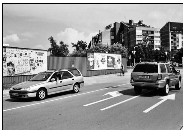
Sl. 6 in 7. Oglas za pičit! 9 Fig. 6 and 7: An ad to sting!

ni socialne države, ki je sicer zgodovinski dosežek delavskega razreda. Za nas je posebej zanimiv razvoj takrat mlade, izobražene in ambiciozne generacije mladih izobražencev, menedžerjev, ki so postali "umetniški kritiki" obstoječega birokratskega razosebljanja množične družbe.