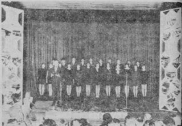
Nastop dijakov gimnazije in ekonomske šole na svečanosti akademiji OF.