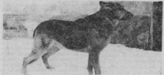
Hera je bil tudi to pot aspešen

Lastnik bifeja o vromu sploh ni vedel ničesar, saj se je prebudil šele po dolgotrajnem klicanju millčnika. Vse ukradene stvari so vrnilo škodovancu, millčnik opazovalec in službeni pes Hero pa zaslužita za hitro intervencijo vso pohvalo. —d