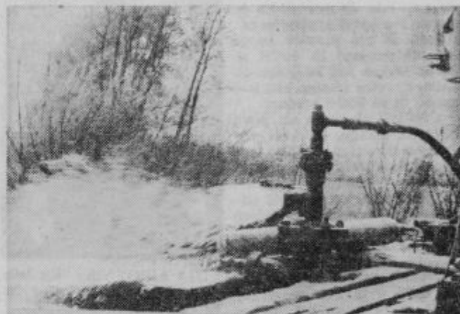
Kompresor pritiska vodo iz vrtine na Turnišču.

Glede na to ker ni močnejšega kompresorja se bodo te dni dogovorili in odločili za eno od treh možnosti nadaljnje raziskave za ptujske toplice. Prva možnost je dobiti močnejši kompresor, drugi dve pa preizkusiti vrtini v Bukovcih in Podložah. Slednji dve možnosti bi po predvidevanjih hitreje raziskali, saj so vrtine nepoškodovane. ZR