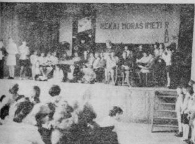
Mladi pesniki in recitatorji na odru