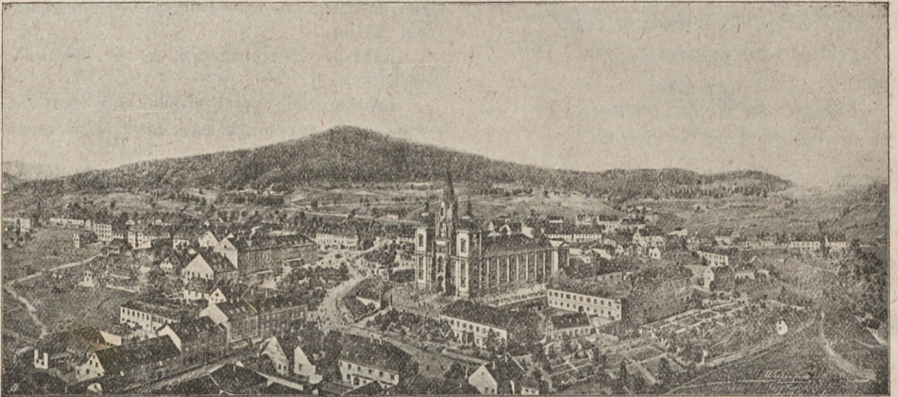
Marijino Celje na Gornjem Štajerskem.