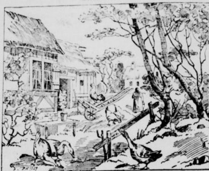
Kje je lisica?

svoje domače, časih iz bahavosti, da pokažejo koliko zaslužijo, drugikrat zopet iz prave ljubezni do svojcev. Ne enemu, ne drugemu ne pustimo, da bi nam zmešal glavo!