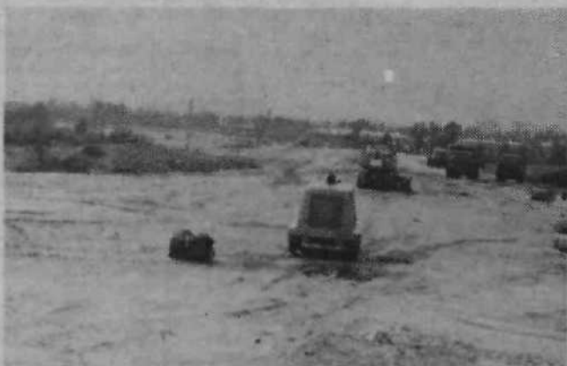
Tudi levo od Titove ceste s štajerske strani je trasa, ki vodi mimo črnuške Industrijske cone, že lepo vidna. Močvirnati teren z ilovico gradbenikom ni naredil preveč težav, le nadvoz nad kamniško progo bo stal na 25 do 30 metrov dolgih pilotih.