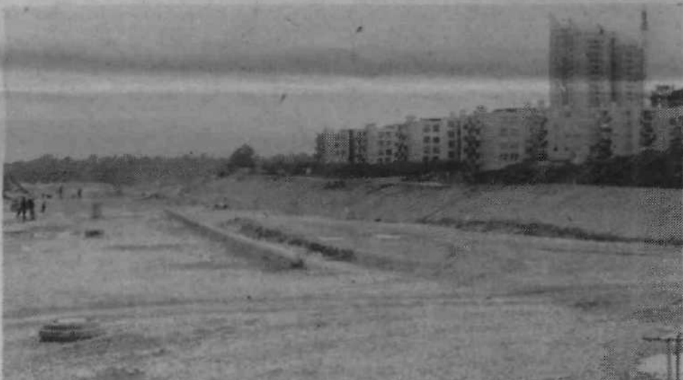
Žal se še vedno niso dogovorili glede odškodnine za hleve konjeničnega kluba. Konjeniki žele iztržiti čimveč, o odškodnini se pogovarja zdaj ta, zdaj oni, vedno pa beseda novega sogovornika velja več kot starega, tako da sporazuma še ni. Hlevi se morajo posloviti še letos, cesta se bo potem severno od nove soseke priključila na Titovo cesto.