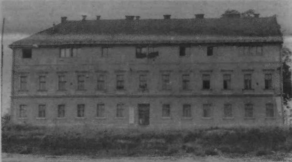
In to je še zgodovinski posnetek ene večjih bežigraskih stavb, ki se bo še letos poslovila. Stanovalci so se v glavnem že izselili, tudi s krajevno skupnostjo bodo problemi glede odškodnine rešeni kmalu. Severna obvoznica bo seveda od tu tekla še naprej, proti Šiški, servisna cesta pa bo imela priključek na Titovo cesto.