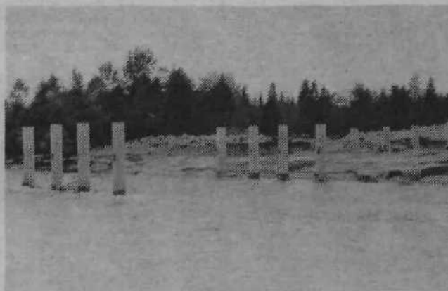
In že smo pri Savi. Dela tečejo na obeh bregovih, postavljeni so že vsi nosilni stebri – to ni bilo majhno delo. Tudi visoka voda jim je v zadnjih dneh ponagajala, nekajkrat odnesla nasipe, pa vendar so obrisi mostu na desnem bregu Save že vidni.