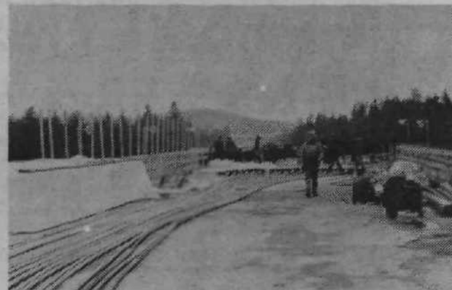
Tole je prvi posnetek z mostu, ki se za zdaj končuje še tik nad reko. Najprej bodo postavili polovico mostu, da bodo po njem lahko preko Save vozili gradbeni material. Delavci in gradba ne poznajo počitka.