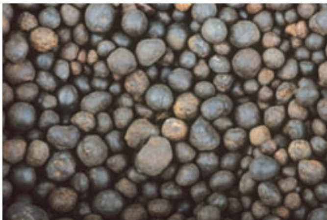
Bobovci s premerom do 10 mm z Rudnega polja. Zbirka Prirodoslovnega muzeja Slovenije.

V naših krajih so nabirali bobovec in ga talili v železo že v predzgodovinski dobi. Bil je osnovna ruda za razvoj železarstva na območju Železnikov, Bohinja, Kroke in Kamne gorice. Bobovce Pokljuke in Jelovice v Triglavskem predgorju so nabirali kmetje, pozneje fužinarji, v kotanjah in vrtačah. Bobova ruda je bila iz manjših zrn oz. manjših konkrecij, velikih od lešnika do oreha, redkeje so našli večje kose. Vsebovali so med 30 in 50 mas. % železa. V posameznih vrtačah je bilo do 1 t rude, kar je pri takratni tehnologiji zadoščalo za pridobivanje železa. Konec 18. stoletja je nova tehnologija zahtevala bistveno večje količine bolj bogate rude, zato je tudi železarstvo v naših krajih zamrlo.