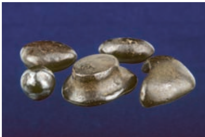
Bobovec z Rudnega polja; premer največjega je 13 mm. Zbirka Prirodoslovnega muzeja Slovenije.

V 11. stoletju so nastali prvi večji železarski obrati. V starem, srednjem veku in v začetku novega so pridobivali železo na direktni, proti koncu 16. stoletja pa na indirektni način v breščanskih ali laških pečeh. To so bili začetki sodobnih postopkov. Konec 18. stoletja je prevzela fužine Zoisova družina in jih uspešno upravljala 130 let. Železarstvo v Bohinju je prekinil požar leta 1890.