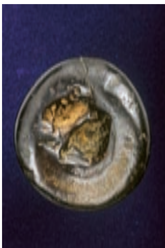
Bobovec iz kamnoloma Peči pri Kanni Gorici; 45 x 40 mm. Najdba in zbirka Vilija Rakovca.

Že v 7. stoletju pr. n. št. so začeli načrtno naseljevati Bohinj prav zaradi pridobivanja železa. Že zelo zgodaj so odkrili rudo – bobovec, iz katere so pridobivali železo in jeklo. Svoj vrhunec sta pridobivanje in predelava dosegla v poznoantični dobi in se znova obudila v času preseljevanja narodov v prostor Norika.