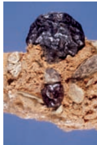
Bobovec v osnovi iz kamnoloma Peči pri Kropi; večje zrno 20 mm. Najdba in zbirka Vilija Rakovca.

Po Sloveniji je veliko limonita. Predvsem v kraškem svetu je med boksiti in terro rosso veliko bobovcev. Bobovca je tudi drugod po Sloveniji kar precej. Že Wilhelm Voss opisuje nahajališča v triasnih apnencih Jelovice, pri Železnikih, Selcih in Kropi, v dachsteinskem apnencu Štefanje gore pri Cerkljah in na Ratitovcu, v krednih skladih Kamnitnika pri Škofji Loki in jurskih skladih Kamniških Alp. Na Bohinjskem je bil mnogo časa glavna železova ruda, lepe bobovce najdemo v okolici Kroke, v kamnolomu Peči pri Kamni Gorici, če naštevamo le nahajališča v Julijskih Alpah in njihovem predgorju.