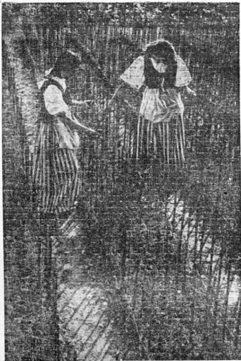
Plantagioni di garofani nella «città dei fiori» a San Remo...