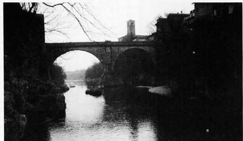
Letošnji koledar slovenskih denarnih zavodov v Italiji je opremljen z izdelki mladih fotografov krožka Foto Trst 80. Na sliki: eden od objavljenih posnetkov — pogled na znameniti most v Čedadu.