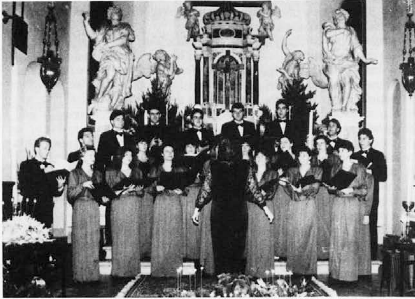
Na Tržaškem in Goriškem so se v teh prazničnih dneh zvrstili številni božični koncerti...

V božičnem času se v naših krajih kar vrstijo koncerti božičnih pesmi, ki so lepa priložnost, da se v ljudeh, ki po domovih ne pojejo več božičnih pesmi ob jaslicah, podoživijo lepe vtise in občutke, kakršne te skladbe vzbudijo v poslušalcu. Podobnih koncertov je bilo v teh dneh veliko; radi bi zabeležili vsaj nekatere.