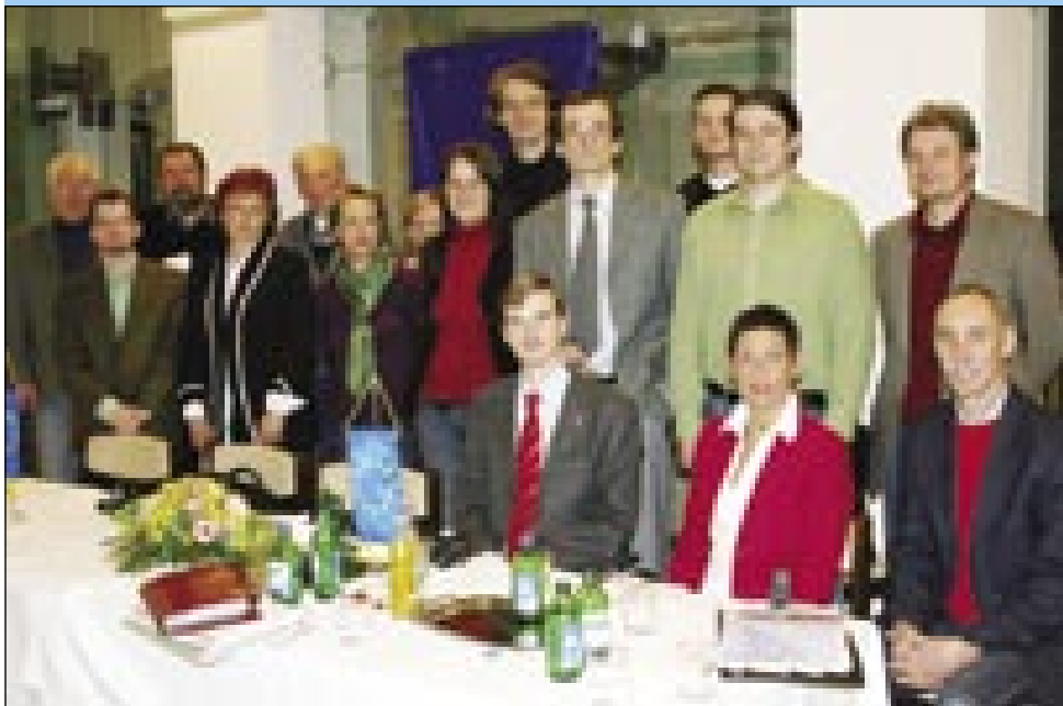
Predstavniki zelenih organizacij iz Avstrije, Slovenije in Madžarske na pogovorih v Monoštru

kak je ma Evropska unija. Dapa zelene in civilne organizacije njim ne vōrvlejo, zatok