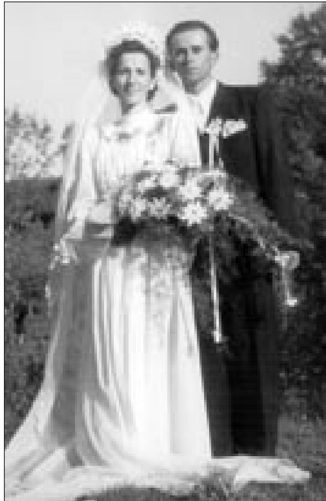
Zdavanjski kejp iz 1952. leta

»Najvekša sreča je bila, ka sva s sestro v Budapešti v ednom mestu vküp delale. Gda sva zgotauvile pa sva na pokoj šle, sva si večer večkrat pripovejdale, ka naja Baug dun rad ma, ka sva vküper. Naja radost je nej dugo trpala, z dau mi je prišo telegraf, naj kak z najprvi cugom domau deva. Očün beteg se je prej na lagvo obrno, doktor tak pravi, ka nejmajo več dugo žitka. Vtjüp sva se pobrale pa sva včasín domau šle, dapa na najino najvekšo žalost sva več samo mtrve najšle. So samo 54 lejt stari bili, gda so mogli 1950. leta s toga svejta oditi. Za lejt volo bi leko eštje dugo žive li, dapa beteg je krepši bijo. 1949. leta smo babo (materno mater) pokopali. Oni so lejpa lejta doživeli, 83 lejt so stari bili, gda so mrli. Gda smo očó sprevodili na večni pokoj, sva s sestrov nazaj šle v Budapešt. Dapa dja sam za en mejsec mogla svojo dobro delo gorapovedati pa tam njati. Mogla sam domau priti materi pomagat, ka so sami nej ladali s telkim delom. Sestra, stera je doma bila, je tó betežna gratala. Krofo je mejla pa se je mujs mogla dati vrejzati, ka njej je znautra tanotra rasla pa njej je že srce tejšila. Dapa operacija se je nej najbola zošikala, doktorge so nika zapravili, ka je potistim takšne krče mejla, ka so go vse vtjüpstgali. Brat, steri je zidar bijo, se je eno leto po očinom smrti oženo, pa je kraj od rama odišo.