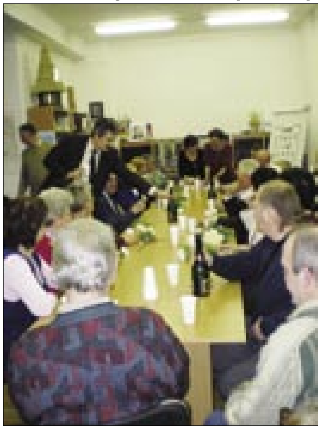
Moški so se skrbeli za tau, naj se ženske dobro počütijo

pesmi, nej samo za tou, ka je prijetno zveneu njegov žametni glas v spremstvi kitarove muzike, nego tudi