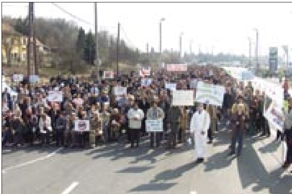
Pronas (Pro natura Szentgotthárd) je 17. marciuša organiziro na mejnom prehodi Heiligenkreuz-Rábfüzes protest, na steroga je pozvau zelene organizacije iz Slovenije pa Avstrije tō

Tak je pisalo na mali zastavičaj, s sterimi je kaulak dvejezero šaularov mašeralo na avstrijsko-vogrsko granico 10. marciuša. Pa tak piše na tistoj velkoj zastavi tō, stera od tauga datuma mau visi namesto vogrske zastave na spomniki prijateljstva, steri je bijo postavljeni ešče pred spremembo sistema (rendszeráltás) na toj granici, kak simbol padaštva med Avstrijci pa Madžari. Pred tejm je en čas visala na tom draugi namesto vogrske zastave črna. Zastava žalüvanja. Zakoj žalüvajo Varašanci, zakoj kakši 17 gezero lidi, ki živijo v krajini kauli tromeje? Če se avstrijski firmi BEGAS posreči plan pa zozida samo parstau metrov kraj od Monoštra velko sežigalnico odpadkov (hulladékégető), leko pozabimo na plane, načrte, ka bi ta pokrajina leko živela od turizma. Od bioturizma, od ekoturizma, od termalnoga turizma. Vej pa steri turist je tak nauri, ka se pride kaupat v termalno kopališče, pa gda vōstauipi na dvera, zagledne orau (dimnik), s stere se den nauč kadi. Steri turist bi se rad šeto po naši gauškaj, po parkaj, če bi mogo vdihavati luft, puno dima, v sterom se leko dostakaj skriva. Istina, ka Avstrijci tak pravijo, ka de te dim tak prefiltrani, spucani, ka v njem nede nika tašoga, ka je nevarno za zdravje. Ka oni prej majo dosta bole sigurne (stroge) predpise,