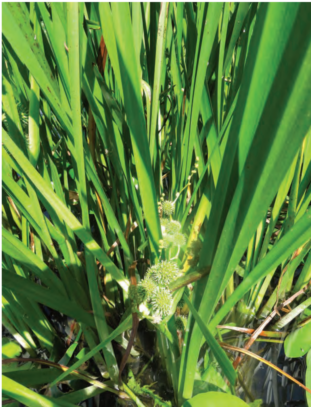
Slika 2: Sparganium sp. , Rinža, Kočevje. Figure 2: Bur-reed, Rinža, Kočevje.