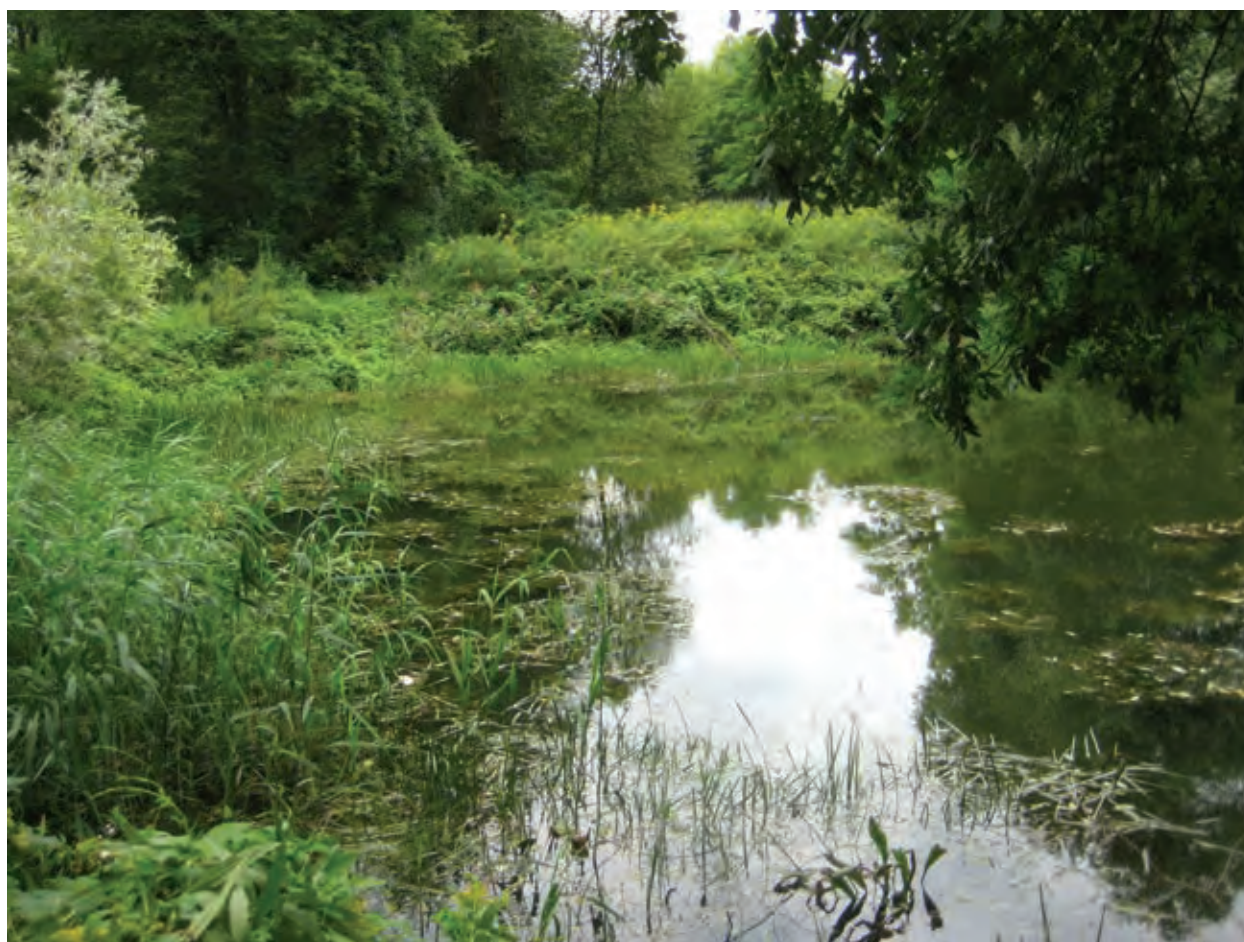
Slika 1: Stojnci, mrtvica v Sigetu. Figure 1: Stojnci, oxbow lake in Siget.

YANG, N., Y. ZHANG & K. DUAN, 2017. Effect of Hydrologic Alteration on the Community Succession of Macrophytes at Xiangyang Site, Hanjiang River, China . Scientifica (London) 2017: 1-10. https://doi.org/10.1155/2017/4083696