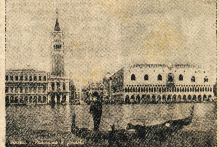
Podoba iz Benetk