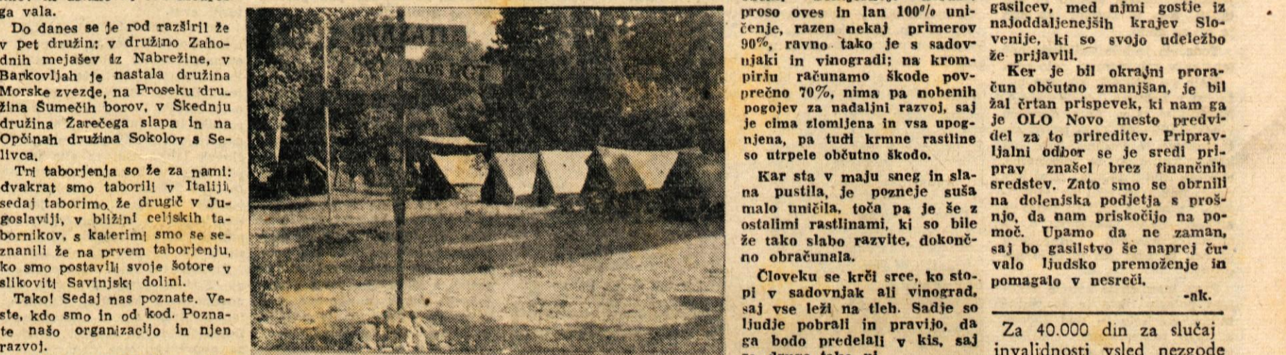
Pogled na del tabora »Skržatova« — članov Rodu gorjanskih tabornikov v Rabeu pri Labinu; taborniki so sredi hrastov, cipres in lip le nekaj minut oddaljeni od morja. Včera zvečer se je vrnila z morja prva skupina 90 tabornikov, danes pa so tam začeli taboriti novomeški učiteljstveni in člani taborniških družin Črnomlja, Senterjerneja in Straže-Toplice.