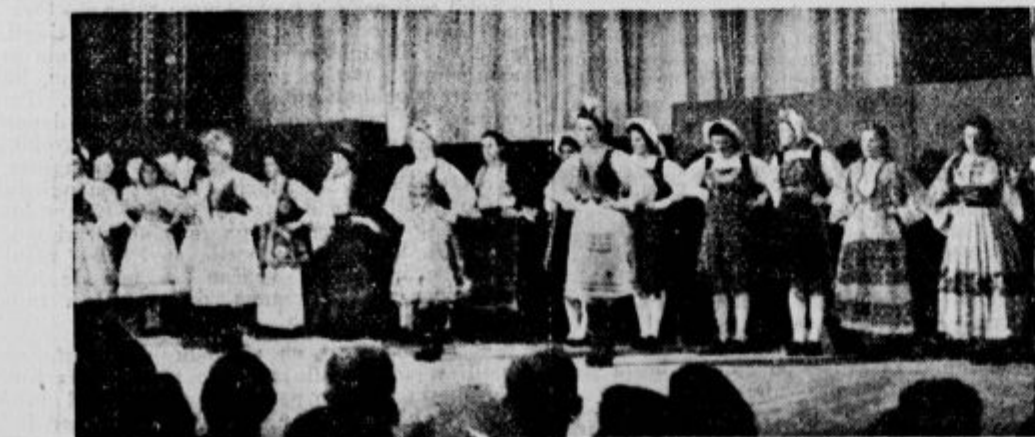
Ljubek prizor iz »Slovanskih plesov«, ki so jih članice DK dovršeno pokazale na nedeljski akademiji ZFO

Vsa posadka, razen dveh mož, je bila takrat na krovu. V poslednjem hipu so vsi poskakali v morje in se rešili. Samo dva, ki sta bila v strojniškem oddelku sta se potopila s podmornico vred. Vendar upajo, da sta še živa, saj imata bržkone še za 24 ur kisika. Med člani posadke je bil tudi filmski operater, ker je hotela podmornica »O 11« skupaj s podmornico »O 9« odriniti na morje, da bi posneli holandski mornariški film.