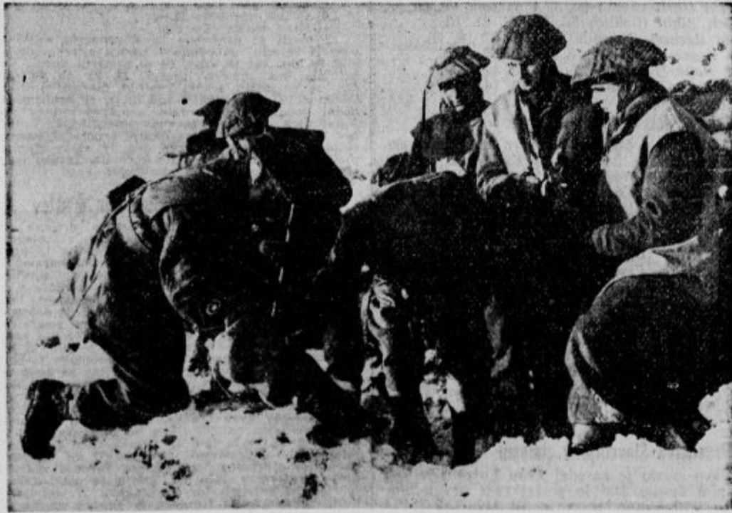
Slika predstavlja četo angleških vojakov norfolškega polka, ki je na nemško-francoskem bojišču. Četa se pripravlja, da odide na patroljo v »pokrajino brezgospodarska«. Pred odhodom vojaki odlože vse, kar ima kakšno vrednost in tudi vse, iz česar bi mogel sovražnik, ako bi bil ujeti, sklepati, in kateremu polku spadajo. Odložene stvari sprostijo v skupno vrečo, ki jo hrani poveljnik do povratka patrolje.