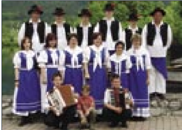
Gorenjeseniška folklori skupina

V Preddvoru na Gorenjskem so meli štiridnevni praznik, šteri je emo naslov Praznik glasbe in veselja . Tau se je dogajalo v celau lejpom mesti, pri jezери (tô) in hoteli med velikimi hribi. Prireditev se je začnila v četrtek, 22. majuša. Te so meli v grajskem paviljonu Hotela Bor otvoritev razstave Likovnega društva Preddvorski samorastniki pa likovnih umetnikov iz Železne Kaplje. Na drugi den, v petek zvečer, je biu slavnostni koncert ansambla Gašperji, z naslovom Gašperji skauzi čas. Svetili so 30. oblejtnico obstoja, toga, ka vküper špilajo. V soboto so meli skorok cejlodnevni program. Tau je biu mednarodni folklori festival. Sem je dobila pozvanje seniška folklori. Odpravili smo se na paut že zrankoma v 6. vöri, ka bi do povorke (felvonulás) prišli ta. Povorka skupin se je začnila v 11. vöri. Sprehodili smo se od šotora, gde je biu nastop do