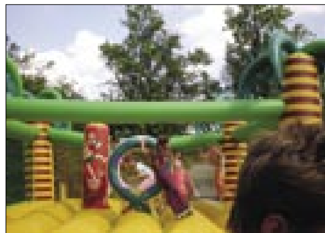
Ob tem dnevu so uživali otroci in tudi malo starejši