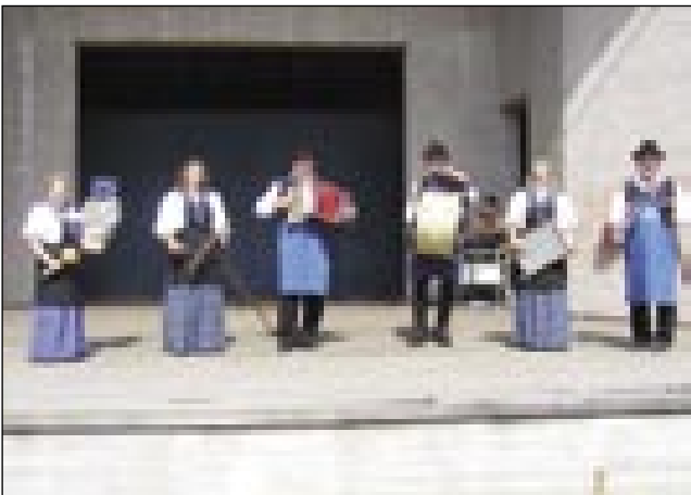
Ansambel Gorički lajkoši

Eške gnauk se lepau zahvalimo našim Lajkošom za lejpi program, za dobro djesti, ka so sküjali, spekli pa za piti. Zahvalimo