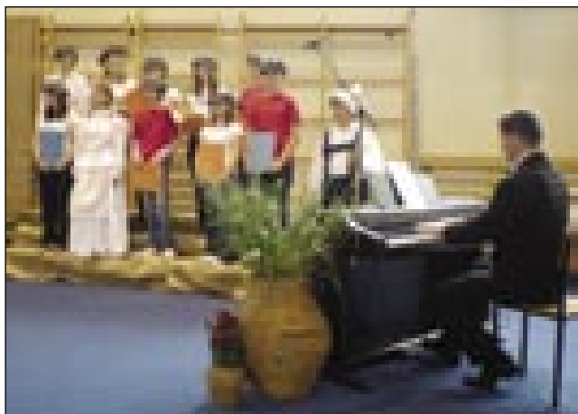
Otroci domače šole

Rada bi se tudi v časopisu zahvalila ravnateljici dobrovniške šole Katarini Kovač