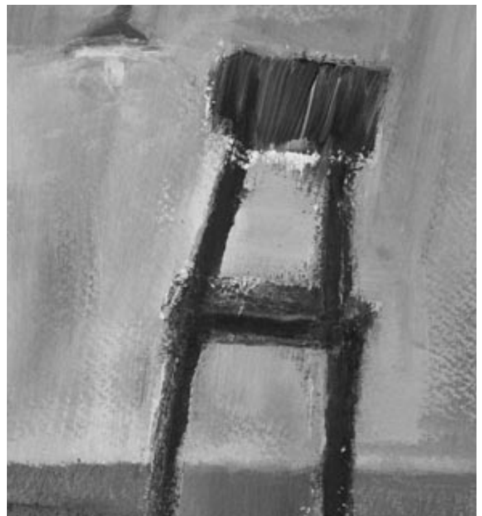
Slika 3: Predmet in njegovo različno videnje. Zaznava je odvisna od posameznikove in družbene zavesti, predstave o določeni entiteti, od zornega kota gledanja, predvsem pa od tega, kaj želimo spoznati, »videti« in uporabiti.

Tehtanje različnih vidikov in iskanje modificiranih rešitev v procesu izoblikovanja arhitekturnega prostora predstavlja način razmišljanja, ki v sinergiji z likovnim načinom razmišljanja lahko privede do optimalno oblikovanega arhitekturnega prostora. Likovno mišljenje torej ni le integralni del načrtovalskega procesa, je več kot to, je ustvarjalni proces sam. Sama likovnost pri tem ponuja širši izbor možnih odgovorov na oblikovanje prostora, s čimer nudi dobro izhodišče njegovemu dokončnemu izoblikovanju glede na danosti, zahteve in potrebe. Likovno oblikovanje seže prav v jedro obstajanja arhitekture, ki brez njega (vsaj v svoji najboljši pojavnih obliki) ne more obstajati.