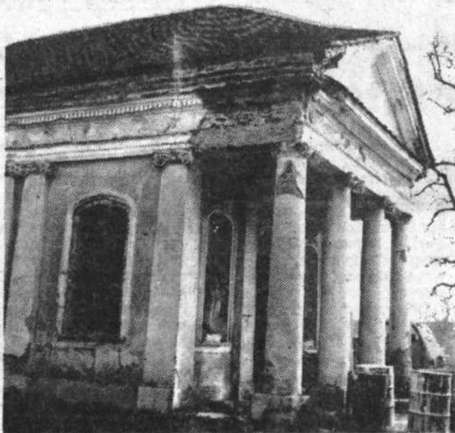
Fotografiji kažeta paviljona pred in po restavraciji, ki je bila izvršena pred dvema letoma. Morda bo v njih v prihodnje umetniška galerija. A karkoli že bo, bo dobrodošlo, privlačno in težko pričakovano.