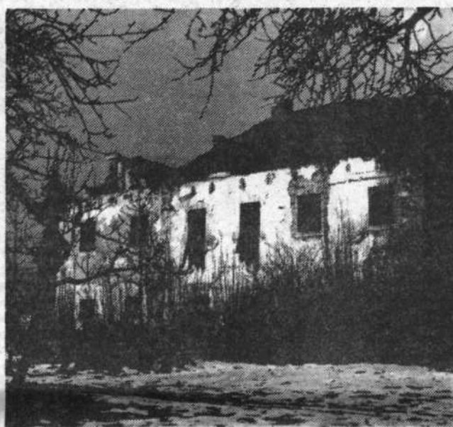
Takole je izgledala graščina v Dolu pred štirimi leti, danes pa je še bolj uboga in žalostna, saj je od takrat odpadla z nje tudi streha.

Graščinski kompleks osmih hektarov omejujejo cesta Dol-Dolsko od kapele do Mlinšči-ce, meja teče po potoku Mlinščica do poljske poti in po njej nazaj na cesto. V zavarovano kulturno dediščino spadajo že delno podrt grad, hlev, kolarnica, vrtnarjeva hiša, cvetličnjak, paviljona in delno ohranjeno obzidje. Vse stoji sredi grajskega parka baročne in svobodne zasnove z nimfejem, vodnjakom, stebriščno ograjo, spominskim stebrom in kapelo ter z drevoredoma gabrov in platan. V neposredno okolje graščinskega kompleksa sodi še ohranjena zasnova glavne poti do gradu ter njene zelene površine, tudi ob cesti Dol-Kleče.