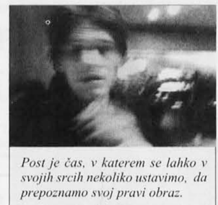
Post je čas, v katerem se lahko v svojih srcih nekoliko ustavimo, da prepoznamo svoj pravi obraz.