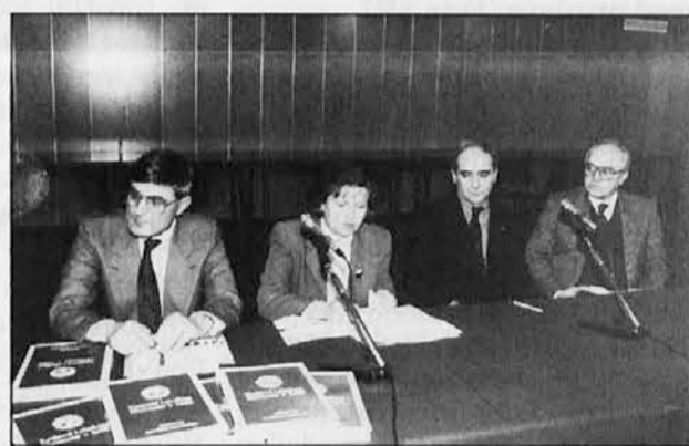
Med predstavitvijo v Kulturnem domu

3) kraji, kjer Slovencev ni več, njihova prisotnost v preteklosti pa je zaznavna v nekaterih priimkih in toponimih.