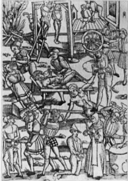
Podoba prikazuje mučenja in smrtne obsodbe, ki so bile v veljavi v XVI. stoletju. Ali nas zgodovina kaj uči?

nesmisel. »Smrtna kazen ni koristna, ker daje ljudem zgled krutosti. Zdi se mi absurd, da zakoni, ki izražajo javno voljo, zaukažejo javni zločin, da bi oddaljili ljudi od zločinov.« Poglavlje 2266 pomeni korak nazaj tudi v primerjavi z izrazito obsodbo smrtne kazni in krivičnega, birokratiziranega pravnega sistema, ki predstavlja eno izmed poglavitnih sporočil Kafkovega literarnega opusa.