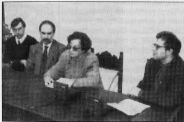
Omizje med proslavo