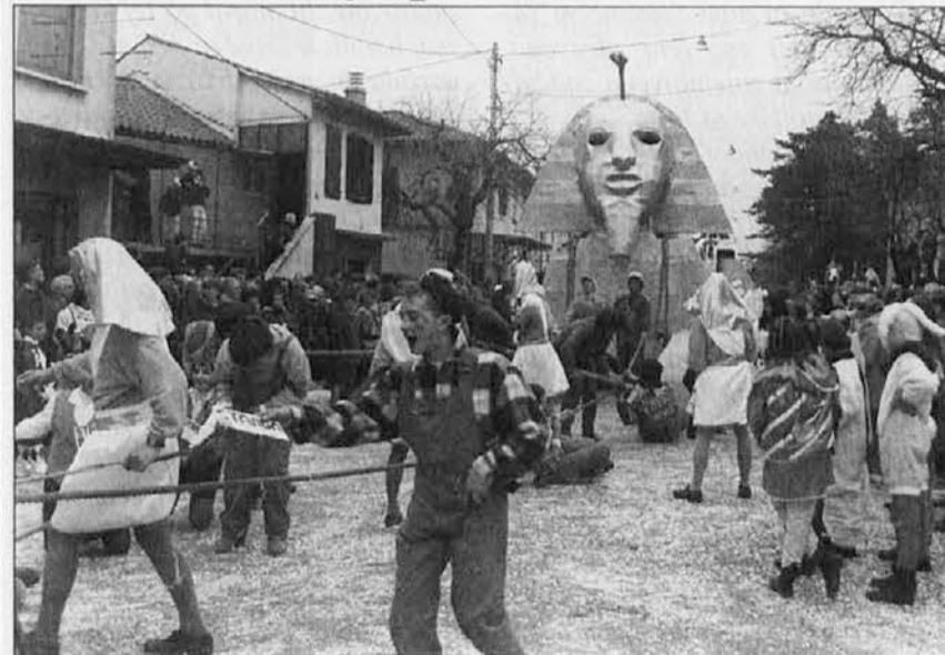
Posnetek z letošnjega Kraškega pusta na Opčinah

Tudi na Tržaškem je v prejšnjih dneh praznovanje pusta doseglo višek, čeprav je slabo vreme konec prejšnjega tedna krepko zagodlo organizatorjem raznih tradicionalnih pustnih sprevodov. Tako sta sprevoda, napovedana za nedeljo, 26. februarja, v Miljah in v Škednju, zaradi močnega dežja odpadla, vreme pa je prizaneslo organizatorjem 28. Kraškega pusta, ki se je odvijal dan prej, v soboto, 25. februarja, na Opčinah. Na letošnjem Kraškem pustu je nastopilo 8 vozov, zmagal pa je voz iz Bazovice; izmed skupin so bili najboljši Boljunčani.