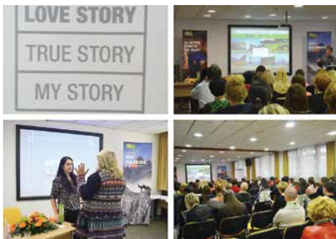
Strokovna konferenca s področja digitalnega turizma v hotelu Ajda v Termah 3000