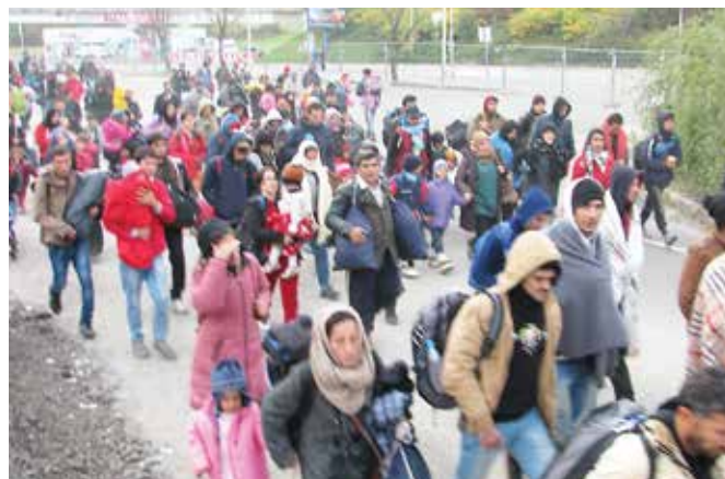
Migranti v Avstrijo vstopajo na dveh izstopnih točkah, preko mostu v Gornji Radgoni in pri Šentilju. Ta nastanitveni center je najbolj obremenjen, saj dnevno sprejme tudi več kot 5000 migrantov, ki jih nato v skladu z dogovorom prevzemajo avstrijski varnostni organi.