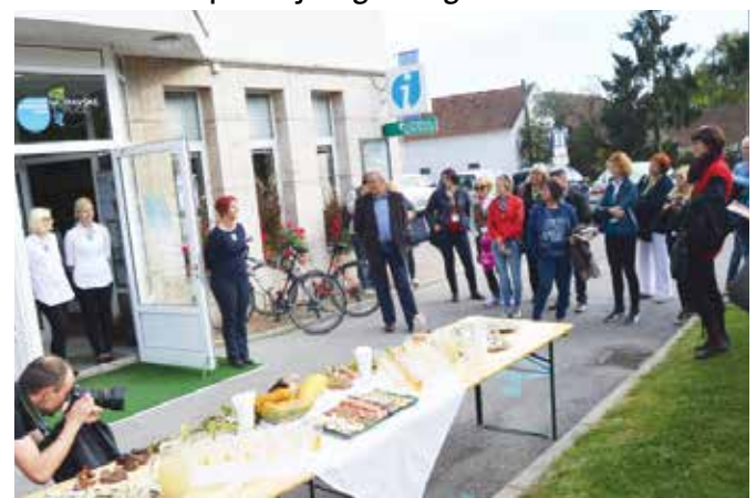
Poslovalnico TIC Moravske Toplice so obiskali predstavniki večjih TIC-jev in LTO-jev iz Slovenije

Dvodnevno srečanje je bilo sestavljeno iz strokovnega in družabnega dela. V okviru strokovnega dela se je okrog 70 skrbnikov portala iz vse Slovenije na konferenci v hotelu Ajda Terme 3000 seznanilo s številnimi aktualnimi novostmi in trendi na področju digitalnega turizma.