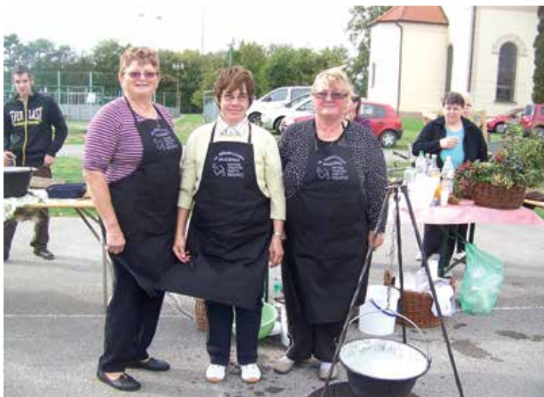
Članice kulturno turističnega društva Žlaki Sebeborci sodelovale v kuhanju dödolov v Puconcih.