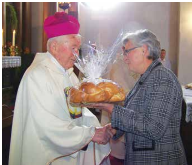
Ob jubileju so mu v dar podarili štolo in vrtanik.