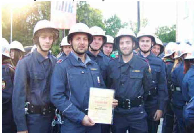
Gasilska desetina gasilskega društva Moravske Toplice sodelovala na mednarodnem gasilskem tekmovanju v Murski Soboti.

V Murski Soboti so v soboto, 3. oktobra potekali »Bogatajevi dnevi zaščite in reševanja«, v organizaciji Gasilske zveze Slovenije in pod pokroviteljstvom Uprave za zaščito in reševanje Republike Slovenije, v sodelovanju z Upravo za zaščito in reševanje Murska Sobota. Sočasno pa je še potekalo 21. državno preverjanje usposobljenosti ekip prve pomoči Civilne zaščite in Rdečega križa. Vse zbrane je pred začetkom tekmovanja pozdravila ministrica za obrambo Andreja Katič, ki se je v svojem govoru dotaknila pomena služb za zaščito in reševanje in samih prostovoljcev, kamor nedvomno tudi