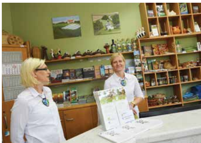
Turistični informatorki sta postregli z obilo informacij, ki še posebej zanimajo turistične delavce

svojo ponudbo oddale Terme 3000. Pri prijavi razpisa so k sodelovanju za izvedbo družabnega dela povabile Zavod za turizem, kulturo in šport Beltinci in skupaj pripravili prijavo. TIC Moravske Toplice in Občina Moravske Toplice smo glede izvedbenega programa izvedeli iz medijev.