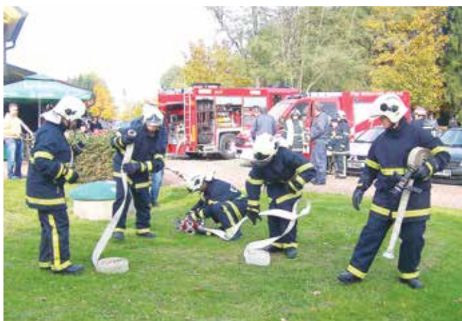
Gasilke so poprijele za gasilske cevi in začele gasiti.