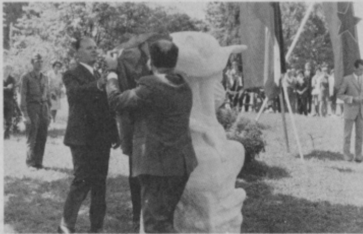
Ob odkritju skulpture v parku

Mnogim večernim sprehajalcem v ptujskem parku bo odslej delal družbo Suženj, ki so ga „vklentili“ na zelenico pred zdravstvenim domom, v senci brez in tik s peskom