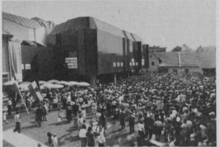
Več tisočglava množica pred ptujsko blagovnico